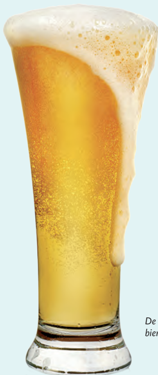
De naam pils komt van de stad Plzeň in West-Bohemen waar dit bier in 1842 voor het eerst werd gebrouwen.

Reizen met de trein is meer ontspannen en biedt een fraai uitzicht. Vaak moet u wel ten minste eenmaal overstappen. De dienstregelingen en bebording op de perrons kunnen soms verwarrend zijn, zelfs voor de