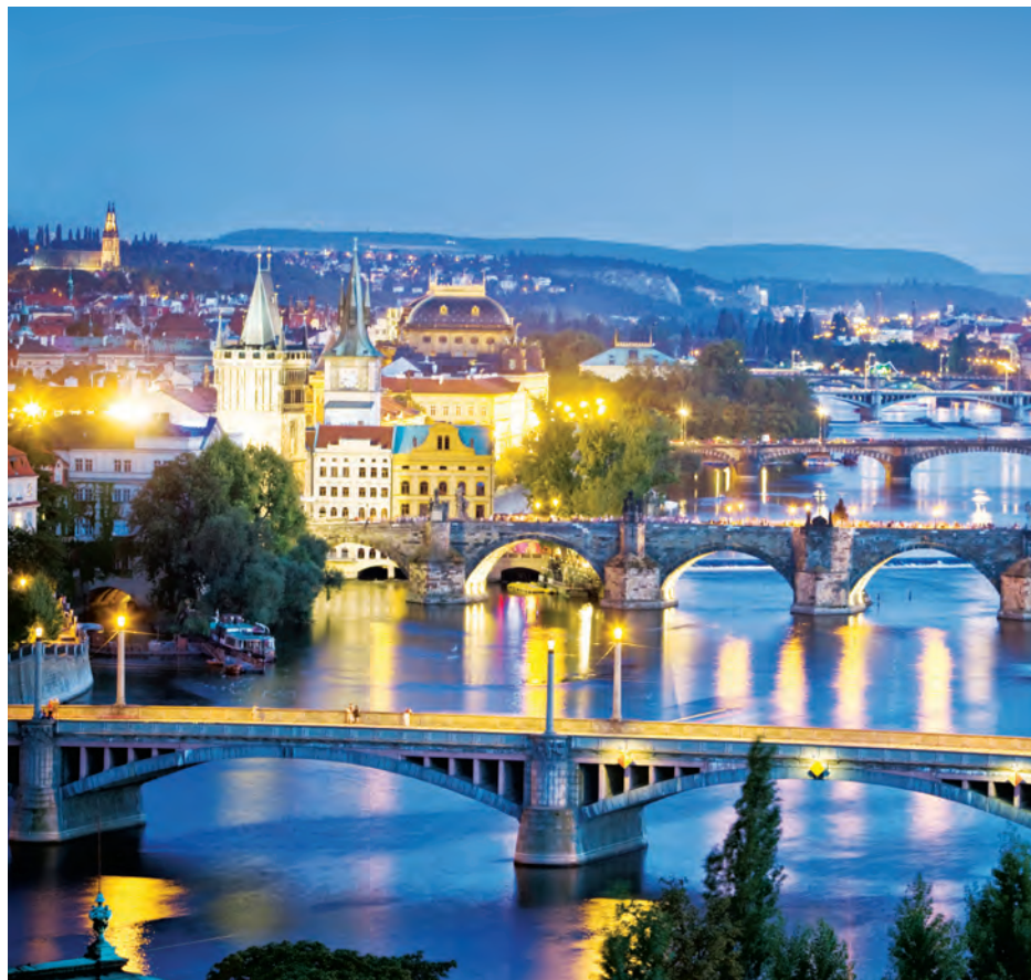
De statige bruggen en torens geven Praag in de schemering een elegante uitstraling.

dat ze nog wat moeite hebben om hun identiteit te vinden. De val van het communisme meer dan dertig jaar geleden luidde een nieuw tijdperk in. Hoewel het land nu ingebed is in het democratische Europa, voelt