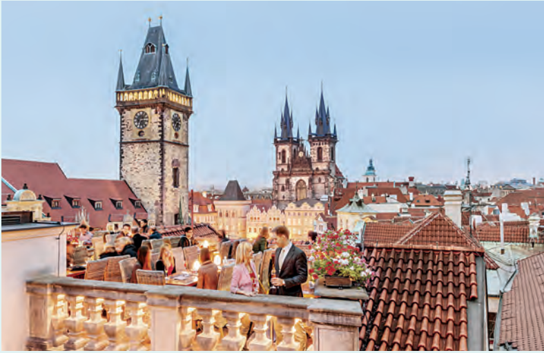
Het restaurant op het dak van het U Prince Hotel is een van de schilderachtigste plekken van Praag.

prachtige historische stad Plzeň , beroemde oude brouwerijen en een monument voor het Derde Leger van Patton, dat dit gebied in de Tweede Wereldoorlog bevrijdde.