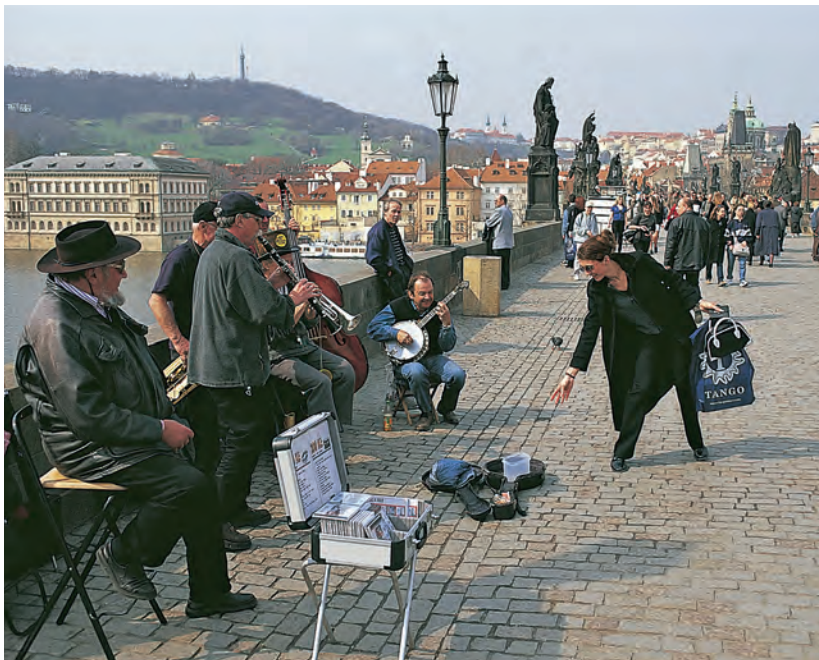
Wandelend over de Karelsbrug luisteren de passanten naar straatmuzikanten.

waar je gezien moest worden. Er verzezen chique hotels, casino's, restaurants en koffie- en theehuizen. De twee grootste Tsjechische kuurbadplaatsen zijn Karlovy Vary en Mariánské Lázně, ook bekend onder hun Duitse namen Karlsbad en Marienbad. In de communistische tijd raakten deze oorden in verval, maar ze zijn weer opgeknapt en genieten een grote populariteit onder de toeristen. Sommigen komen er om een kuur te volgen; de meesten komen er om te wandelen, van het landschap te genieten, lekker te eten en de koffiehuizen te bezoeken.