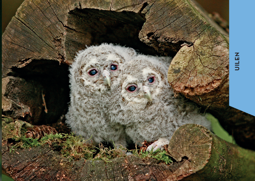
↑ Jonge vogels in donskleed

nestkasten. Soms beginnen ze al in februari met het leggen van hun eieren, meestal 3-5. Na vier weken broeden komen de jonge vogels uit en die zitten vier weken later vrij in bomen of op de grond als ‘takkelingen’. Daar worden ze nog twee maanden door hun ouders gevoerd. Tijdens de noodzakelijke voervluchten reizen de volwassen vogels tot 3 km afstand van het nest.