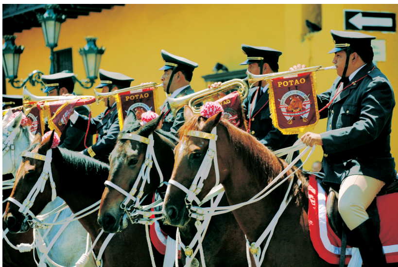
Wisseling van de wacht bij het presidentieel paleis op het Plaza de Armas.

'kalmeren'). Arbeiders schrobben de straten, verfden de gebouwen en begonnen aan een ambitieus project voor de renovatie van de mooie, maar vervallen koloniale balkons. De stad is tegenwoordig mooier en veiliger, hoewel het er ook nog altijd overvol en druk is.