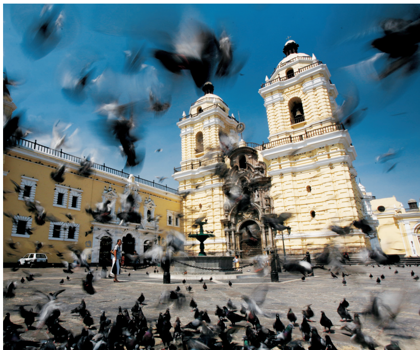
Het klooster van San Francisco in het centrum van Lima.

De oude opgravingen die over Lima verspreid liggen, zijn bijna tweeduizend jaar oud. Misschien waren er ooit nog oudere, maar die zijn ten prooi gevallen aan nieuwbouw. Ondanks de banden met het verleden heeft de stad zijn blik op de toekomst gericht met zowel een keur aan historische schatten als het beste op het gebied van moderne recreatie.