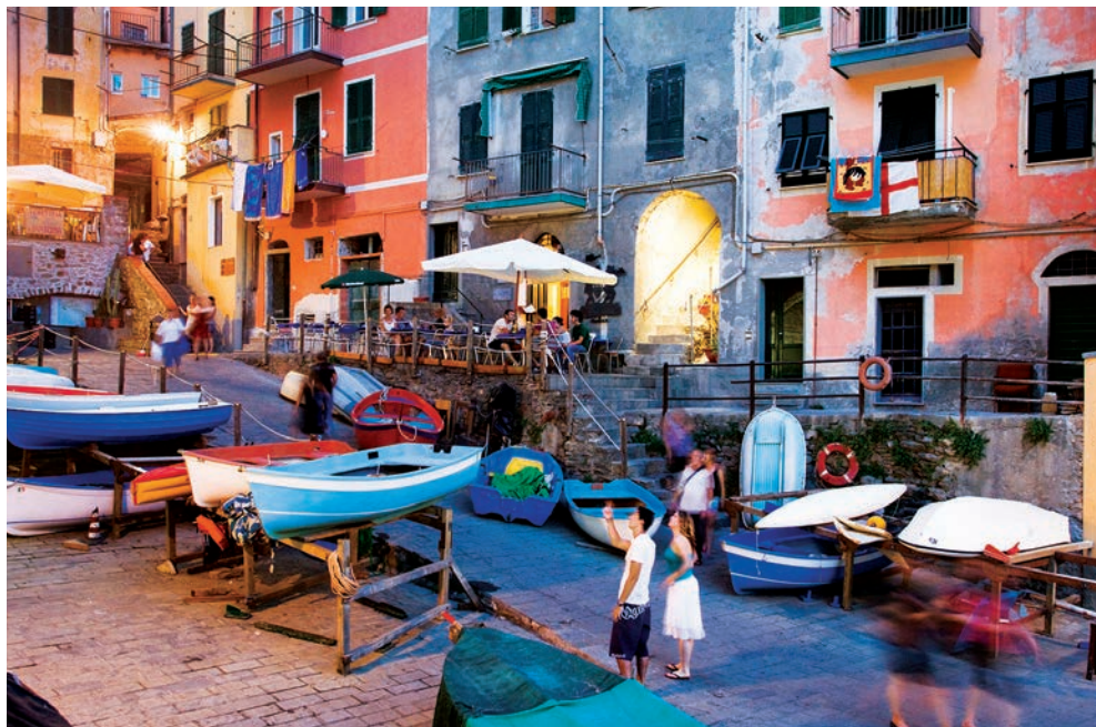
De 5 pittoreske dorpjes die Cinque Terre vormen, hebben elk een eigen aantrekkingskracht, van de pastelkleuren van Riomaggiore (boven) tot het strand van Monterosso al Mare (hiernaast).

5 middeleeuwse dorpjes aan de Middellandse Zee