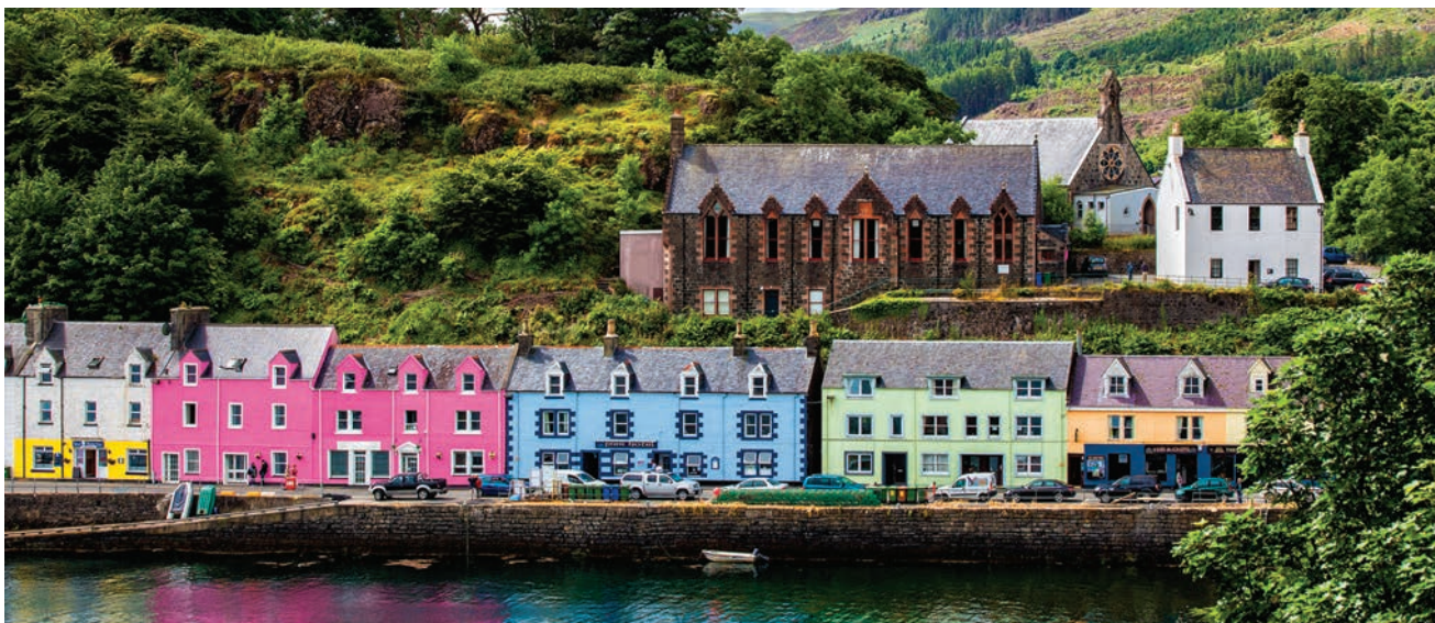
De kleurrijke huizen aan Portree Harbour (boven) verbleken als je ze vergelijkt met het genuanceerde palet van de Quiraing (hiernaast), een nog altijd bewegend stuk land op het eiland Skye.