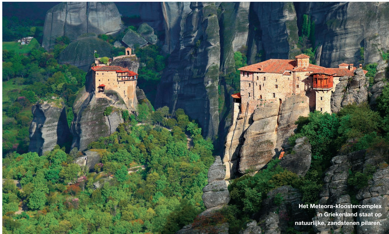
Het Meteora-kloostercomplex in Griekenland staat op natuurlijke, zandstenen pilaren.