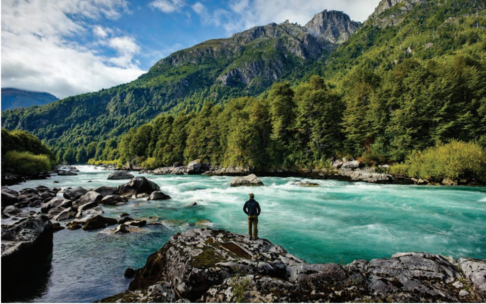
Kenmerkend voor Chili's Merendistrict zijn onder meer de Terminator-stroomversnelling in de Río Futaleufú (boven) en de Osorno-vulkaan (hiernaast), die enorm lijkt op de Fuji-vulkaan.

Wie over de kronkelweggetjes en bergpassen van Chili's Merendistrict rijdt – een soms moeilijke reis – wordt onvermijdelijk beloofd door adembenemende uitzichten op helderblauwe meren en met sneeuw bedekte vulkanen. Dit majestueuze oord is een van 's werelds ruigste, geografisch meest afwisselende gebieden en nog altijd het minst verkend. Het enorm uitgestrekte gebied telt veel nationale parken en daarnaast nog veel meer beschermd land dat zich uitstrekt over bergen, rivieren en meren in de hele regio. Onverschrokken avonturiers kunnen op talloze manieren de ongetemde wildernis verkennen: van varen over de wateren en fjorden tot hiken door besneeuwde bergen, ziplinen door de boomtoppen aan de voet van vulkanen of zwemmen in thermale bronnen nabij de langstromende rivieren.