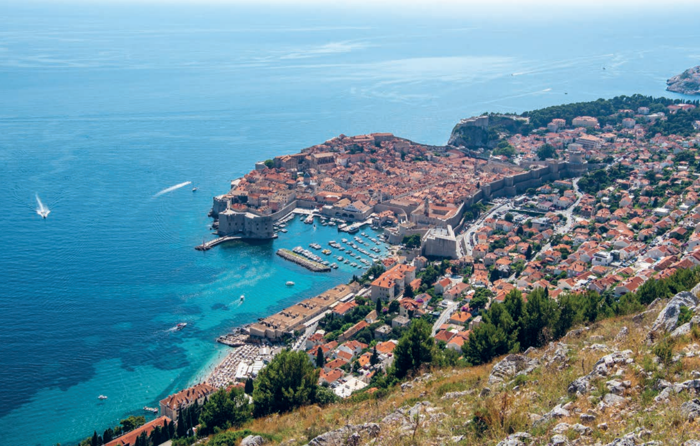
Uitzicht op Dubrovnik vanaf Srd