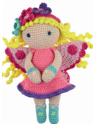
BLOEMENELF EVI 40