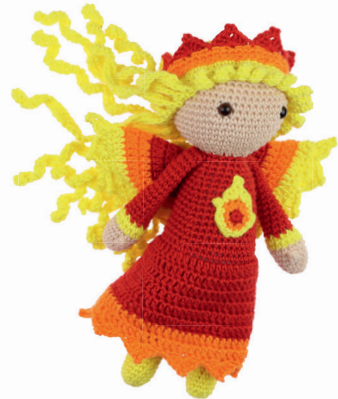
VUURFEE VEERLE 96