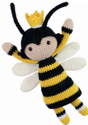
BIJ BETTY 104