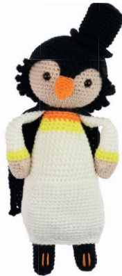
PINGUIN POL 90