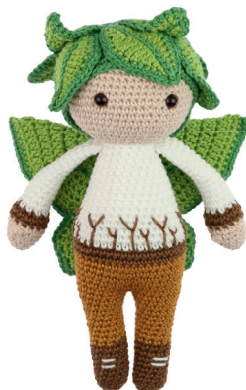
BOSELF BOAZ 46