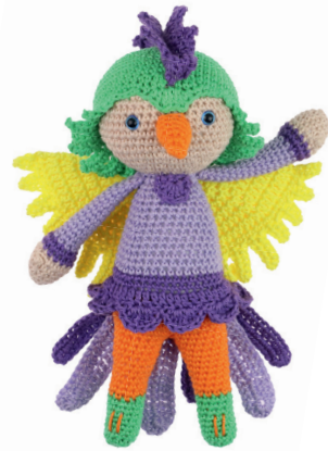
PARADIJSVOGEL PABLO 78