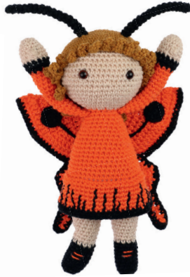
VLINDER VALENTINA 68