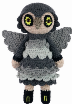
UIL URSULA 28