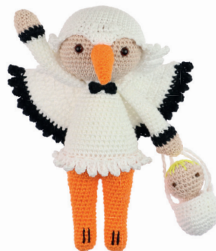
OOIEVAAR OLIVER 34