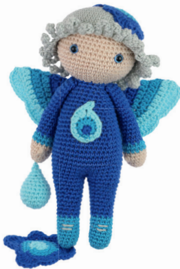
WATERELF WES 100