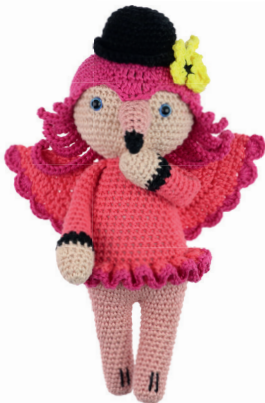
FLAMINGO FANTASIA 84