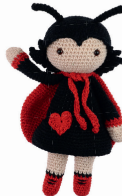
LIEVEHEERSBEESTJE LOLA 52