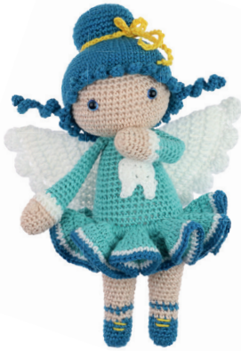
TANDENFEE TINA 58