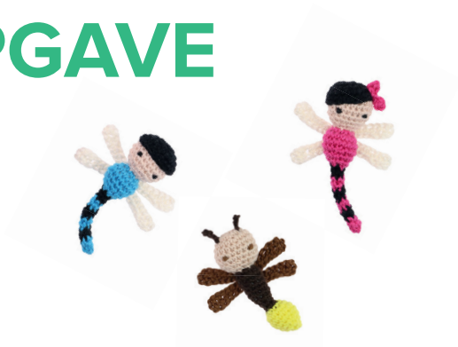
LIBELLEN JOS EN LOIS 74 VUURVLIEG VIKTOR 64