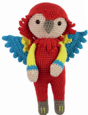
PAPEGAAI PATRICK 22