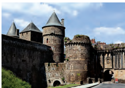
Deze 13e-eeuwse muren beschermden het Bretonse Fougère.

Normandië en Bretagne vormen samen de noordwestelijke hoek van Frankrijk. Achter de kust, die vanouds Franse en buitenlandse toeristen trekt, ligt een landelijk gebied. Normandië is bovenal beroemd om zijn zuivelproducten en appels terwijl Bretagne bekendstaat om zijn groenten; in beide gebieden wordt tegenwoordig echter ook vlees en graan geproduceerd.