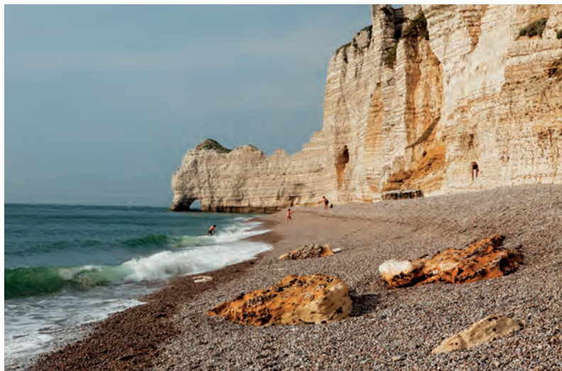
De steile krijtrotsen van Normandië worden gestaag uitgeslepen door de zee.

Normandië heeft een mooi en afwisselend landschap. De ruige en indrukwekkende kustlijn van het schiereiland Cotentin in het westen wordt afgewisseld met de zandvlakten van het gebied Calvados, de elegantie van Deauville en Trouville-sur-Mer en de rotsen van de Côte d'Albâtre. In het landelijke binnenland vindt u veeteeltbedrijven, calvadosdistilleerderijen en kleine restaurants. Alom liggen mooie dorpen, boerderijen en landgoederen: een schitterend architecturaal erfgoed dat de Tweede Wereldoorlog heeft doorstaan.