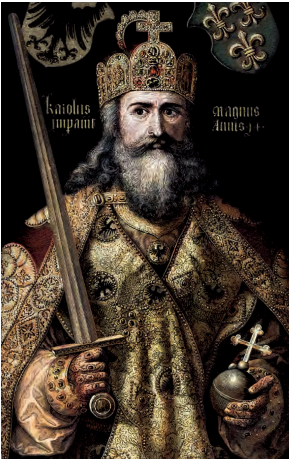
Karel de Grote, in 1512 geschilderd door Albrecht Dürer.

De Merovinger vorst, Clovis, koos Parijs als hoofdstad en nam in het jaar 496 het christelijke geloof aan, waardoor hij meer macht kreeg in het christelijke zuiden.