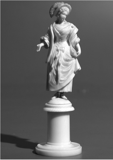
Koningin, Italiaans schaakspel, 17de eeuw.

‘wijze man’ en ook ‘raadgever’ betekent. Soms gebruikte men het woord ‘ vesir ’ dat eigenlijk staat voor ‘minister’. Als rechterhand van de koning werd het nieuwe stuk ook wel gezien als veldheer, degene die de bevelen van de koning moest uitvoeren; daarom kreeg hij een beperkte actieradius op het schaakbord.