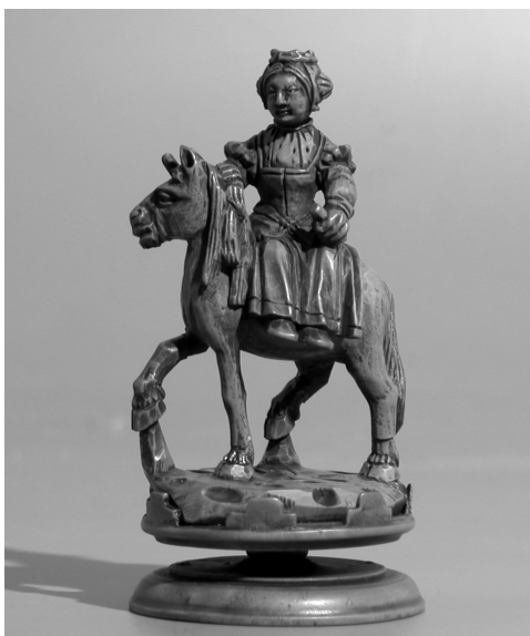
Koningin te paard van palmhout, circa 1550. Herkomst Zuid-Duitsland. In het Rijksmuseum in Amsterdam bevindt zich een compleet spel.

Toen het spel in Perzië bekend werd ging de mantri daar farzin heten, dat