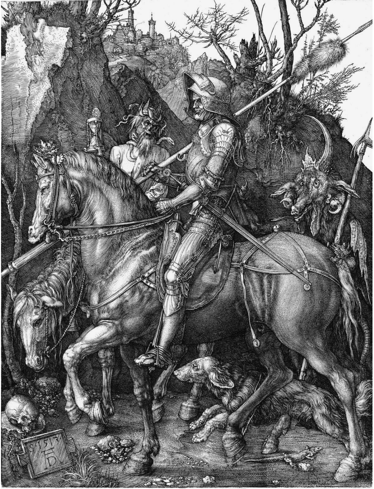
Ridder, dood en duivel Albrecht Dürer, gravure (1513)