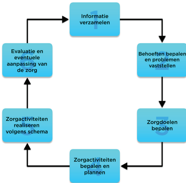
Afbeelding 1.3 Stappen in het zorgproces

Methodisch handelen in de zorg verloopt dus volgens een aantal stappen. De verschillende stappen van het zorgproces vormen de basis, waarmee je volgens een vaste werkwijze kunt handelen. Deze stappen zullen in latere hoofdstukken verder worden uitgewerkt.