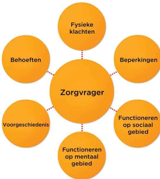
Afbeelding 1.4 In een gesprek kun je de wensen van de zorgvrager helder krijgen

Om de behoefte duidelijk te krijgen, vraag je wat de zorgvrager wil. Je kunt een goed beeld van de behoeften krijgen door de ervaring van de zorgvrager en je eigen ervaring als zorgprofessional te analyseren. Hiervoor is een gesprek nodig, om de belangrijke punten en prioriteiten te vinden. Daarnaast moet je ook de aanwezige problemen en problemen die zouden kunnen ontstaan in kaart brengen.