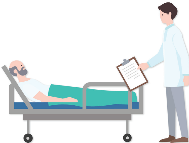
Afbeelding 1.1 Doelen overleggen met de zorgvrager

Methodisch werken heeft verschillende voordelen. Om te beginnen is methodisch werken doelgericht werken. Je stelt doelen op in overleg met de zorgvrager, en denkt met hem of haar na over de beste manier om deze doelen te bereiken. Zo kan de zorg worden afgestemd op de wensen, behoeften en mogelijkheden van de zorgvrager. Daarnaast draagt het bewust nadenken over de te leveren zorg bij aan de kwaliteit van de zorg. Je maakt keuzes op basis van wetenschappelijke kennis en je eigen klinische inzichten. Je doet dus nooit zomaar iets.