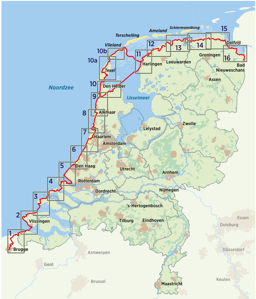
Route-overzicht en kaartindeling