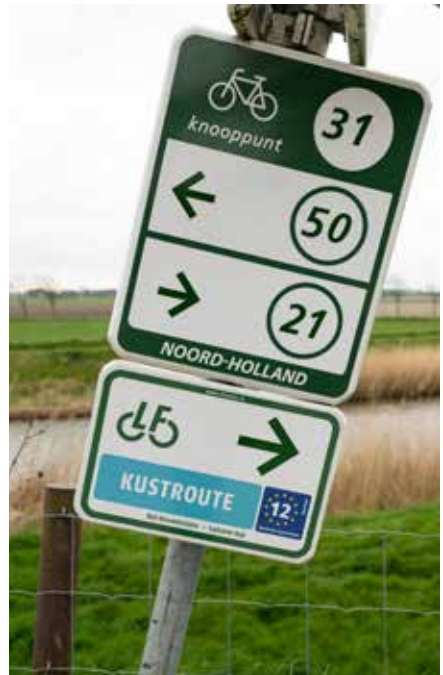
Knooppunten- en LF-bewegwijzering