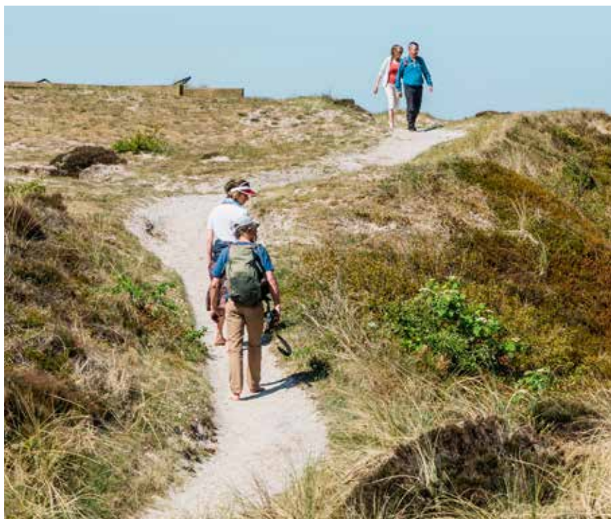
Pad naar uitkijkpunt in duinen ten noorden van Bergen

Ten noorden van Bergen gaat het Noordhollands Duinreservaat over in de Schoorlse Duinen (c) . Het zijn de hoogste van Nederland: bij Schoorl