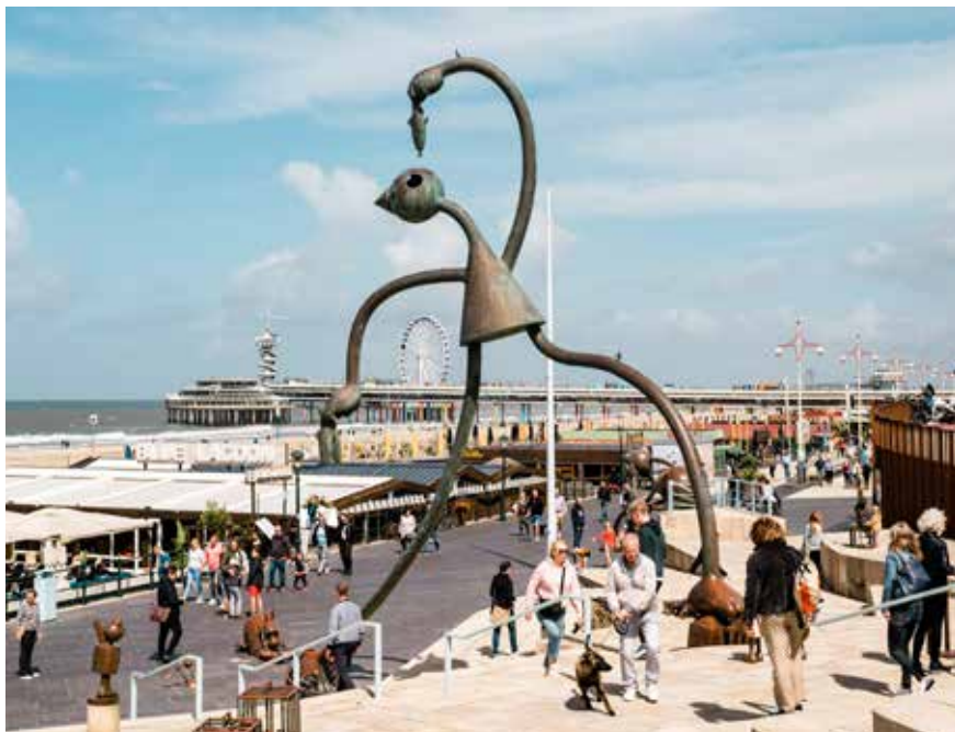
Scheveningen, beeldhouwwerk De Haringeter aan boulevard-1