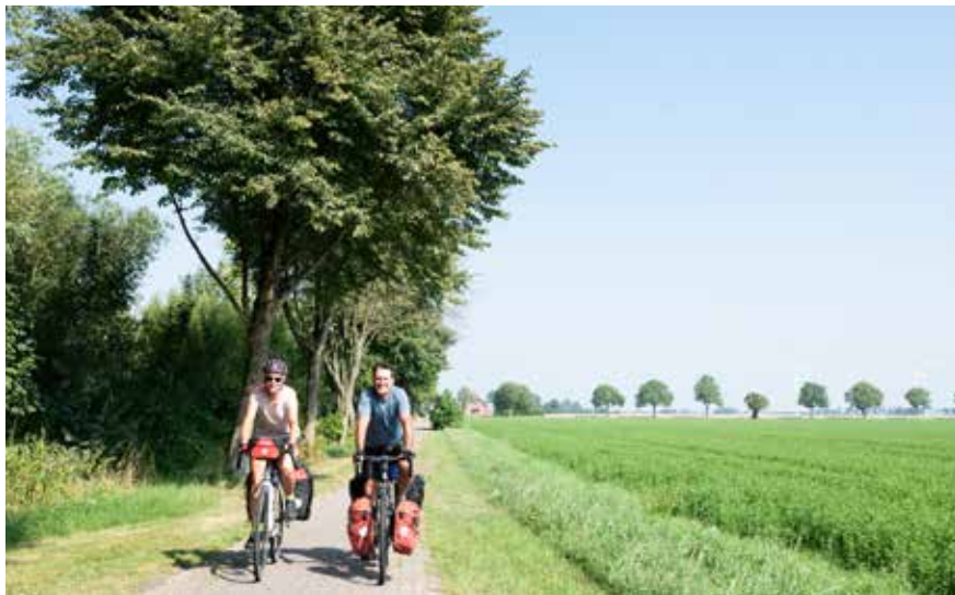
Fietsers net over de grens bij Bad Nieuweschans