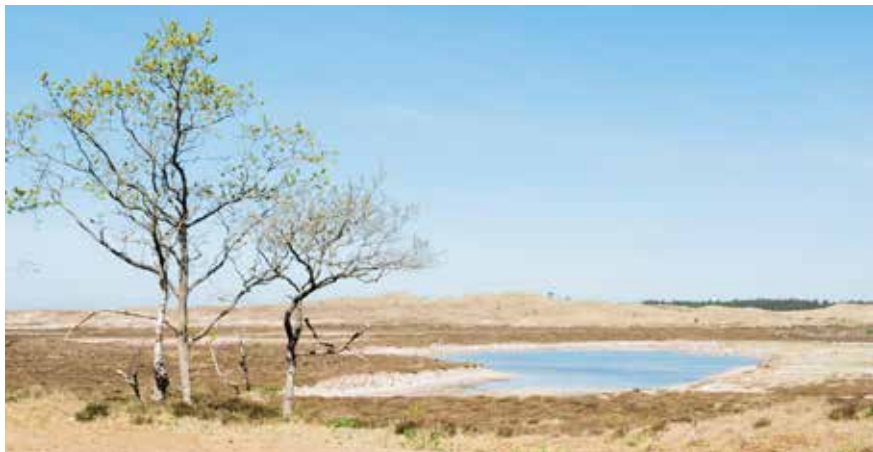
Ven in het Noordhollands duinreservaat

vind je toppen van bijna 55 meter. Bovendien is hier de breedste duinstrook van Nederland: bijna vijf kilometer. Vroeger werden de bewoners van omliggende dorpen geteisterd door zandstormen. Om het stuifzand