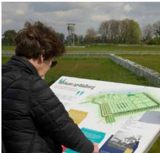
Infopaneel van Kasteel Walburg bij uitkijktoren