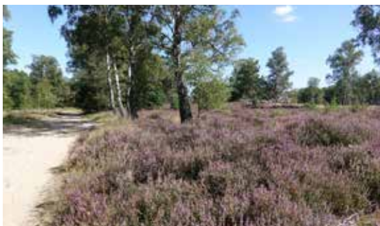
Heide in bloei

Duitsland vormt. De beek meandert langs de Rolvennen naar het westen, richting Roer. De huidige vorm van deze vennen moet zijn ontstaan na de Eerste Wereldoorlog. Loop even via een smal paadje aan je rechterhand naar het vlondertje aan het water. Bewonder de witte waterlelies en misschien zie je aan de oever wel de kleine zonnedauw, een vleesetende plant. In de winter biedt het gebied tussen de Grote Herkenbosserbaan en de Boschbeek, door de vennen en de begroeiing van o.a. pijpenstrootje, een goede overwinteringsplek aan een wintergast: het 'bokje', neefje van de watersnip.