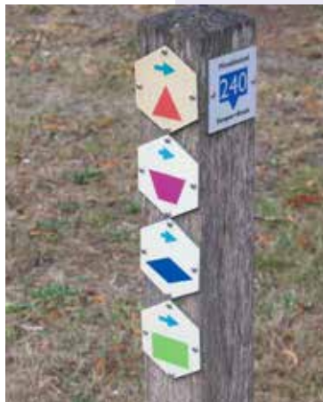
Routepaaltje Wandellussen en wandelwissel grenspark Kempen-Broek

Op diverse plaatsen staan informatiepanelen met overzichtskaarten die een goed beeld geven van de wandelmogelijkheden, en natuurlijk ook van de door jou uitgekozen wandeling. Bij een aantal routes in dit gidsje vind je een dergelijk infobord aan het begin van de route.