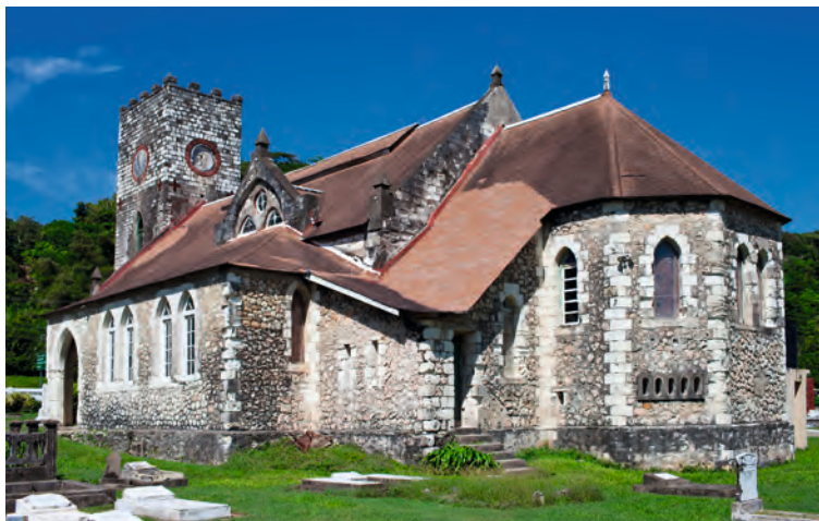
St. Mary Parish Church

Binnen de religie zijn nog wel eens invloeden merkbaar uit de geschiedenis van de bevolking, zoals voorouderverering. Er is echter