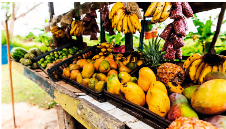
Fruitstalletje langs de weg

Groente- en fruitstalletjes vormen de kleurrijkste taferele van Jamaica. Je vindt ze overal langs de weg en in de steden op de markten. Als je spreekt over couleur locale dan mag je een bezoek aan een van de vele markten beslist niet overslaan. Er zijn speciale craftsmarkets waar je leuke souvenirs kunt bemachtigen. Afdingen! Ook op het strand en in de straten worden zaken aangeboden en daar geldt dezelfde aankoopmethode.