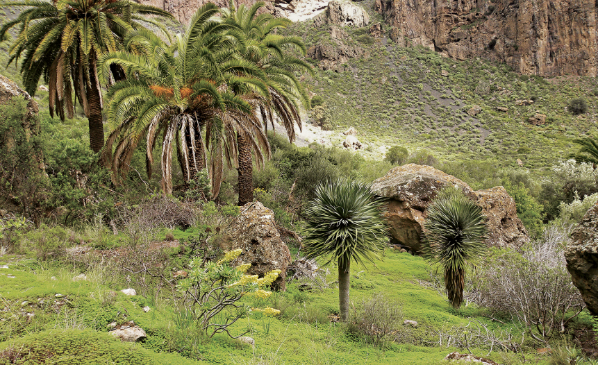
Zo weelderig groen is de krater van Bandama in de winter.