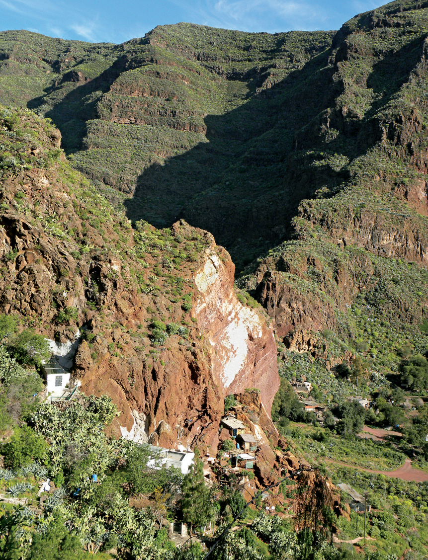
Blik in de diepte op het grottdorp Cuevas Bermejas in de Barranco de Guayadeque (wandeling 71).