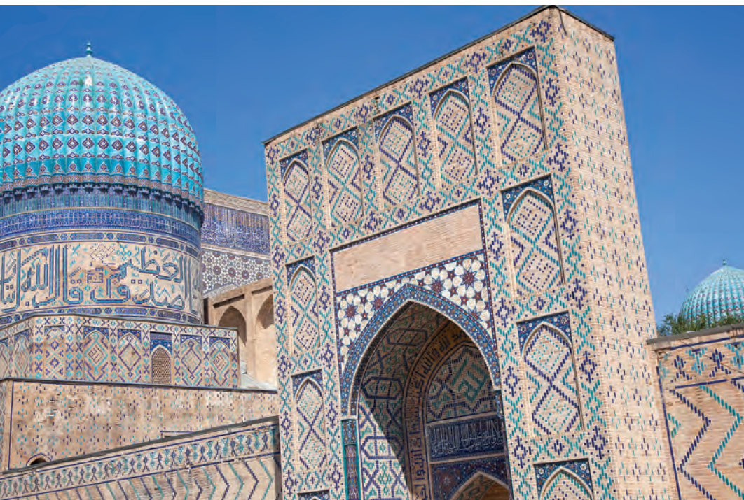
▼ Samarkand aan de oude Zijderoute in Oezbekistan.