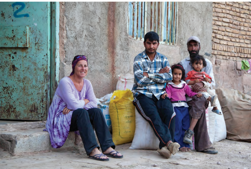
▲ Logeren op een boerderij in Iran.