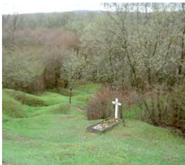
Het graf van een Franse luitenant

bord wordt de geschiedenis van deze bunker verteld. Aan de rand van het bos vind je nog een apart graf voor een Franse luitenant, die hier is gesneuveld. De volgende stop is de Tranchée des Baionettes aan de D913. Als je die richting uitrijdt kom je langs een café/restaurant. In de wijde omtrek is dit de enige gelegenheid (op een koffieautomaat in de hal van het museum Mémorial de Verdun na) om iets te eten of te drinken.