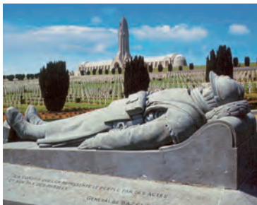
Monument Soldat du Droit

Recht tegenover het ereveld is nog een vlakke, omgeploegd door granaatinslagen. Hierop zie je ook een paar schoorsteenachtige bouwsels. Dit zijn luchtinlaten van een ondergrondse bunker, die o.a. heeft gediend als commandopost en uitkijkpost. Op een