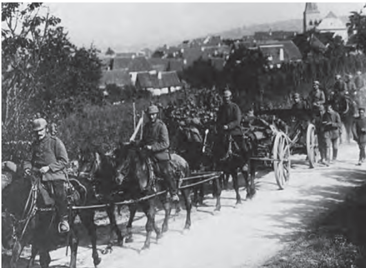
Duitse troepen rukken op in Frankrijk

woedde de Slag der Grenzen. De Fransen leden zware verliezen en moesten zich terugtrekken tussen de Maas en de Marne en verschansten zich op de versterkingen van Verdun.