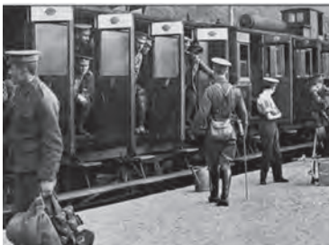
Britten vertrekken naar het front

Achtereenvolgens vielen Charleroi, Dinant en Namen in Duitse handen. Alleen al bij Namen sneuvelden 27.000 Franse soldaten bij de beschietingen met de zware howitzers. Tijdens de slag bij Mons (Bergen) is er een eerste contact tussen het 1 e Duitse leger van generaal Von Kluck en de Britse troepen. Het British Expeditionary Force (BEF) leed veel verliezen en werd 5 kilometer teruggedwongen. Ook aan Duitse zijde waren er grote verliezen. Omdat het Franse 5 e leger, dat in de sector oostelijk van de Britten streed, zich wat naar het oosten had teruggetrokken, moesten de Britten wijken en trokken zich 'ongeorganiseerd' verder terug.