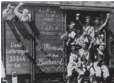
Duitse troepen in jubelstemming onderweg naar het front

Op 4 augustus 1914 vielen de Duitsers massaal België en Luxemburg binnen. Het eerste grote obstakel was Luik. Om het Schlieffenplan te laten slagen was een snelle verovering van Luik van cruciaal belang. Duitse troepen van het 2 e leger onder generaal Von Bülow namen op 5 augustus Luik onder vuur, maar konden de buitenste ring van twaalf machtige forten, die de stad beschermden, niet innemen. Op 7 augustus, na enkele dagen van hevige gevechten slaagden de Duitsers erin de Citadel van Luik te veroveren. Op 10 augustus viel het eerste van de twaalf forten van de verdedigingsgordel rond Luik. Hiervoor hadden de Duitsers wel hun 420 mm houwitser, de Dikke