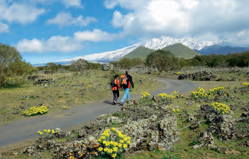
Aan het begin van de wandeling naar de westflank van de Etna bij Bronte (wandeling 2).