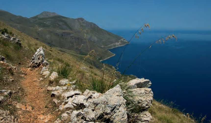
Uitzicht van de Pizzo del Corvo richting noordelijke parkingang.

bomen tot aan een splitsing voor een gebouw; hier wijzen houten bordjes 'Sentieri alti' op de verdere route naar links. Vlak daarna negeren we een afslag naar links omhoog en blijven op het smalle pad rechtdoor (nog steeds 'Pizzo del Corvo, Sughero, Borgo Cusenza'). Ook op de volgende afslag naar links wandelen we op gelijke hoogte rechtdoor ('Sughero, Borgo Cusenza') verder. Uiteindelijk stijgt het pad weer, de helling wordt steiler, en we steken een rotsige kam over, die eindigt bij de rechts onder ons liggende rotsen van de Pizzo del Corvo (3) . Aansluitend voert het pad met enkele haarspeldbochten omlaag. We steken een geul over, die over de helling omlaag voert, en wandelen spoedig door manshoog gras en palmen.