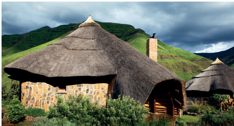
Accommodatie in Ts'ehlanyane National Park

Lesotho-gerelateerde websites promoten het huren van vakantiehuusjes en vakantie-rondavels. Neem telefonisch contact op voordat u overgaat tot boeken.