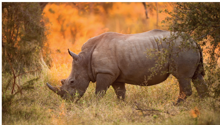
Neushoorn in het Kruger National Park