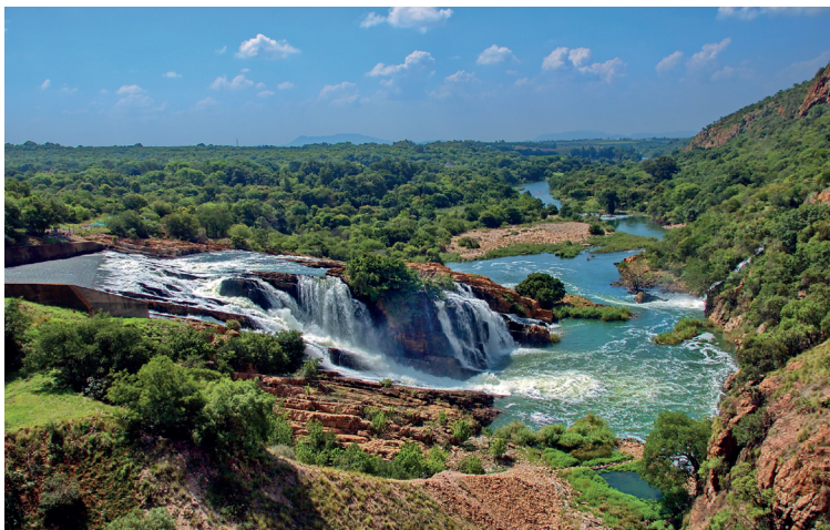
Waterval bij Hartbeespoortdam

Het land ligt op een hellend plateau dat richting het oosten hoger wordt. Met name het oosten kent geologisch verval dat honderden meters bedraagt: het plateau gaat abrupt over in laaggelegen gebied (Lowveld) dat verdwijnt in de oceaan. De zuidelijke en zuidoostelijke kusten zijn bergachtig; landinwaarts wordt de Drakensberg (Engelse