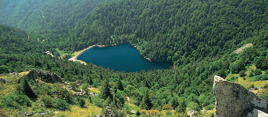
Het Lac de Schiessrothried en de gelijknamige ferme auberge links boven op de helling, gezien vanaf de Petit Hohneck.

du Fischbædle (2) , een door bossen en rotsen omkaderd bergmeertje, dat in de 18e eeuw tot de visvijver werd opgestuwd. Van het meer leidt de markering blauw kruis op bospaadjes omhoog naar de splitsing Kerbholz (3) , waar een doorsteek naar de Kastelbergwasen bestaat, en daalt na een kort eindje langs de rand van de uitzichtrijke bergweiden in het bos af naar het met sagen omgeven Lac d'Altenweiher (4) , op de bodem waarvan onmetelijke schatten zouden liggen, waaronder een gouden wagen die aan diegene toebehoort die hem zwijgend enkele passen ver kan voorttrekken. Kort voor de stuwdam leidt de markering geel kruis rechtsaf omhoog door het Kastelbergwald naar de uitzichtrijk gelegen Ferme Auberge Kastelbergwasen (5) en eveneens uitzichtrijk naar de Hohneck (6) ; panorama-oriëntatietafel, horeca). Van de Hohneck leidt de rode-rechthoekmarkering van het Vogezen-kampad met mooie vergezichten naar de Col du Schaeferthal (7) en daalt af richting Ferme-Auberge du Schiessroth (8) ; kort tevoren takt ze op een kronkelpaadje in het bos af omlaag naar het Lac de Schiessrothried (9) . Van dit bergmeertje, dat door een 150 m lange dam wordt gestuwd, gaat het omlaag naar het bekende Lac du Fischbædle (2) en op de linkerhelling van het Wormsa-dal terug naar Steinabruck (1) .