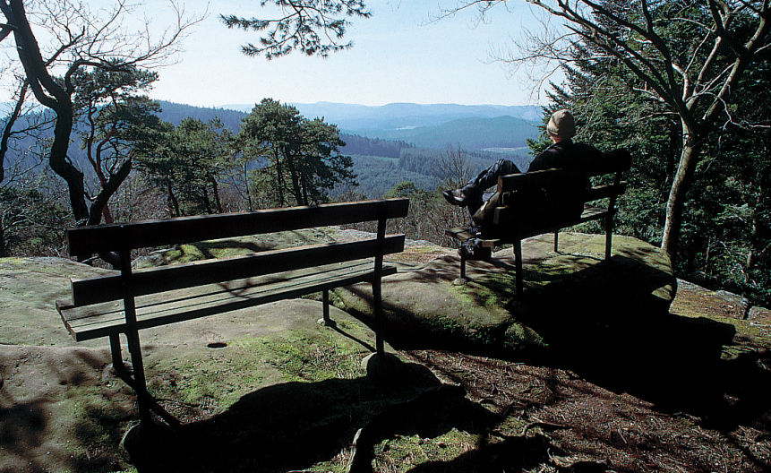
Rustpauze op de Englishberg.

linksaf naar de Ochsenstall (2) ; de grotachtige verweringen in dit rode-zandsteenmassief zouden vroeger als veestallen hebben dienstgedaan. Van de Ochsenstall leidt de rode-rechthoekmarkering met bestemming 'Wimmenau' verder door de bossen op de helling van de Seelen- of Seelberg, totdat de markering rood-wit-rood rechtsaf takt en steil omhoog richting Englishberg leidt; zodra de markering blauw kruis opduikt, linksaf over de helling, daarna rechtsaf de rug naar de top op, waarop zich diverse uitkijkplaatsen bevinden; op een torenachtige rots van de Englishberg (3) staat een zitbank met uitzicht richting de Hunebourg.