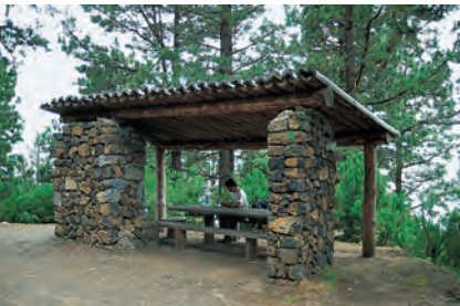
Schuilhutje (Choza) in het dal van Orotava

en natuurlijk de bananen, een van de belangrijkste economische goederen van het eiland. Dit door de staat en de EU gesubsidieerde landbouwgewas groeit in de kuststreken tot op circa 300 m hoogte en heeft zeer veel water nodig. Circa 20% van het eiland is met bos bedekt: Het dichte, oerwoudachtige laurierbos (nevelwoud) is op enkele restbestanden in het Anaga- en in het Teno-gebergte na vrijwel verdwenen – het groeit voornamelijk op de vochtige noord- en oosthellingen en kloven. Boven het laurierbos volgt de Fayal-Brezal-zone