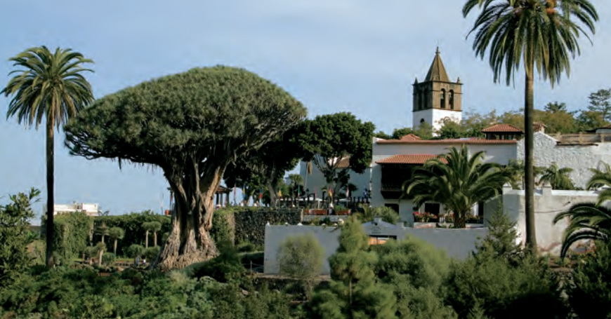
De Drago Milenario in Icod de los Vinos – de oudste drakenboom van het eiland.

kant van het Orotava-dal grenst in het hooggelegen gebied aan uitgestrekte dennenbossen, die aan de voet van de Teide en de Pico Viejo vrijwel zonder overgang afgewisseld worden door zwarte zand- en lavalandschappen – een vrijwel onbegrensd, nog nauwelijks ontdekt wandelgebied!