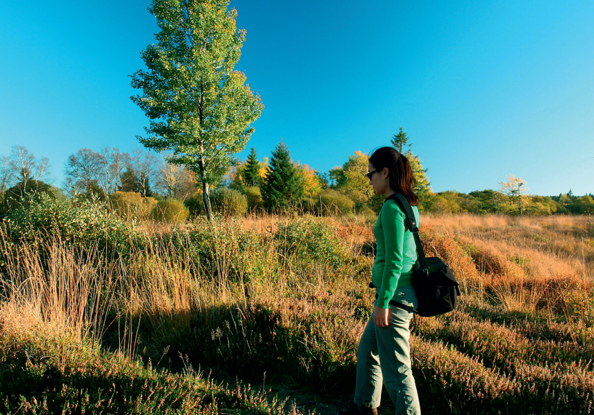
Kleurenpracht in het Brackvenn.

De markering die er had moeten zijn (groen-witte rechthoek) ontbreekt helaas, maar alleen dit ene pad leidt door het veen. Bij een ander informatiebord stuit u op de rood-witte markering van de GR 15, volgt die over de Getzbach en neemt bij de kruising met bank, waar u ruim een uur geleden al eens langs bent gekomen, opnieuw het steenslagpad naar het zuiden. Voorbij informatiebord en vlonder vervolgt u uw wandeling ditmaal tot aan de kruising bij de goed in het bos verstopte boswachtershut bij het Brackvenn . Sla bij deze kruising linksaf en na de eendenpoel aan uw rechterhand direct weer rechtsaf het Brackvenn in (wegwijzer "Parking Grenzweg"). Nu wandelt u de laatste 2,5 km over een veenpaadje en over plankenpaadjes zigzag door het indrukwekkende veenlandschap. Wie laat in de middag onderweg is, kan het veen in de avondzon zien oplichten. De N 67 naar links volgend keert u ten slotte terug naar de Parking Grenzweg .