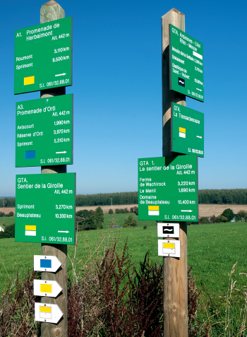
De wandelpaden in België zijn steeds voorbeeldig aangegeven.

route en het terrein toelaat. Hoogteprofielen informeren over de te verwachten duur van de wandeling, lengte en profiel van het parcours en de belangrijkste oriëntatiepunten. Kaartjes op schaal 1:50.000, resp. 1:100.000 (wandeling 36) verduidelijken het verloop van de route. Waar in de tekst sprake is van “oriëntatiepunten”, gaat het om plekken die op de kaartjes en/of de hoogteprofielen staan aangegeven. Als aanvulling wordt in de samenvatting steeds verwezen naar een gedetailleerde wandelkaart van de streek waarin de wandeling gemaakt wordt.