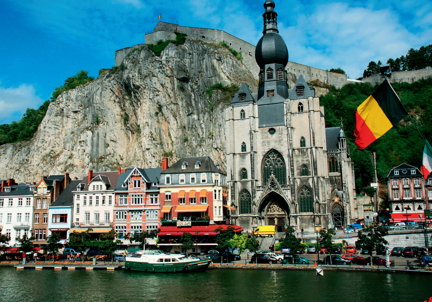
Indrukwekkende achtergrond: vesting en kathedraal van Dinant aan de Maas.

Voorstellen voor nog meer meerdaagse wandelingen vindt u in het kader “Meerdaagse wandelingen in de Ardennen en in de Hoge Venen” (p. 15).