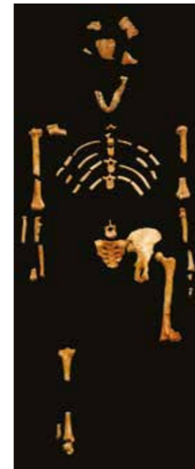
Het versteende deelskelet 'Lucy'