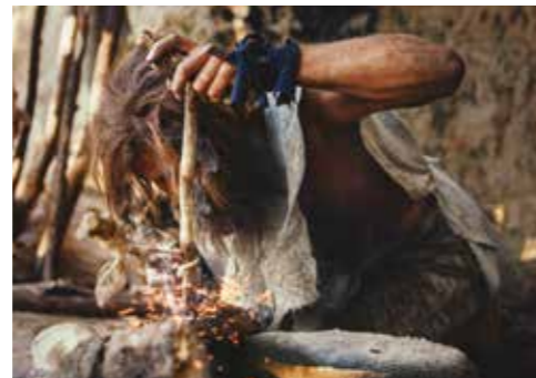
Een neanderthaler die vuur maakt

De mens behoort tot een groep zoogdieren die Homo sapiens heet. Dit betekent 'wijze mens'. De neanderthaler, die circa 300.000 jaar geleden verscheen, was de eerste Homo sapiens -soort. Hij had grotere hersenen dan zijn voorouders en een sterk gespierd lichaam. Het is nog niet bekend waarom de neanderthalers uitstierven.