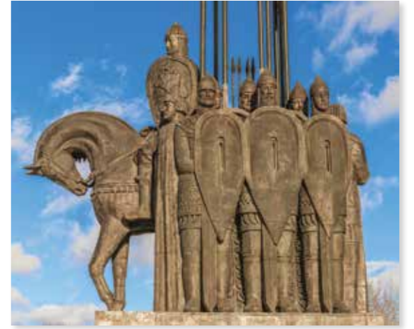
Monument voor Alexander Nevski en zijn soldaten in de Russische stad Pskov

Hij was grootvorst van Novgorod, in zijn tijd de belangrijkste stad van het toenmalige Rusland, en beschermde de belangen van het land. Nevski was ook een geslepen diplomaat en militair die samenwerkte met de Mongolen om Zweedse en Duitse ridders te verslaan – in 1240 tijdens de Slag aan de Neva en in 1242 tijdens de Slag op het IJs.