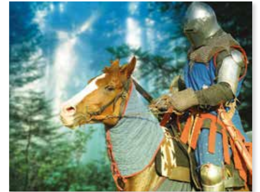
Een ridder in een harnas

In de middeleeuwen was het gebruikelijk dat mannen uit adellijke families werden opgeleid tot ridder, om te vechten en soldaten voor te gaan in de strijd. In het jaar 1000 droegen ridders eenvoudige maliënkolders. Rond 1450 droegen ze een volledig harnas van gebogen metalen platen. Het harnas van de hogere adel was vaak versierd met gegraveerde patronen of gepolijst goud.