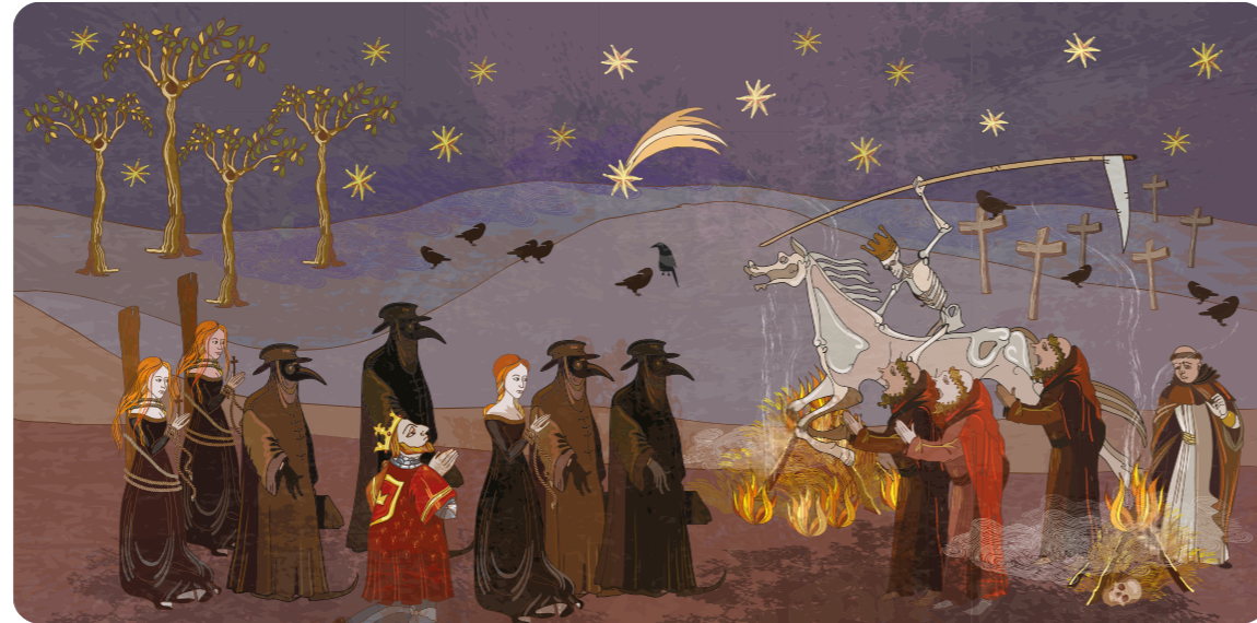
Schilderij met de koning, dokters (met maskers) en monniken, allemaal hulpeloos tegen de Zwarte Dood