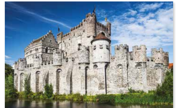
Kasteel Gravensteen in Gent (België)

Vorsten en edelen. Veel kastelen stonden op een heuvel of waren omgeven door een gracht, als bescherming tegen vijandelijke aanvallen.