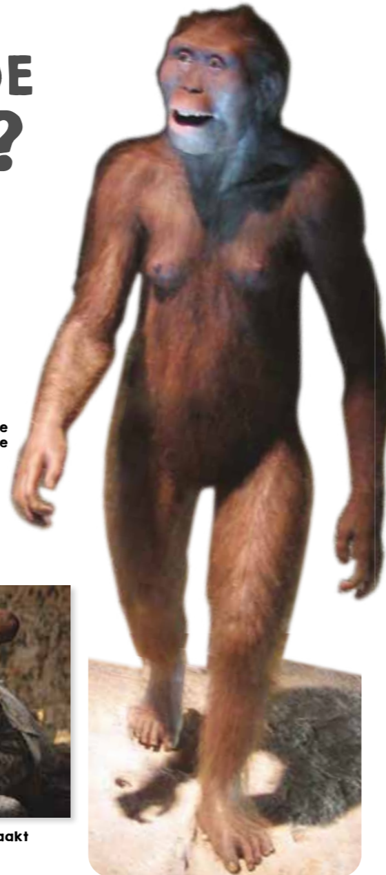
De aapachtige hominide