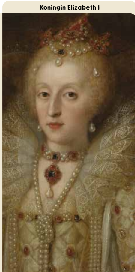
Koningin Elizabeth I

Elizabeth I was koningin van Engeland van 1558 tot 1603, een tijd waarin de meesten dachten dat vrouwen zwak waren en niet konden regeren. Elizabeth trouwde nooit en werd de Maagdelijke Koningin genoemd. Ze was een groot leider en onder haar gezag bloeiden politiek, handel en kunst. Haar bewind wordt algemeen gezien als het hoogtepunt van de Engelse renaissance. Hoewel haar positie constant bedreigd werd door haar eigen edelen, verenigde ze het land tegen buitenlandse machten, zoals Spanje.