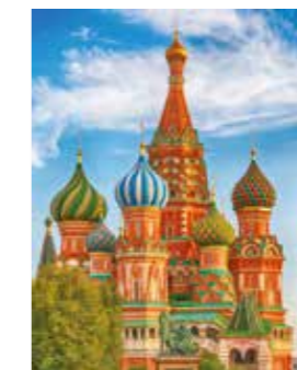
Basilius-kathedraal in Moskou

De Byzantijnse cultuur en het Oosters-orthodoxe christendom.