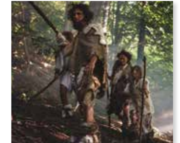
Gekleed in dierenhuiden

Ze droegen waarschijnlijk ruwe capes van bont.