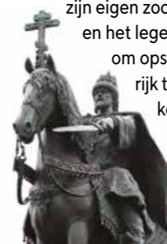
Standbeeld van Ivan de Verschrikkelijke

zijn eigen zoon. De edelen en het leger deden alles om opstanden in Ivans rijk te onderdrukken en werden beloond voor hun loyaliteit.