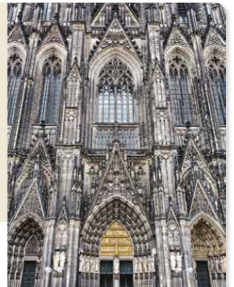
Gotische gevel van de Dom in Keulen (Duitsland)

In de middeleeuwen werden grote kathedraal gebouwd. Vaak in de nieuwe, gotische bouwstijl, waarin gebouwen hoge ramen, gewelfde plafonds en spitsbogen hebben. Muurschilderingen en mooi beeldhouwwerk sieren het interieur. Een mooi voorbeeld is de St.-Janskathedraal in Den Bosch.