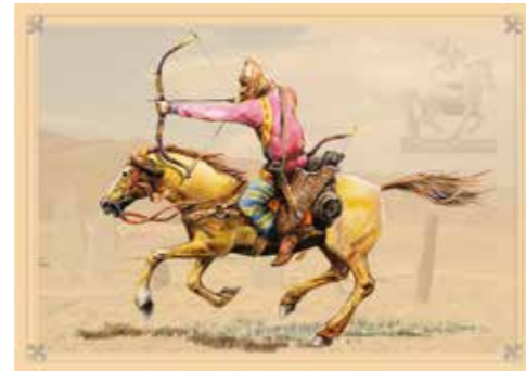
Scythische boogschutter te paard

Dit waren nomaden die rond de 8ste en 7de eeuw v.C. vanuit Centraal-Azië naar het westen trokken. De Scythen bouwden op wat nu de Krim is een rijk en machtig imperium dat vele eeuwen bleef bestaan.