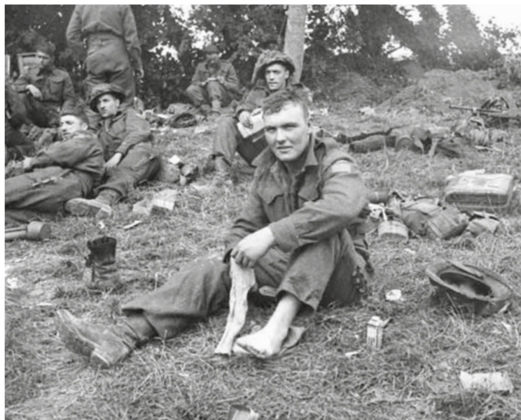
Linksboven: Dit zijn de infanteristen van de 9e Canadese Infanteriebrigade, uitrustend in Normandië, 8-9 juni 1944.