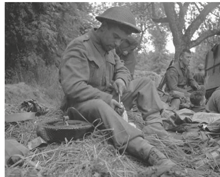
Links: Een infanterist zal altijd zijn geweer – en bajonet – schoonhouden. Deze soldaat is van het North Shore (New Brunswick) Regiment, 8-9 juni.