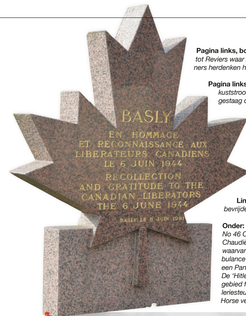
Pagina links, boven: De 'Reginas' begeven zich landinwaarts vanaf de stranden en vorderen tot Reviere waar ze zich groepeerden voordat ze verder zuidwaarts gingen. De dorpsbewoners herdenken hun bevrijding met dit monument (rechts).