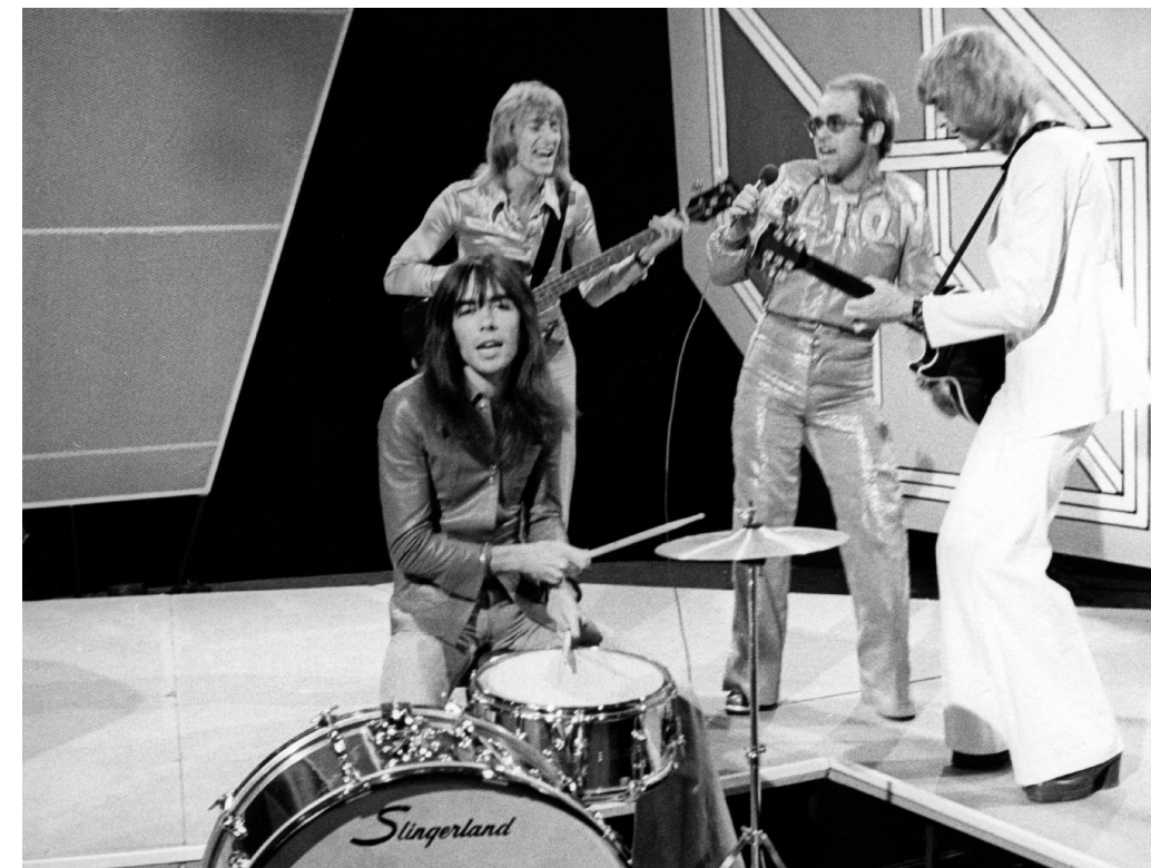
(Linksboven: De band, bassist Dee Murray, drummer Nigel Olsson, Elton John en gitarist Davey Johnstone, circa 1974.) (Rechtsboven: Producent Gus Dudgeon, februari 1971.) (Onder: Optreden bij Top Of The Pops.)