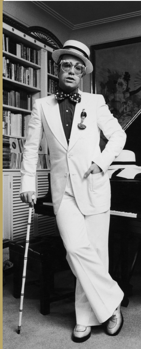
Reginald Dwight verandert zijn naam officieel in Elton Hercules John.