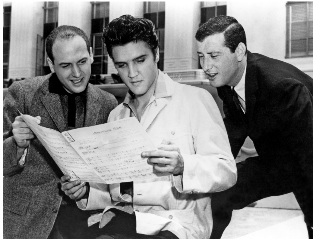
(Met songwriters Mike Stoller en Jerry Leiber bekijkt Elvis bij CM Studios de bladmuziek van 'Jailhouse Rock', 1957)

'Mijn armen en benen volgen gewoon de muziek.'