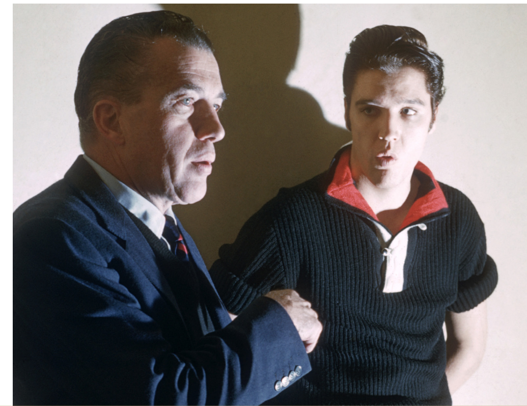
(Rechtsboven: Tijdens The Ed Sullivan Show op 6 januari 1957 in New York) (Linksonder: Ed Sullivan met Elvis tijdens een persconferentie voor Presley's eerste optreden in The Ed Sullivan Show )

Elvis geeft zijn eerste van drie tv-optredens in de Ed Sullivan Show, die daarmee als variétéshow op televisie de hoogste kijkcijfers ooit scoort. Zijn eerste film, Love Me Tender , beleeft in november zijn première.