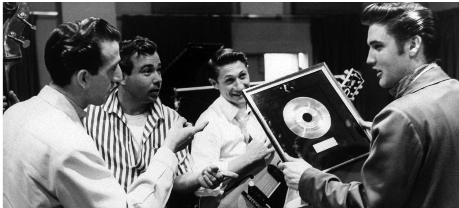
(Voorgaande pagina's: Elvismania. Een enthousiaste menigte jongeren tijdens een concert in Tupelo, Mississippi, 26 september 1956) (Boven: Drummer DJ Fontana, zanger Gordon Stoker, gitarist Scotty Moore en Elvis met de ingelijste gouden plaat voor 'Heartbreak Hotel')

Jaren later herinnerde Keith Richards van de Rolling Stones zich nog steeds de impact van het nummer. Het was de eerste keer dat hij iets hoorde wat zo kaal