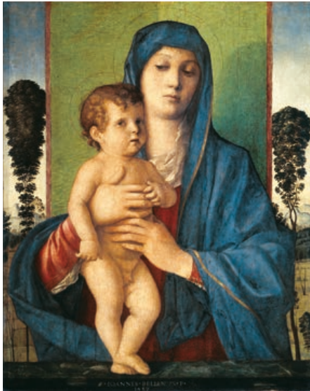
Giovanni Bellini Madonna met de boompjes 1487 Venetië, Gallerie dell'Accademia

Als beeldhouwer was Verrocchio gewend met natte doeken beklede terracotta beelden als model te gebruiken, wat volgens sommige critici een verklaring is voor de chiaroscuro -techniek (licht-donkerteknik) met penseel op doek die door zijn leerlingen vooral bij studies van gewaden werd gebruikt. De eigenaar van de werkplaats maakte hier een test van, die iedereen die bij hem in opleiding wilde moest afleggen.