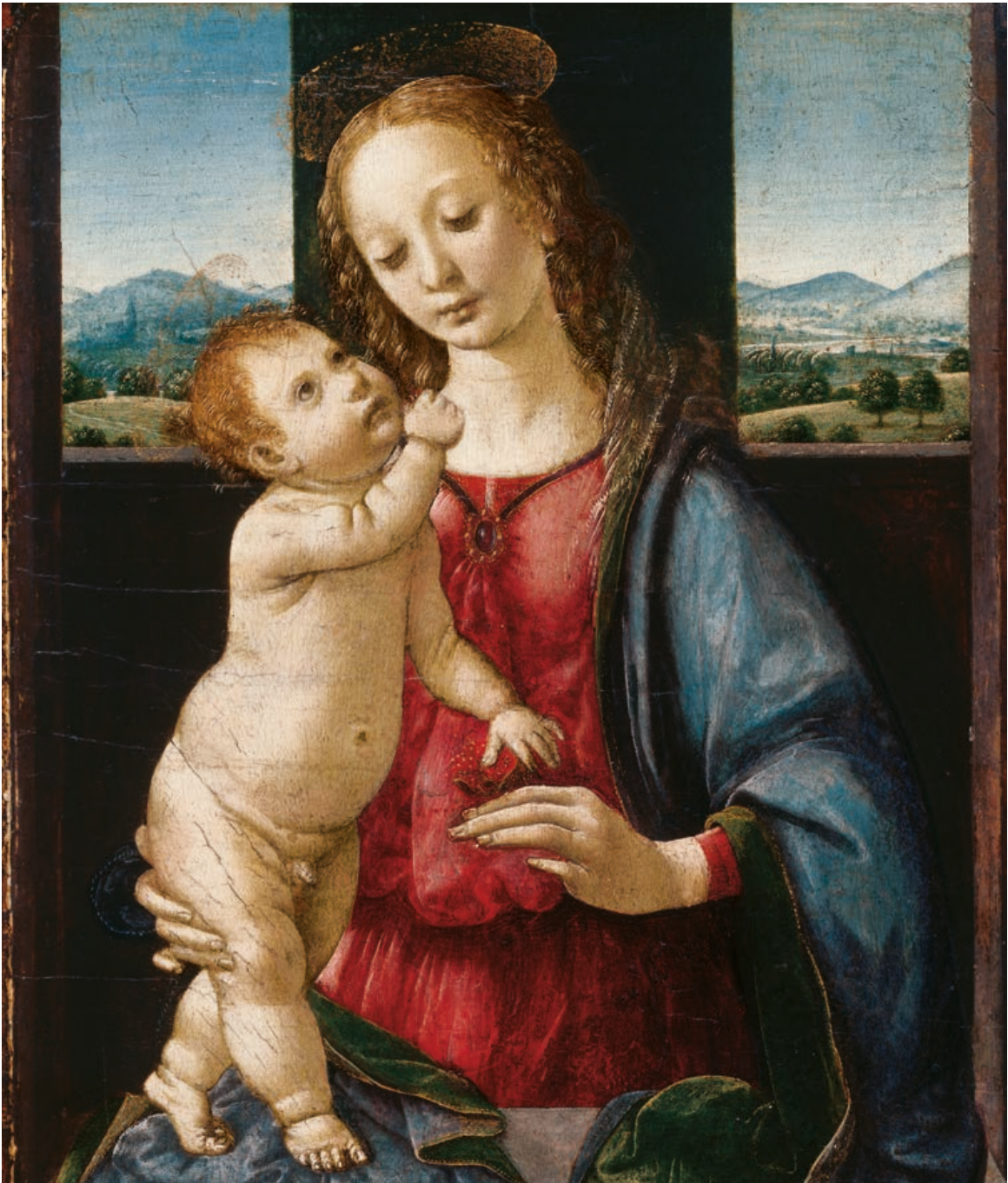
Leonardo da Vinci Madonna met de granaatappel (Madonna Dreyfus)

circa 1469, olieverf op paneel, 15,7 x 12,8 cm