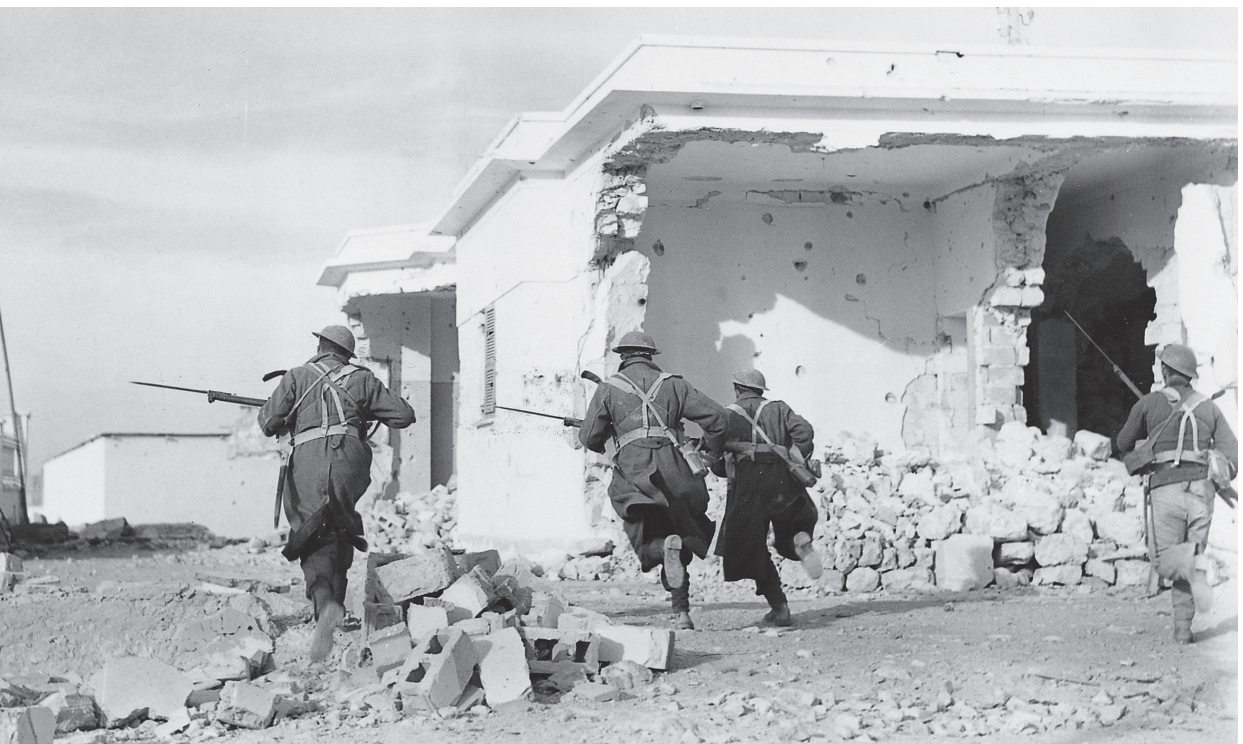
1941: militairen rennen door de straten van Bardia in Libië. Een foto van het Britse leger.