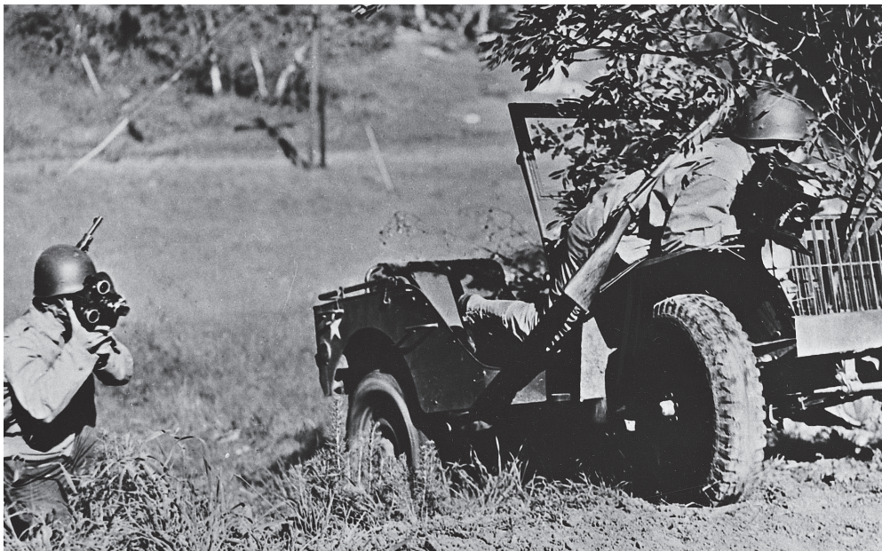
Fotografen van het Amerikaanse leger in actie.