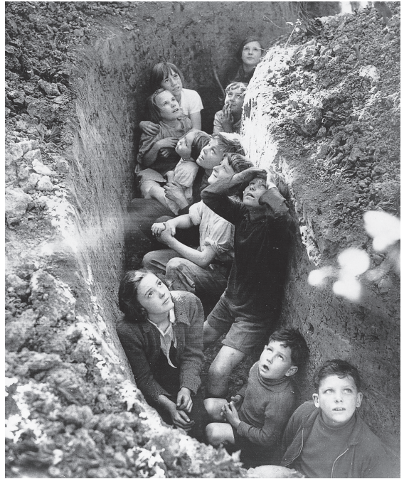
BOVEN: de geest van de Blitz in Londen, november 1940. RECHTSBOVEN: Britse kinderen schuilen tegen een luchtaanval, Kent 1940.