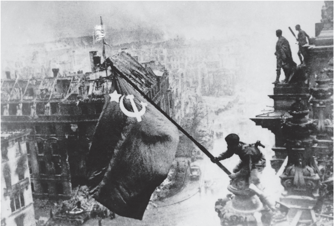
30 april 1945: de Russische vlag wordt gehesen op de Reichstag; door Yevgeni Khaldei, fotograaf van het Rode Leger.

een totalitair regime te zijn. Duitse militaire fotografen die niet beschikten over voldoende ideologisch ‘enthousiasme’ werden naar het Russische front gestuurd; Russische fotografen konden worden geëxecuteerd als ze ‘defaitistische’ foto’s maakten.