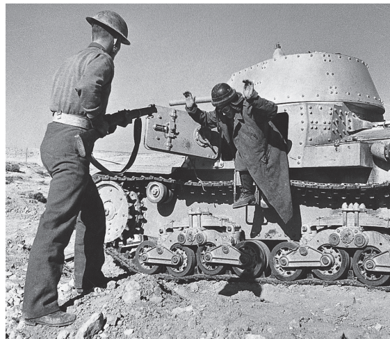
1941: een in scène gezette foto van een Italiaan die zich overgeeft.

De fotografen uit de Tweede Wereldoorlog hadden verschillende redenen om te fotograferen. In de periode voor het uitbreken van de oorlog hadden de nazi's de fotografie gebruikt in hun propagandastrijd. Adolf Hitler zelf was geobsedeerd door het creëren van het juiste beeld van hemzelf voor het nageslacht en hij verbood foto's waarop hij een bril of een lederhose droeg. Met een steek onder water naar Churchill, zei hij: "Je kunt niet worden vereeuwigd met een sigaar in de mond". De minister van Propaganda Josef Goebbels had propagandadiensten in elke legereenheid, met elk meer dan honderd voertuigen en motorkoeriers om films naar de dichtstbijzijnde luchtbasis te brengen. Elke foto die door de Duitse militaire fotografen werd genomen, werd gecontroleerd op het effect ervan op de oorlogsinspanningen. De Russen hadden eenzelfde politiek. Het kon gevaarlijk zijn een officiële fotograaf van