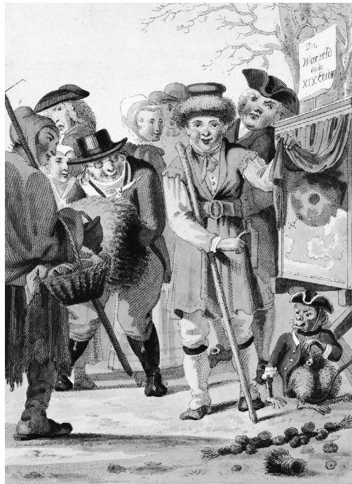
Titelprent van Jacob Smies, De waereld in de XIX eeuw , 1803.

Dat met het Bataafse revolutiejaar 1795 werd geschermd om rechtstreekse verkiezingen af te wijzen vond Kneppelhout onzin. '1795 en 1848 in vergelijking! Hoe is het mogelijk! De doldriftigheid dier dagen is ons vreemd. Beleid en gematigdheid staan op den voorgrond.' Het thans gevraagde 'zuiver constitutioneel stelsel' sluit rechtstreekse verkiezingen in, zij het niet zoals destijds met algemeen kiesrecht maar met 'een behoorlijken maatstaf van bevoegdheid, door de wet te regelen'. Ofwel censuskiesrecht. Hij noemde 1795 dan ook 'een klank, waarbij men zweert, een ijdel beeld, een vogelverschrikker'.