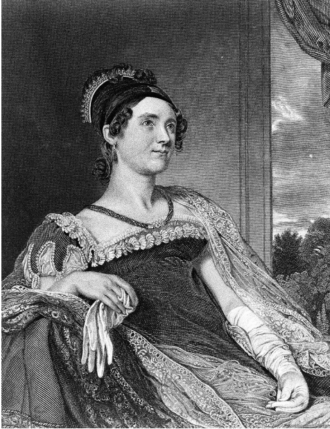
Louisa Adams, (Mrs. John Quincy Adams), 1852.

De wegen werden vanaf Königsberg en Berlijn steeds beter. ‘Tot mijn grote verbazing,’ schreef Louisa ter hoogte van Berlijn, ‘hoorde ik hier niets dan lofprijzingen op de daadkracht van Napoleon.’ De bevolking aldaar verzekerde haar dat ze hier ‘over de mooiste wegen in de wereld reisde, die op zijn bevel [dat van de keizer] waren voltooid’. 2