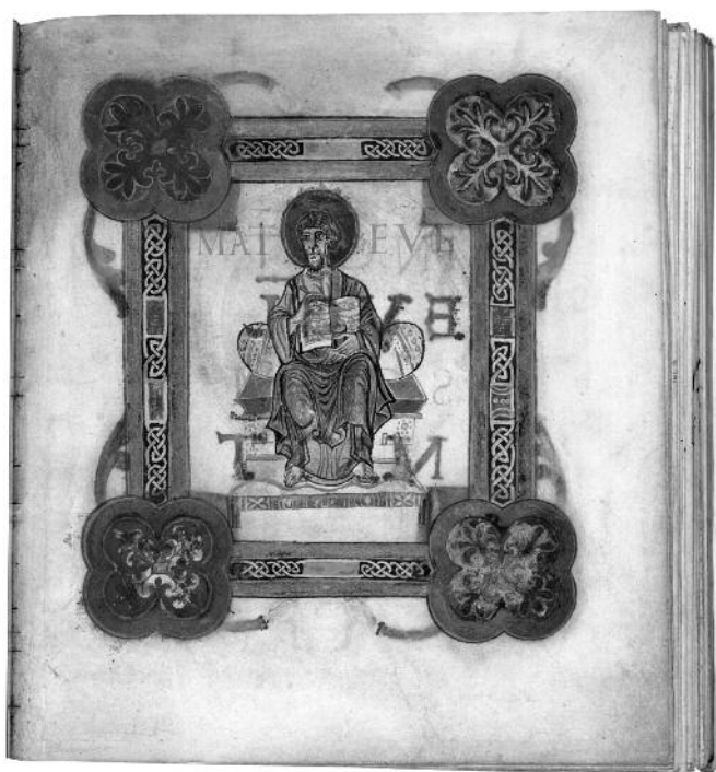
Evangeliarium van Egmond, de evangelist Mattheus.

De Austrasische oorsprong van de Karolingen had tot gevolg dat vooral het gebied tussen Maas en Rijn een centrale rol speelde in wat al een elitaire cultuur is genoemd. Het hof, de adel, rijke abdijen en kerken hebben prachtig versierde handschriften laten vervaardigen, soms naar Byzantijns model met gouden letters op purpergekleurd perkament en ingebonden in met edelstenen versierde banden. Vanuit die eenheidsvisie werd ook een eenvormig schrifttype, de ‘Karolingische minuskel’ ontworpen, dat door zijn eenvoud de kennisoverdracht moest helpen versnellen.