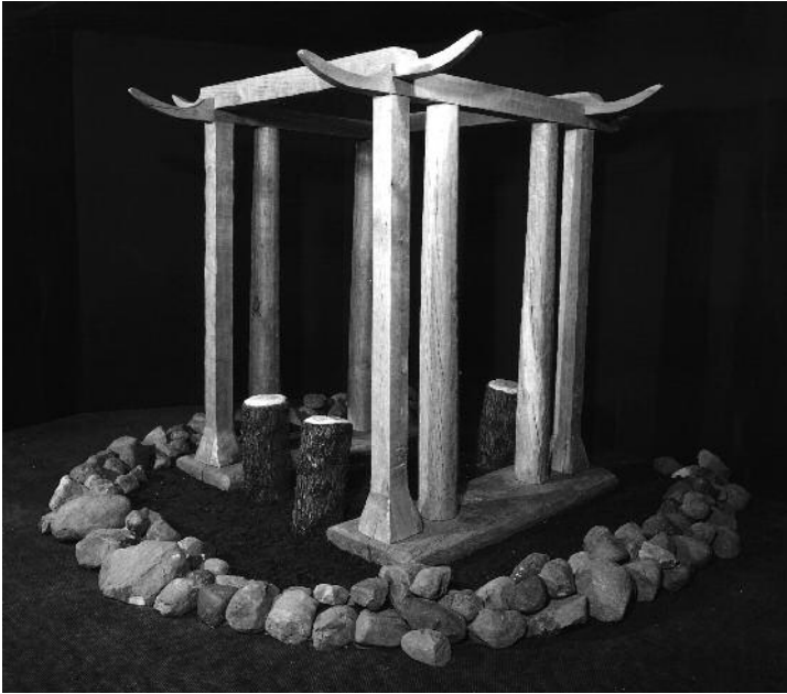
Reconstructie van de 'tempel' in het Barger-Oosterveld, Drenthe (bronstijd circa 1050 v.Chr.).

band van zandleem of zand, vanaf Frans- en West-Vlaanderen via de Kempen en de Midden-Nederlandse zandgronden tot het Drentse plateau. Dit landschapstype impliceert een gemakkelijk te bewerken, maar onvruchtbare en snel uitgeputte bodem, die aan verstuiving stond blootgesteld of waar vaak – door overbeweiding – heide een oorspronkelijk bosbestand kwam vervangen. De rest is kustgebied, blootgesteld aan de transgressie- en regressiefasen van de zee, of rivierengebied waar verzanding de inwerking van de zee corrigeerde. Het grote estuarium dat Schelde, Maas en Rijn samen vormden was permanent aan veranderingen onderhevig, waarbij de ingreep van de mens zeker vanaf de Romeinse tijd meetelde. De Romeinen noemden deze delta Helinium. Bewoning op het veen was eeuwenlang goed mogelijk, maar nam nadien af, blijkbaar onder invloed van menselijke en fysische factoren (onder meer ontvening) en overleefde enkel op natuurlijke en vooral op kunstmatige verhevenheden, zoals de terpen die nu nog in het Friese landschap opvallen.