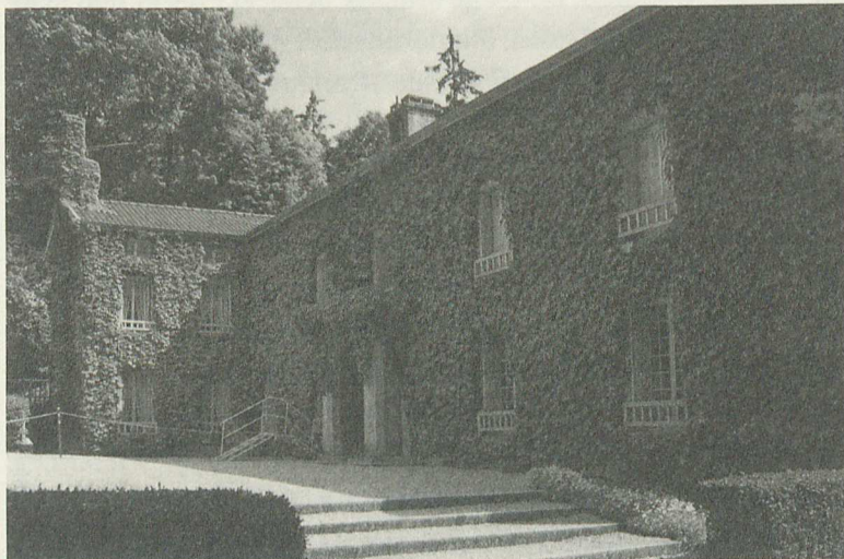
La Boisserie, het huis van De Gaulle in Colombey

De De Gaulles hebben er vóór de oorlog slechts een paar va-