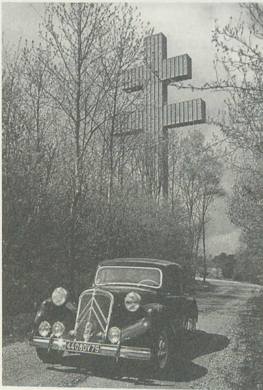
Het Kruis van Lotharingen. Monument voor De Gaulle in Colombey- les-Deux-Églises

midden van niets. Het huis ligt buiten het dorp en had, toen De Gaulle het in 1934 kocht, een flinke tuin van tweeënhalve hectare. Later heeft hij grond bijgekocht. Het had toen veertien kamers, verdeeld over twee verdiepingen, en een zolder. Na de oorlog heeft hij er een toren bijgebouwd. Daar bevindt zich het beroemdste vertrek van het huis, namelijk de studeerkamer waar hij zijn oorlogsmemoires schreef en die een uitzonderlijk mooi en weids uitzicht over het glooiende landschap biedt.