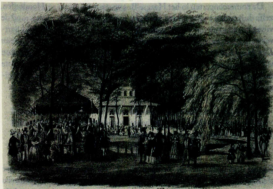
De buitensociëteit van 'De Witte' in het Haagse Bos (1844)

De leden van de Nieuwe of Littéraire Sociëteit op het Plein – beter bekend als 'De Witte' – genoten met de volste teugen. Sinds 1819 beschikten zij aan de oever van de kleine waterpartij over een eigen buitensociëteit: oorspronkelijk niet meer dan een linnen tent, maar sinds 1823 een sierlijk houten gebouwtje, geschikt voor de toen al bijna vijfhonderd leden van de sociëteit. Het waren de leden van deze sociëteit die het initiatief hadden genomen om hier tijdens het zomerseizoen tweewekelijkse openluchtconcerten te organiseren, sinds 1829 verzorgd door de militaire kapel van de grenadiers en jagers, het nieuwe eliteregiment van de stad. 4 De leden van De Witte – hoofdzakelijk hoge staatsfunctionarissen, magistraten, ambtenaren, officieren, beoefenaars van academische vrije beroepen en renteniers – vormden in Den Haag een bijzondere sociale groep. Jonckbloet beschreef hen in 1843 in enigszins satirische bewoordingen: 'Tussen adel en burgerij heeft men hier in den Haag nog eene klasse van menschen die te groot voor het eene, te klein voor het andere, overal elders eene problematike positie zouden hebben, maar die hier onder den naam van fatsoenlijke lui bekend zijn.' 5 Bij de concerten in het Haagse Bos leken de leden zich echter nauwelijks van hun 'problematike' positie bewust te zijn. Integen-