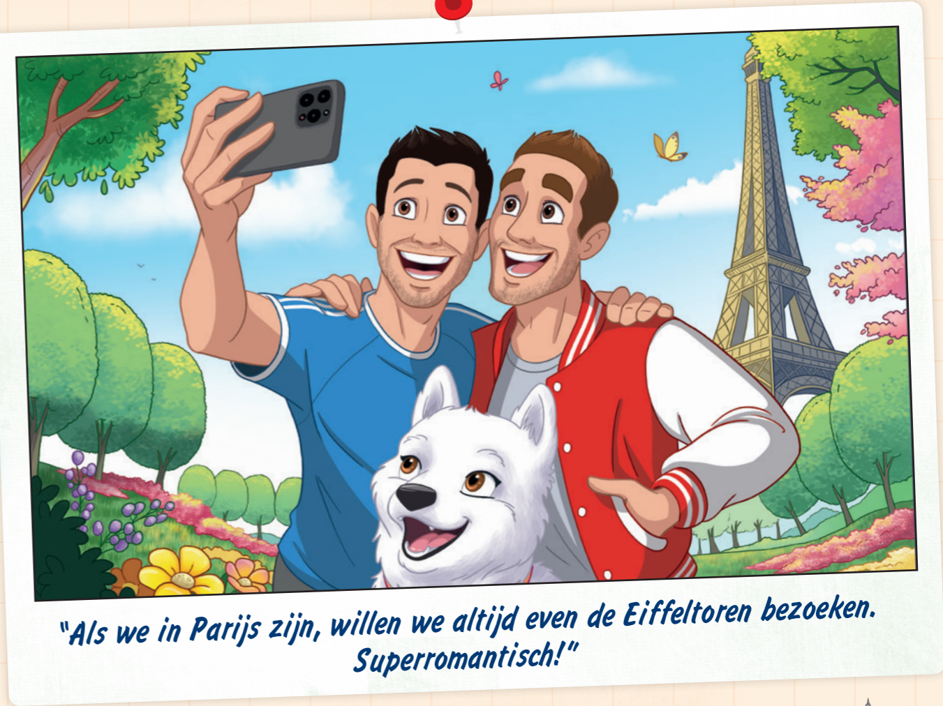
"Als we in Parijs zijn, willen we altijd even de Eiffeltoren bezoeken. Superromantisch!"