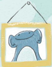
Ewout de aap