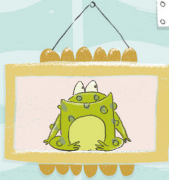
Guus de pad