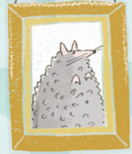
Arthur de rat