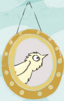
Bonnie de mus