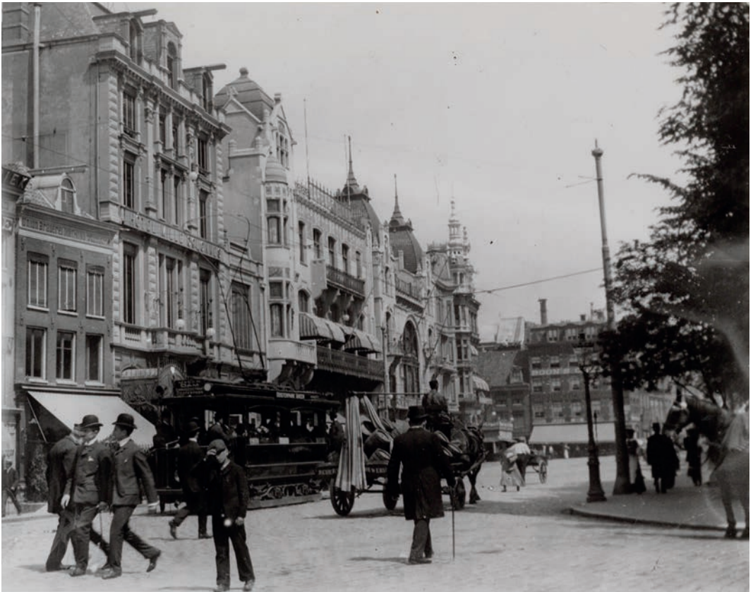
Rembrandtplein, oktober 1904

de balie wellicht, maar het was altijd druk en degene die moest worden gesproken, was meestal niet zo snel te vinden in de deinende mensenmassa. De dienstdoende bediende of receptioniste zou zo lang tussen de menigte moeten zoeken dat aan de andere zijde zuchtend werd opgehangen. De beller werd gedwongen om zelf zijn opwachting te maken op 'het plein', waar Hotel Café Restaurant Schiller zich eenvoudig liet vinden en waar hij of zij hartelijk of afstandelijk, precies zoals gewent, werd begroet door de gastheer.