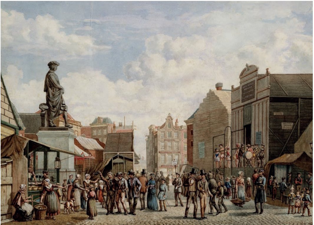
Feesten en kermissen op de Botermarkt, 1872

grote schilder. Gezegend zijt u, grote meester. Het standbeeld was de loutering van onze ziel en moest ons herinneren aan onze eigen grootheid, onze eigen identiteit na de pijnlijke scheiding met onze zuiderburen. Nederland is groot. Nederland is machtig. Ook zonder België dat deel van ons uitmaakte en zich had afgesplitst.