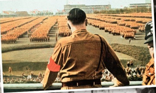
▼ Adolf Hitler spreekt nazisoldaten toe tijdens een appèl in 1933.