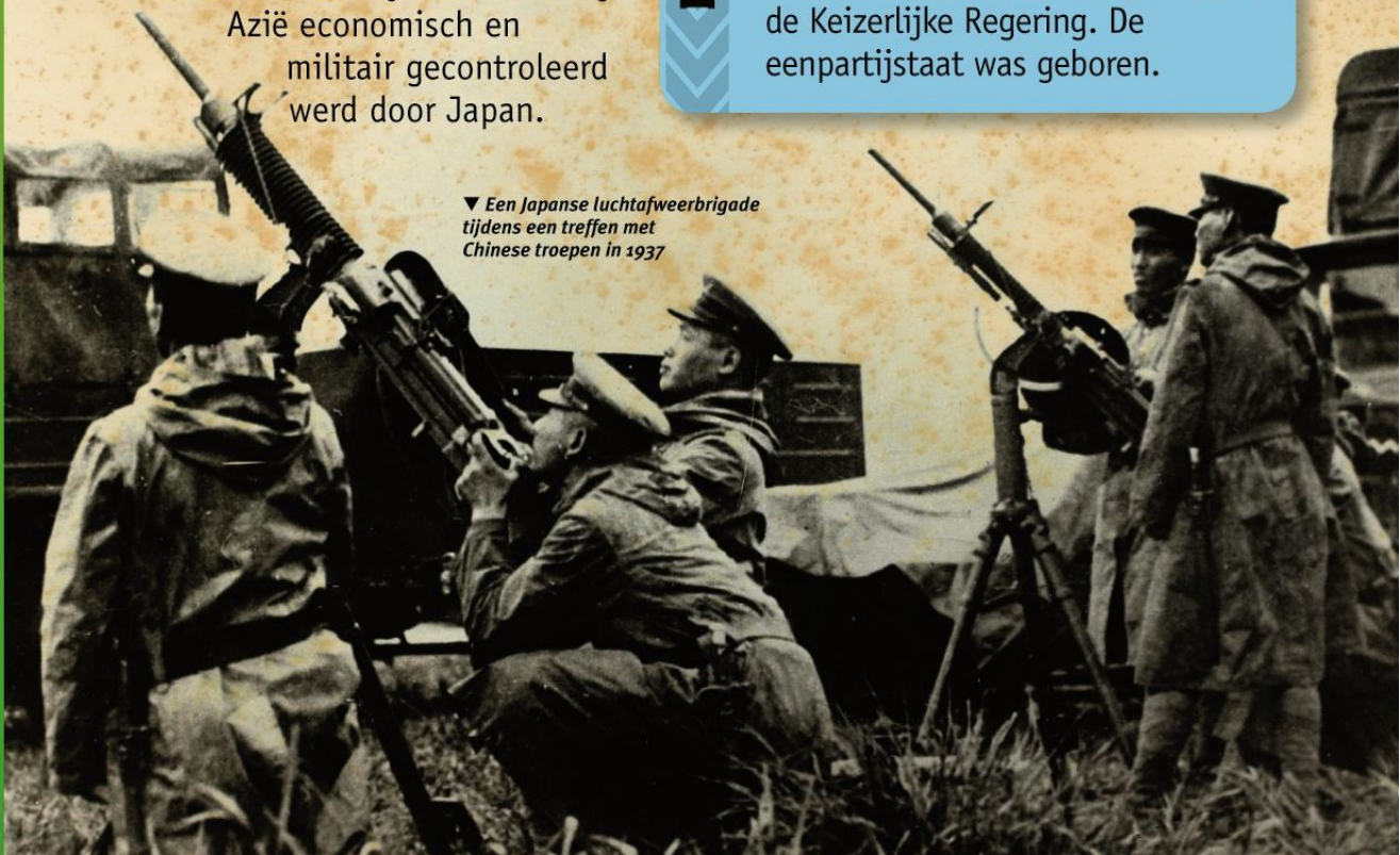
▼ Een Japanse luchtafweerbrigade tijdens een treffen met Chinese troepen in 1937

Japan was op papier een democratisch land met een parlement en een keizer als boegbeeld. Maar de eigenlijke macht was in handen van militaire nationalistenv en extremisten buiten het parlement. In 1940 gingen alle politieke partijen op in de Associatie voor de steun aan de Keizerlijke Regering. De eenpartijstaat was geboren.