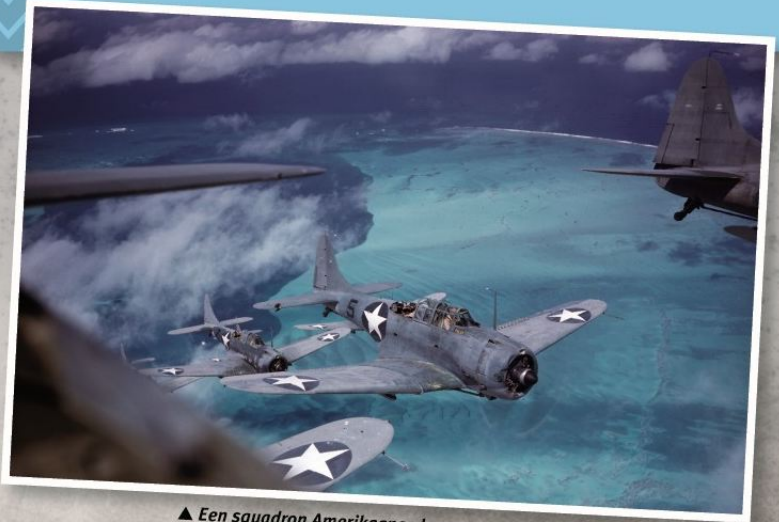
▲ Een squadron Amerikaanse bommenwerpers, dat in 1942 patrouilleert boven de koraalriffen voor de kust van Midway Island in de Stille Oceaan.

In 1931 brak er in Azië oorlog uit, die zich rond 1941 over heel Zuidoost-Azië en Oceanië had verspreid. In 1939 brak er in Europa oorlog uit en al gauw waren ook het Midden-Oosten en Noord-Afrika in de oorlog verwickeld. Britse en Franse koloniën in Noord- en Zuid-Amerika en de VS zelf raakten betrokken, maar pas na 1941. Alleen Centraal- en Zuid-Amerika waren niet direct bij de gevechten betrokken. De landen in deze regio's verklaarden in 1945 de oorlog aan de asmogendheden.