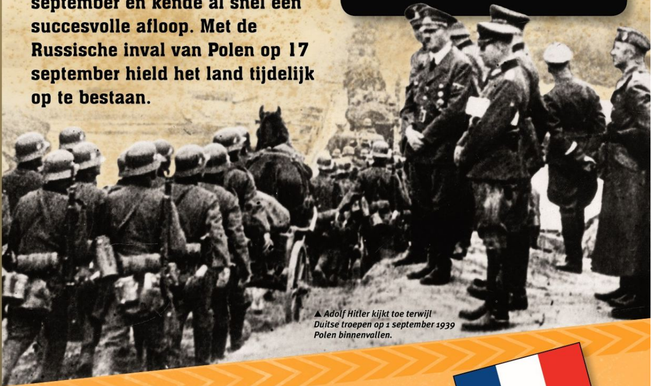
▲ Adolf Hitler kijkt toe terwijl Duitse troepen op 1 september 1939 Polen binnenvallen.

Met een oorlogstechniek die bekendstaat als Blitzkrieg ('Bliksemoorlog') vielen meer dan 1.500.000 Duitsers buurland Polen binnen. Bij deze aanval werden grote aanval tanks en pantservoertuigen ingezet, ondersteund door zware luchtbombardementen. Het Poolse leger werd snel onder de voet gelopen.