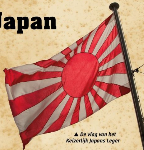
▲ De vlag van het Keizerlijk Japans Leger

In de Eerste Wereldoorlog vocht Japan aan geallieerde zijde en veroverde in een mum van tijd de Duitse koloniën in China en de Pacific. Maar net als Duitsland was Japan uit op meer grondgebied. Japanse nationalistenv wilden van Azië een Japans imperium maken en distantieerden zich van Amerikaanse en westerse invloeden.