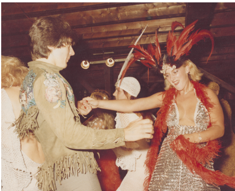
Met Gerard Joling