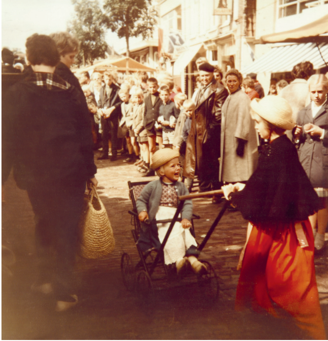
Op de West-Friese markt in Schagen

een black-out had gekregen? Het machtige gevoel dat ik mensen kon laten lachen was overweldigend. Of moet ik nog verder terug, naar de West-Friese markt in Schagen, waar ik als achtjarige op een houten verhoging de klompendans deed en opeens achter de microfoon belandde? Of naar het huis waar ik ben opgegroeid aan de Gedempte Gracht in Schagen, en waar ik tijdens de afwas driestemmig liedjes zong met mijn zussen Annelies en Yolanda?