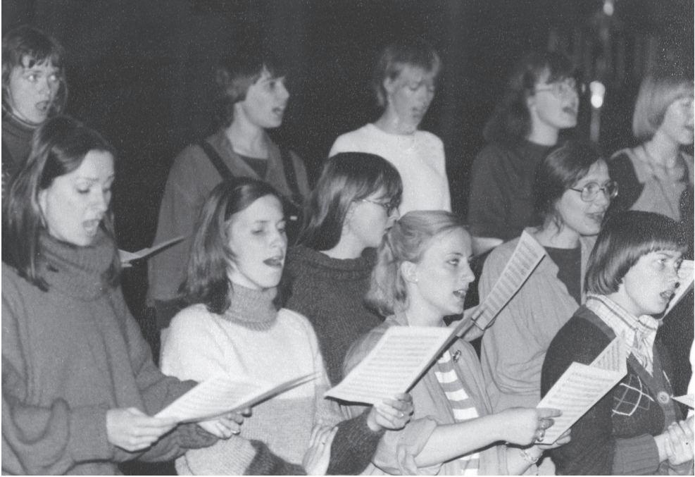
Het VU-Kamerkoor (1979)

Andriessen en Klaas de Vries. Al doende leerde ik wel goed van blad lezen en ging ik muziek steeds beter begrijpen. Dat waren dingen die ik dan weer meenam naar de selectie cursus op zaterdag en waarmee ik in positieve zin opviel, want er liepen heel wat aspirant-kleinkunststudenten rond die muzikaal niet erg onderlegd waren.