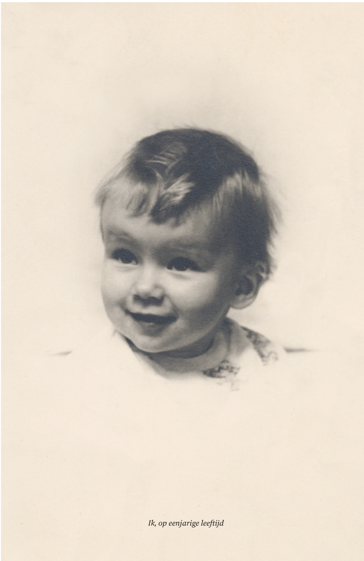
Ik, op eenjarige leeftijd