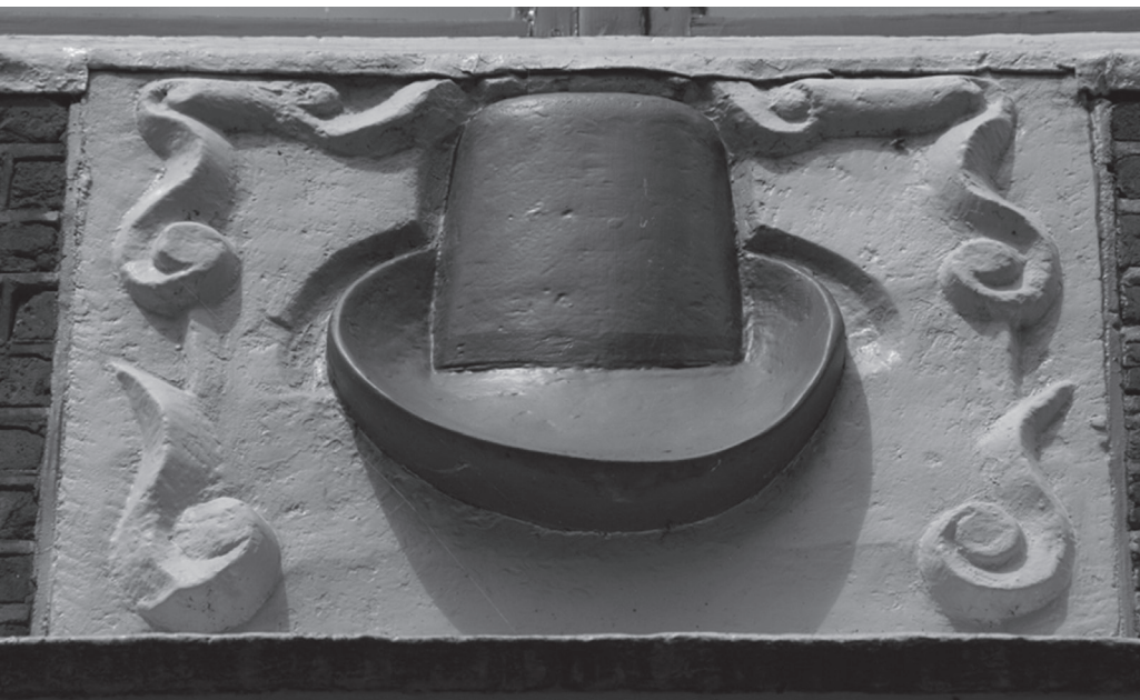
Zeventiende-eeuwse gevelsteen van 'Huys den Hoet'