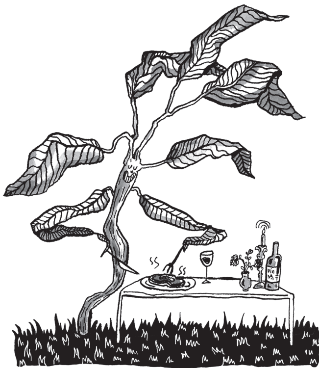
“ De vleesetende Plant ”

wankel houten bruggetje steken we over, lopen nog een stukje door en komen dan bij een rotswand. Ik blijf staan, Lennon botst tegen me op. Wauw! Is dat een vleesetende plant? Gaaf! ‘Moet je zien, Lennon!’