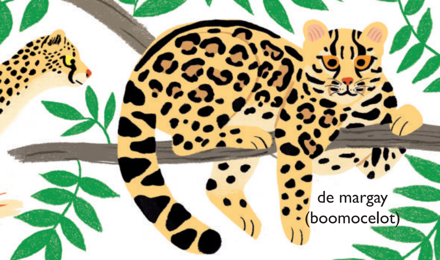
de margay (boomocelot)