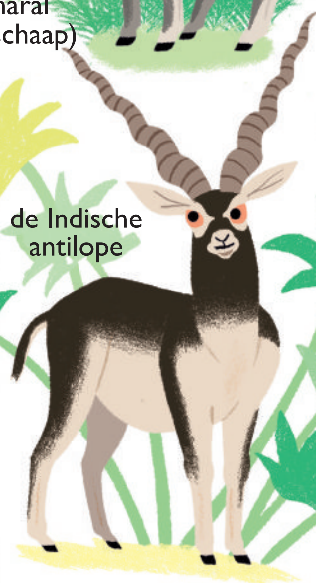
de Indische antilope