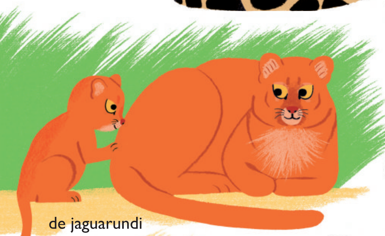
de jaguarundi (wezelkat)