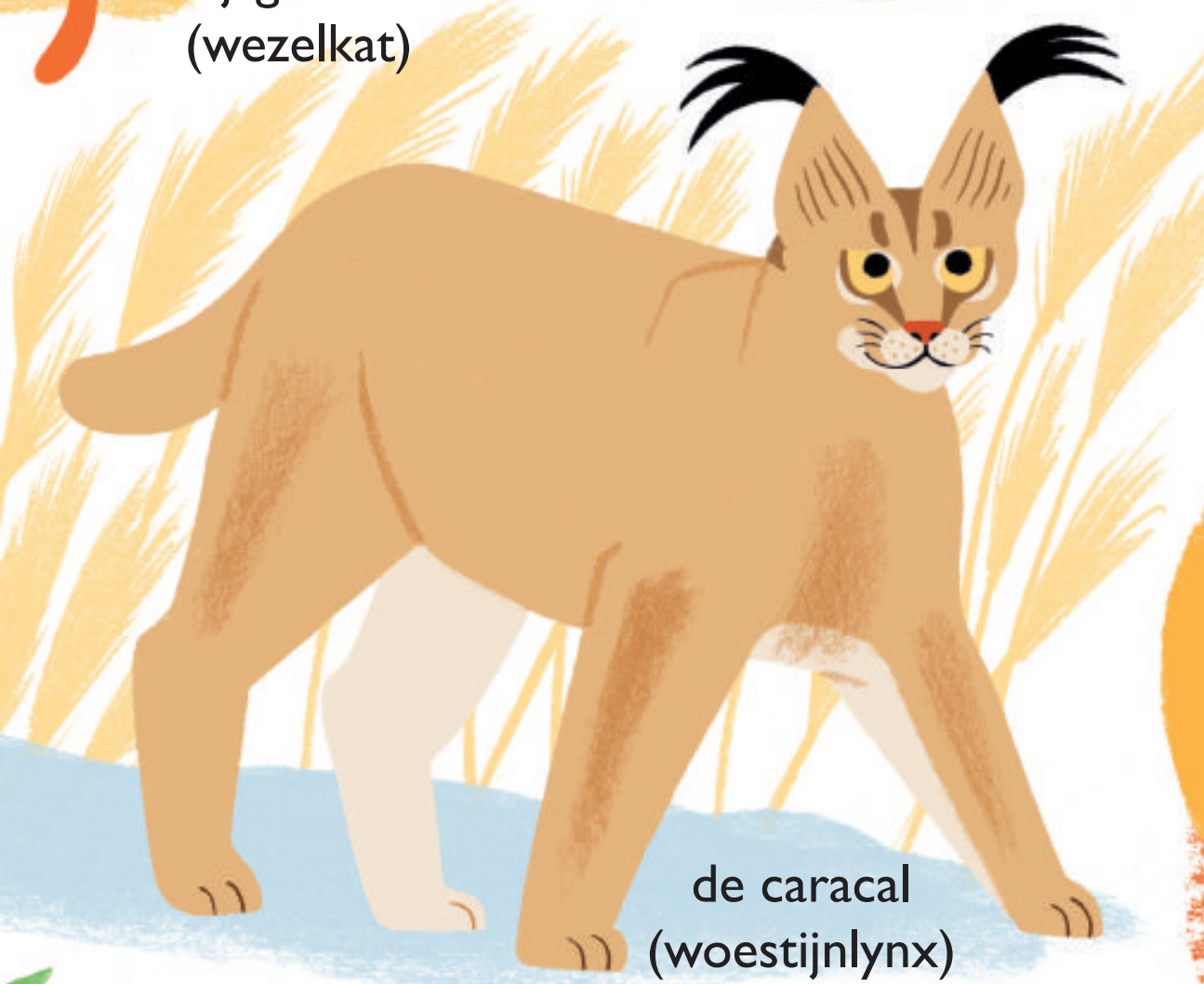
de caracal (woestijnylx)