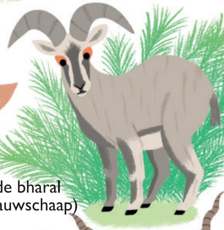
de bhara (blauwschaap)