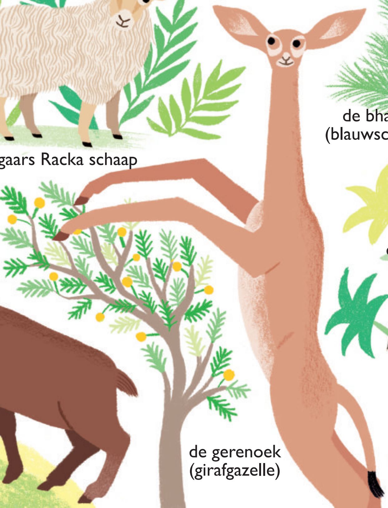
de gerenoek (girafgazelle)