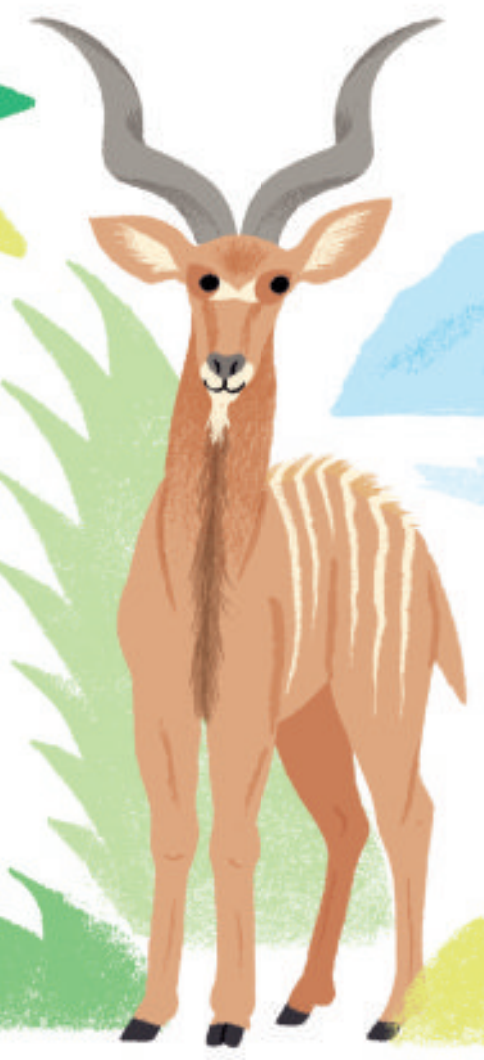
de grote koedoe