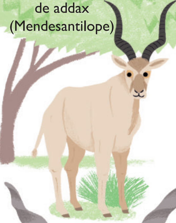
de addax (Mendesantilope)