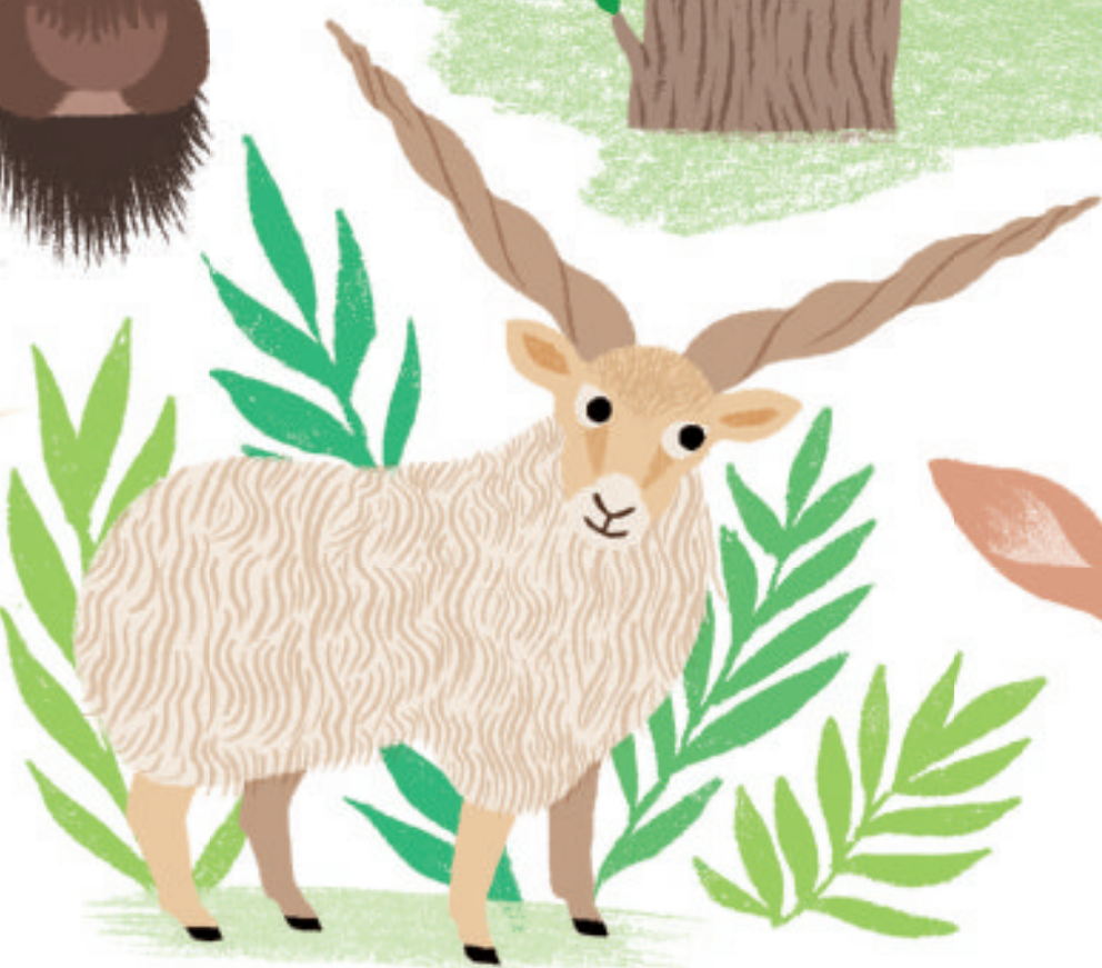
het Hongaars Racka schaap