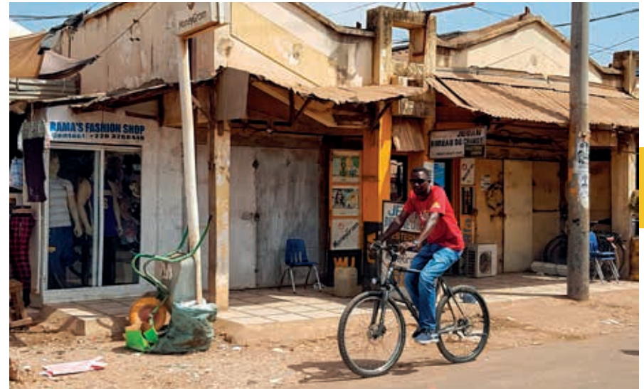
Vooral jonge mensen voelen zich aangetrokken tot de bedrijvigheid.

De snelle groei van Serekunda heeft in stedenbouwkundig opzicht nogal ongeorganiseerd plaatsgevonden. Een duidelijke structuur ontbreekt en markante bouwwerken zijn er niet, of het zou de enorme, met Pakistaans geld gefinancierde en enigszins in mogolstijl gebouwde moskee aan de oostrand van de stad moeten zijn (let op de groenwitte minaretten). Bij deze moskee bevindt zich tevens een privékliniek, eveneens met Pakistaans geld opgezet. Verder is er geen hoogbouw van betekenis in Serekunda. Wat er aan grotere