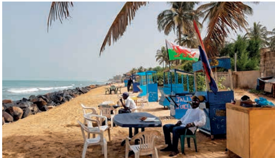
Langs de toeristenkust bevinden zich leuke restaurants en andere uitgaansgelegenheden.

Tussen Kotu en de toeristenclave bij Kololi is een paar jaar geleden een groepje fraaie nieuwe hotels verrezen die tot de beste in Gambia behoren. Grootste blikvangers zijn het African Princess Beach Hotel, het Balafon Beach Resort en het ernaast geleden Djembe Beach Resort. Na enkele honderden meters kondigen beachbars het naderen van Kololi aan. Hier ligt een grote concentratie aan hotels, restaurants en andere nuttige voorzieningen bij elkaar gegroepeerd, ideaal voor een onbezorgde zonzvakantie. Bij de hotels en bij de kleinere touroperators in de straten tussen de diverse voorzieningen kun je verder ook uitstapjes boeken naar de bezienswaardigheden elders in het land. Je kunt er ook taxi's charteren of een bus taxi nemen, waarna je vanaf Serekunda zelf je trips kunt regelen.