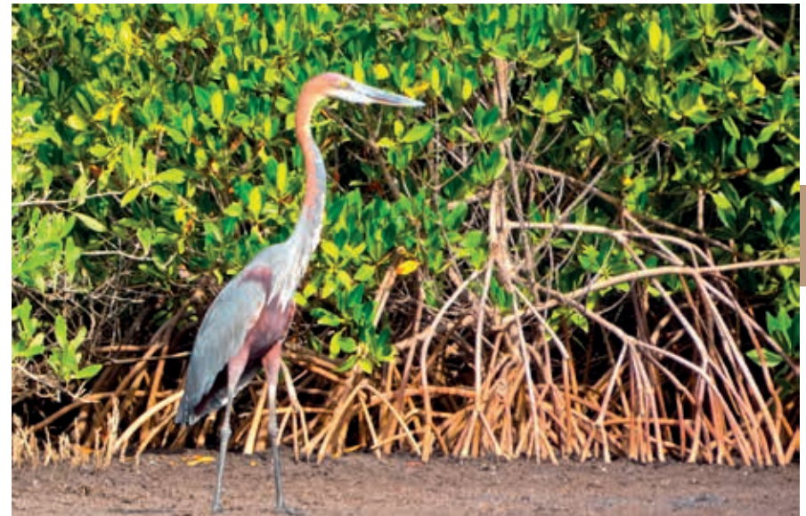
Reuzenreiger in Parc National du Saloum.

Een deel van het gebied is nationaal park, het Parc National du Saloum, dat sinds 2011 op de UNESCO-lijst met werelderfgoederen prijkt vanwege de vissers- en schelpenverzamelerscultuur van de inwoners van het gebied. Aan wild komen er talloze vogelsoorten, otters, mangoesten, civetkatten, krokodillen, varanen, kameleons, wrattenzwijnen, enkele herten- en gazellesoorten, hyena's en jakhalzen en de zeldzame zeezoogdier voor. Ook zijn er enkele stranden waar zeeschildpadden hun eieren leggen. Een bezoek aan de Siné-Saloum-regio is zeker aan te raden, want het is een van de mooiste streken van Senegal en het is er bovendien heerlijk rustig. Rond de rivierdelta vindt overigens steeds meer verbouw van pinda's plaats, waardoor het een van de belangrijkste regio's voor dit landbouwproduct begint te worden. Voor toeristen zijn de plaatsen Toubacouta, Sokone, Foundiougne, Ndangane, Palmarin en Djifère (of Djiffer) van belang. Het zuidoostelijke deel van het gebied is vanuit Gambia goed te bereiken, het noordelijke deel kun je het beste bereiken vanuit Dakar en de Petite Côte. In het zuidelijke deel heeft Toubacouta twee prima overnachtingsgelegenheden voor wie vanuit Gambia een meerdaagse trip overweegt, en ook bij Sokone zijn twee goede