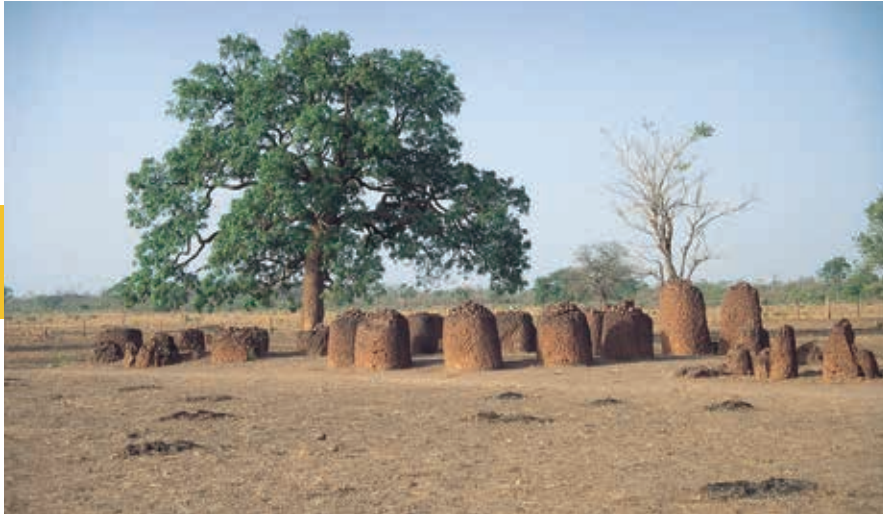
Over de herkomst van de mysterieuze stencirkels bij Wassu is nog veel onduidelijk.