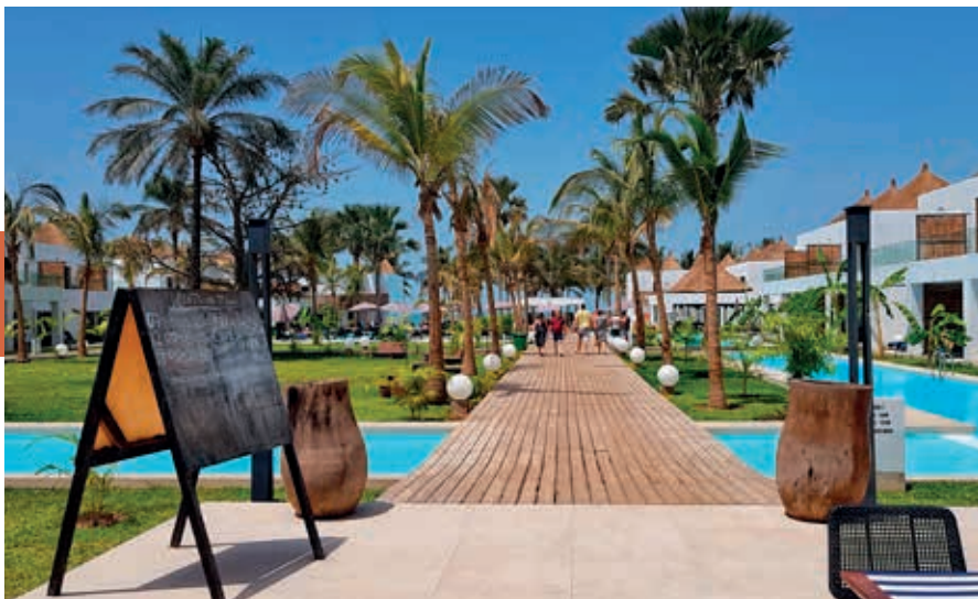
Het Balafon Beach Resort.

palmen en casuarinabomen erlangs en is kunstmatig verbreed nadat een storm een paar jaar geleden een groot deel van het zand had weggeslagen. Het strand biedt fijn zand, verkopers van snuisterijen, vrouwen die je tegen betaling een Afrikaanse haardracht aanmeten, langssjokkende zeboes, fruitsapstalletjes en warm zwemwater. Bij de grote hotels zijn bewaakte stukken strand en worden de zwemcondities in de gaten gehouden. Ga niet zwemmen als de rode vlag is gehesen, want de Atlantische Oceaan kan behoorlijk tekeergaan en heeft soms gevaarlijke onderstromen.