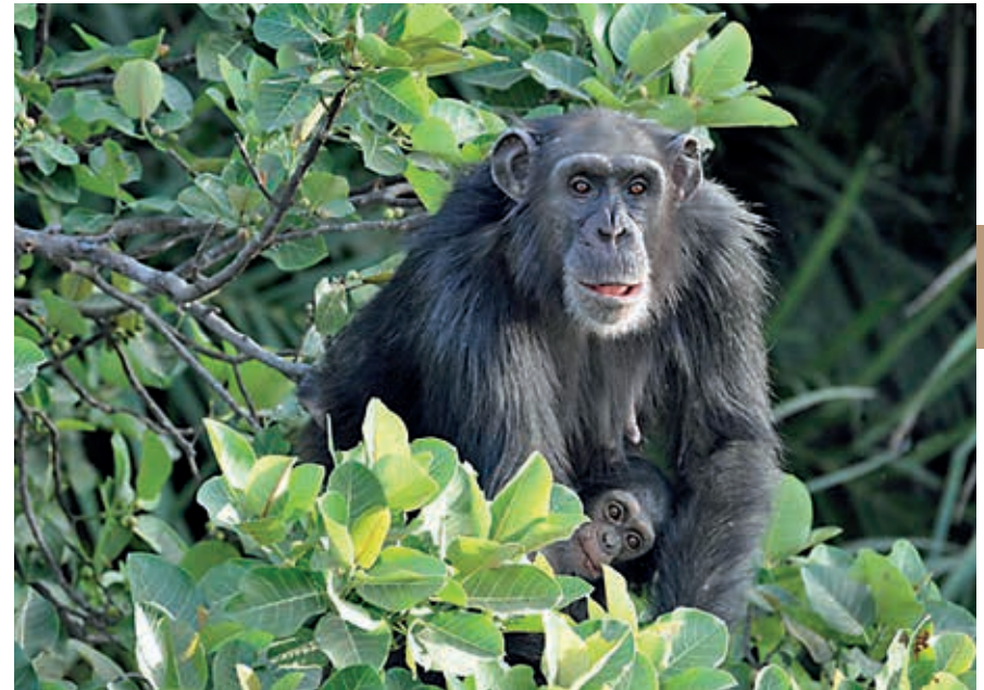
Op Baboon Island kunnen chimpansees weer wennen aan de vrijheid.

Een handvol kilometers na de grote bocht in de rivier bereikt de hoofdweg de plaats Brikamba (of Brikama Ba, niet te verwarren met Brikama in het westen). Hier staat een aardige moskee met koepeldak. Naar het zuiden