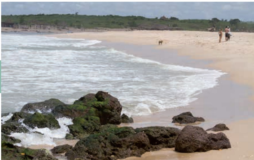
Het strand bij het Réserve de la Somone.

Aan de andere kant van de N1 wijst een bord langs de weg naar Accrobaobab , een avontuurlijke attractie tussen de baobabs. Om er te komen, moet je een kilometer of drie over een onverharde route; let op de kleine bordjes. Op het omheinde terrein van Accrobaobab kun je klauteren langs de stammen van baobabs, je kunt er een parcours tussen de boomtoppen afleggen met hangbruggen, een glijkabel en zelfs een kleine pirogue die aan twee kabels hangt. Er staat ook een grote trampoline waar je gebruik van kunt maken terwijl je zelf met elastieken aan twee baobabs vastzit. Voor kleine kinderen is er een eigen klim- en klauterstellage en er is een restaurant aanwezig. Voor dit alles moet wel flink in de beurs getast worden.