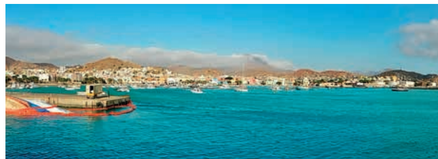
Zicht over de baai van Mindelo.

De bloeitijd van Mindelo was echter van korte duur, want in 1869 was het Suezkanaal gereed, zodat schepen naar Azië voortaan niet meer via de Atlantische Oceaan en Kaap de Goede Hoop hoefden. De schepen werden bovendien