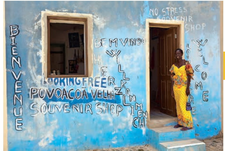
Senegalees souvenirwinkeltje in Povoação Velha.

Vanuit Sal Rei loopt een weg in oostelijke richting over het eiland. Via het gehucht Bofafeira kom je op het noordoostelijke deel van Boa Vista uit bij het dorp João Galego. De nederzetting is ook vanuit Rabil te bereiken over een klinkerweg, die enkele kilometers voor het dorp samenkomt met de weg vanuit Sal Rei.