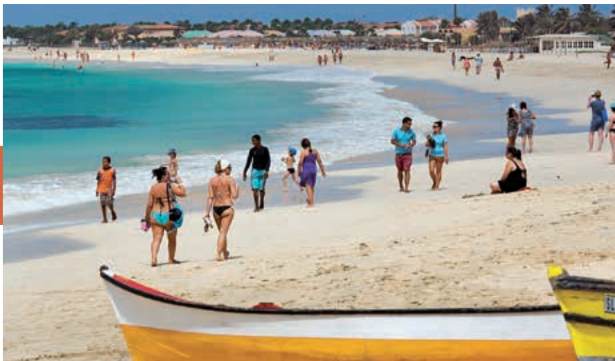
Het prachtige strand van Santa Maria.

Ga je vanaf het centrale plein zuidwestwaarts, dan kom je bij de pontão (de centrale pier) die hier vanaf het strand de baai in steekt. Op de houten pier zijn souvenirwinkeltjes met Afrikaanse snuisterijen en kantoortjes waar je excursies kunt boeken. Langs Rua 1 de Junho en in zijstraten vind je allerlei cafés, restaurantjes en andere toeristische voorzieningen. Loop je vanaf de pier verder naar het westen, dan kun je op de wandelpromenade bij het strand kiezen uit verschillende horecagelegenheden met zeezicht.