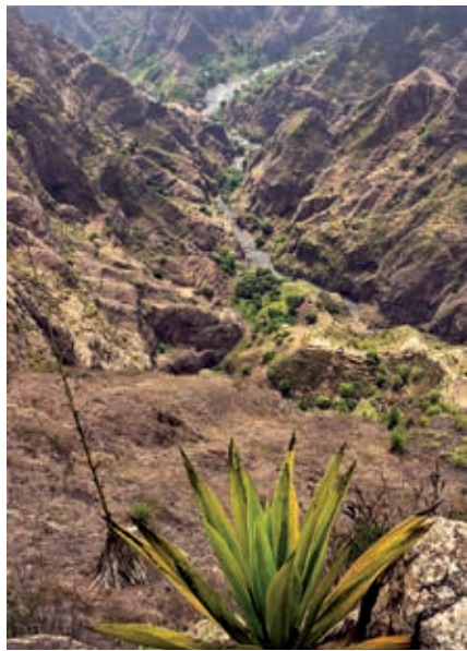
Door erosie zijn diepe valleien ontstaan.

Porto Novo zelf is het commerciële centrum van het eiland. De stad ligt vrij langgerekt langs de kust met uitlopers het binnenland in. Er staan veel vrij nieuwe gebouwen, grotendeels gefinancierd met ontwikkelingshulp uit Luxemburg. Het moderne aankomstgebouw bij de veerhaven heeft, heel bij-