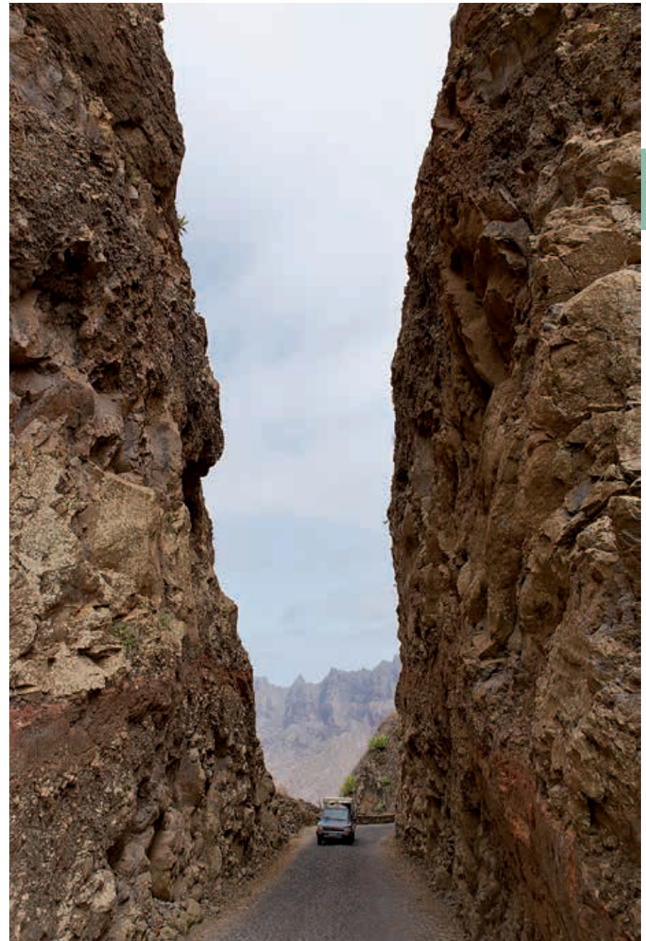
Landschappelijk spektakel op Santo Antão.

zonder in Kaapverdië, zelfs roltrappen. Er zijn in Porto Novo verder een paar aardige straten met kinderkopjes. Het festivalterrein aan de zeezijde leeft op als er festiviteiten zijn. Aan de westelijke rand van de plaats vind je het beste hotel van Santo Antão, het Santantão Art Resort. Voor het hotel en voor het centrum van de plaats liggen stranden met zwart vulkanisch zand en keien. Ten westen en ten oosten van Porto Novo zijn nog een paar van dit soort stranden te vinden, bijvoorbeeld bij Escoralet. Het zwarte zand maakt ze niet echt aantrekkelijk, maar de overheid vindt ze interessant genoeg om toestemming te geven voor de ontwikkeling van kleinschalige toeristische voorzieningen.