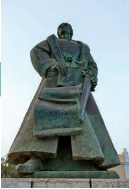
Standbeeld van Diogo Gomes in Praia.