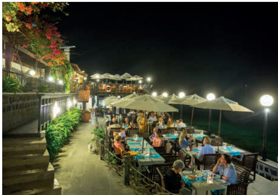
Restaurant in Sante Maria.

Terug in Santa Maria rijd je langs de grotere hotelcomplexen aan de westzijde van Santa Maria naar het einde van de weg. Hier liggen Hotel Farol, een all-inclusivehotel voor de Italiaanse markt, en het RIU Palace Santa Maria. Achter de hotels ligt een gebied met zandduinen. Dit beslaat de gehele