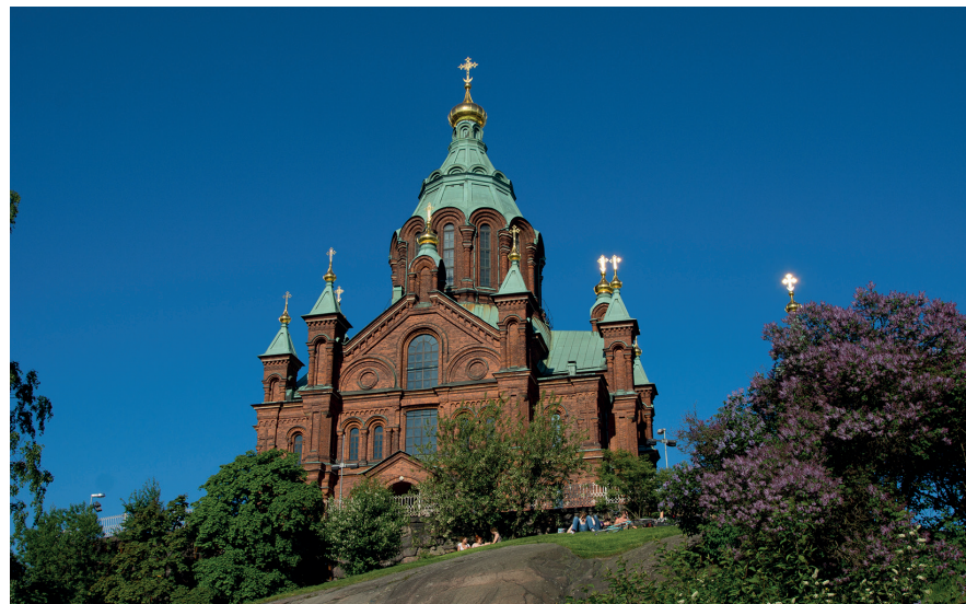
De Russisch-orthodoxe Oespenski-kathedraal.

In de wijk Kruununhaka/Kronhagen ten noorden van de domkerk staan veel gebouwen in empirestijl, veelal ontworpen door C.L. Engel, zoals de gebouwen van het oude ziekenhuis aan de Unionenkatu, die nu in gebruik zijn door de universiteit. Het Nationaal Archief aan de Rauhankatu is van recenter datum en werd in 1890 gebouwd naar ontwerp van Gustaf Nyström. Ook de Bank van Finland ertegenover is aan het eind van de 19de eeuw gebouwd. Voor het gebouw staat een beeld van J.W. Snelmann die ervoor zorgde dat Finland in de 19de eeuw zijn eigen valuta kreeg, de markka. Aan de andere kant van de Snelmannkatu staat het Huis van de Standen, eveneens ontworpen door Gustaf Nyström, waar de lagere standen (burgers, boeren en geestelijken) bijeenkwamen. De vierde stand – de adel – had (en heeft nog steeds) een eigen gebouw, Suomen ritarihuone/Finlands riddarhus aan de Ritarikatu/Riddaregata. Het timpaan van het Huis van de Standen laat tsaar Alexander I zien tijdens de Landdag in Borgå/Porvoo van 1809.