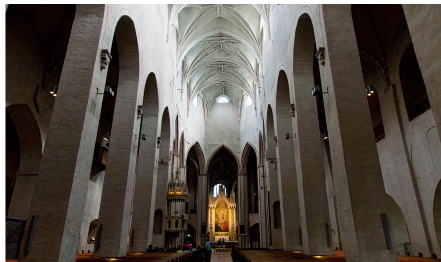
Na de stadsbrand van 1827 is het interieur van de Domkerk geheel gerestaureerd.

dienstdeden aan de uitgestrekte scherenkust van het land. In die hal zijn allerlei andere maritieme zaken te bekijken, zoals een uitgebreide collectie buitenboordmotoren, mijnen, geleide wapens, enz. Een bijzonder museum voor maritiem geïnteresseerden.