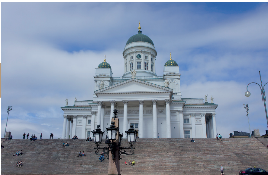
De lutherse domkerk van Helsinki.

Het oudste stenen huis van de stad, het Sederholmin talo (Sederholms huis) uit 1757, staat op de hoek van de Aleksanterinkatu en Katariinankatu, op de zuidoostelijke hoek van het Senaatsplein. Hier organiseert het Helsinki City Museum tijdelijke tentoonstellingen.