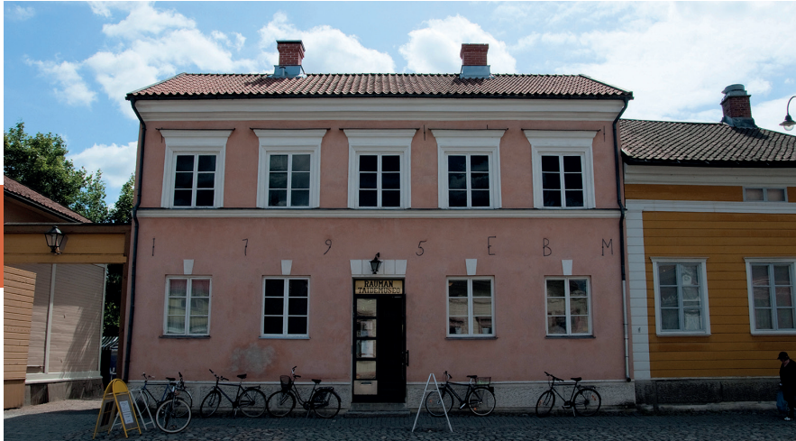
Het kunstmuseum in Vanha Rauma.

prooi aan de vlammen, in 1640 en 1682, maar het oude centrum bestaat nog steeds uit houten huizen en laat zien hoe groot de stad in 1809 was. Rauma was van belang vanwege zijn vloot van zeilschepen, de grootste van Finland, waarmee vooral handel werd gedreven op Duitsland, Stockholm en de Baltische landen. De oude kloosterkerk is nog steeds in gebruik.