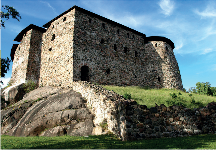
De ruïne van Raseborg.