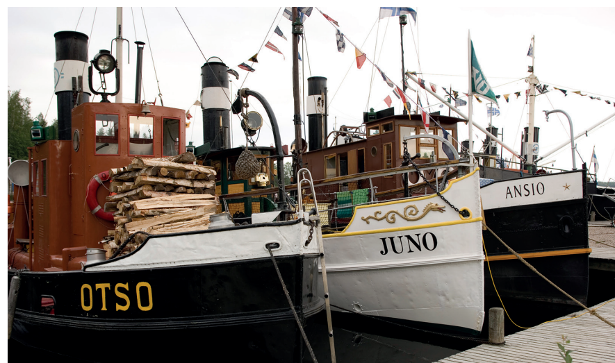
Oude stoomschepen bevaren nog steeds het Saimaameer.

Een bekende bezienswaardigheid van Nurmes is het Bomba-huis zo'n 2 km ten zuiden van het centrum. Het staat in een gereconstrueerd Karelish dorp, dat werd gebouwd in 1976-1981. Het is een replica van het drie verdiepingen hoge huis van Jegor Bombin, die daar in de 19de eeuw met zijn 24-koppige gezin in woonde. In het hoofdgebouw is een restaurant gevestigd, in de andere huizen kunnen toeristen overnachten. De omgeving wordt echter nogal gedomineerd door het naastgelegen, moderne spa-hotel Sokos Hotel Bomba aan de oevers van het meer Pielinen.