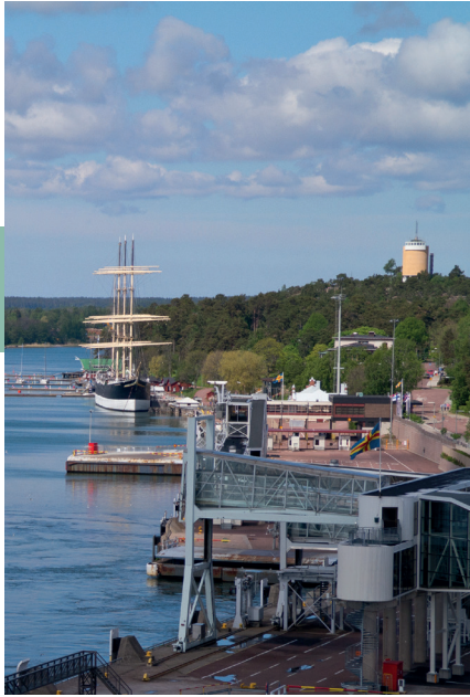
De haven van Mariehamn met de Pommern .

Sinds mensenheugenis wordt er al Zweeds gesproken op de eilanden en tot 1809 waren de Åland-eilanden een vrij zelfstandig onderdeel van het koninkrijk Zweden. In dat jaar moest Zweden Finland, inclusief Åland, echter afstaan aan Rusland. Zo werd Åland dus een deel van het grootvorstendom Finland binnen het Russische Rijk.