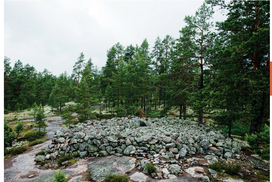
De 'kerkvloer' van Sammallahdenmäki.

Puurijärvi-Isosuo werd opgericht in 1993 en beslaat 27 km 2 . Het gebied bestaat hoofdzakelijk uit grote moerasgebieden en het Puurijärvimeer . De oevers van Kokemäenjoki zijn nog geheel in natuurlijke staat en kennen een hoge biodiversiteit, met vogelsoorten als visarend, zeearend, veel steltlopers