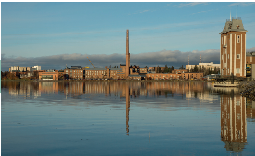
Industrieel erfgoed in Vasa/Vaasa.

is met al die marktstalletjes. Ook in het grote winkelcentrum Rewell vind je veel winkels. Op het plein staat het vrijheidsmonument dat aan de strijd voor de zelfstandigheid van Finland in 1918 herinnert. Niet ver daarvan staat de neogotische kerk van Vaasa, die in 1862 werd gebouwd naar ontwerp van Carl Axel Setterberg. Deze architect heeft overigens ook het stratenplan en het gerechtsgebouw ontworpen. Naast de kerk staat de beeldengroep De loods van de beeldhouwer Wäinö Aaltonen. In de gevel van het stadhuis tegenover de beeldengroep zie je twee medaillons, waarvan er een de stichter van de stad eert, Karl IX, en de ander de twee eerste presidenten van Finland, P.E. Svinhufvud en C.G. Mannerheim.