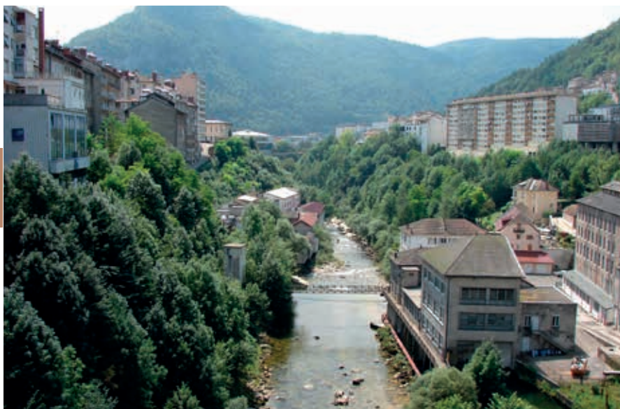
Saint-Claude is gebouwd boven de diepe kloven van de Bienne en de Tacon.

meer werd, zoals aan zoveel meren, een abdij gesticht, waaraan het meer – het Lac d'Abbaye – en de plaats – Abbaye-en-Grandvaux – hun naam ontleenen. Van de in 1170 gebouwde abdij overleefden de fraaie Notre-Damekerk en enkele bijgebouwen de eeuwen.