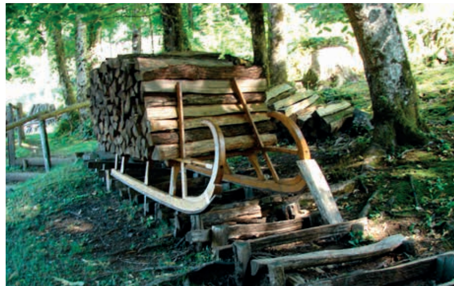
De houtslee waarmee schliteurs brandhout uit de bergen naar het dorp brachten.

Het noordoosten van het departement Haute-Saône wordt wel het Plateau des Mille Étangs genoemd. In feite zijn er zelfs nog veel meer dan 1000 meren. Het landschap is hier een grote gatenkaas. Overal liggen meren – of liever meertjes, ze zijn maar zo'n 2 ha groot. Een deel ervan is het re-