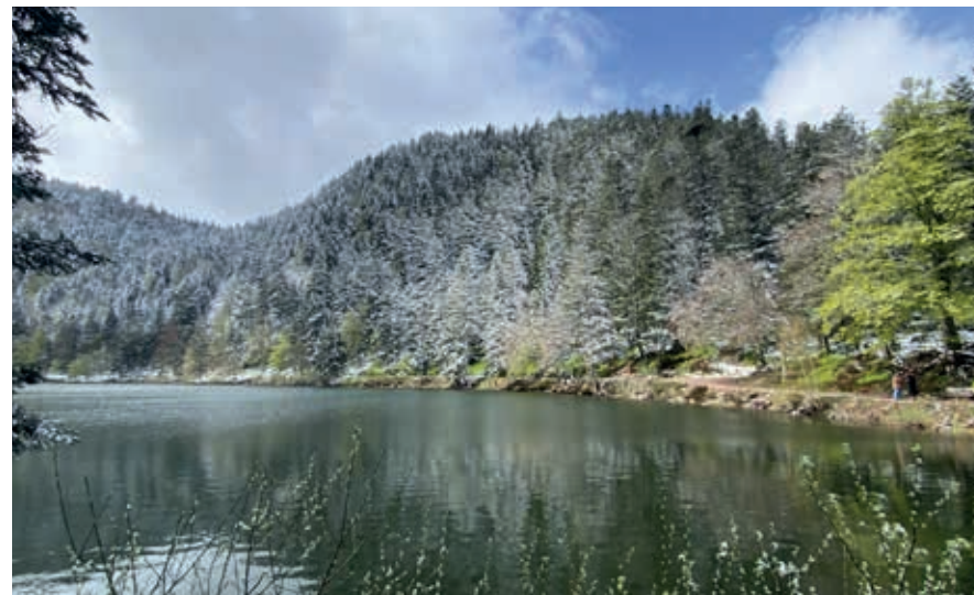
Lac des Corbeaux, over de weg bereikbaar vanuit La Bresse. Of kies voor een wandeling.

Ongeveer 600 miljoen jaar geleden lag hier een uitgestrekt, met woud bedekt massief, op een ondergrond van harde steensoorten als graniet en gneis. Het stijgen van de zeespiegel zorgde ervoor dat het gebied in een moerasland veranderde. In de ijstijden raakte het gebied bedekt met gletsjers, die op eigen wijze na het stijgen van de temperatuur brede valleien uitschuurden en rotsen afrondden. Op die plaatsen komen de uit kristallen opgebouwde steensoorten als graniet en gneis aan de oppervlakte, met af en toe lagen van de grès des Vosges , de hier karakteristieke rozerode zandsteen. De gletsjers kwamen ongeveer zo ver zuidelijk als de huidige vallei van de Bruche. Het zuiden daarvan had en heeft de hoogste toppen, zoals de Col de la Schlucht,