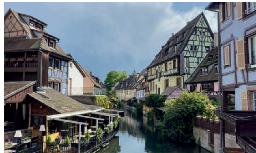
Het riviertje de Lauch vormt een toeristisch lint door Colmar en de volop aangeboden boottochtjes geven een bijzonder perspectief op de oude stad.

Langs de oostgrens stonden in de 17de eeuw versterkte steden en forten. Ten oosten van Colmar was Breisach zo'n versterkte stad. Dat werd echter bij de Vrede van Rijswijk (1697) aan de Pruisen toegekend, waardoor een gat in de Franse verdedigingslinie ontstond. Lodewijk XIV gaf zijn bouwmeester Vauban de opdracht het gat te dichten in de vorm van het vestingstadje Neuf-Brisach, dat net westwaarts van het oude Breisach lag, aan de overzijde van de Rijn. Het werd gebouwd in de periode 1699–1703 en gold als