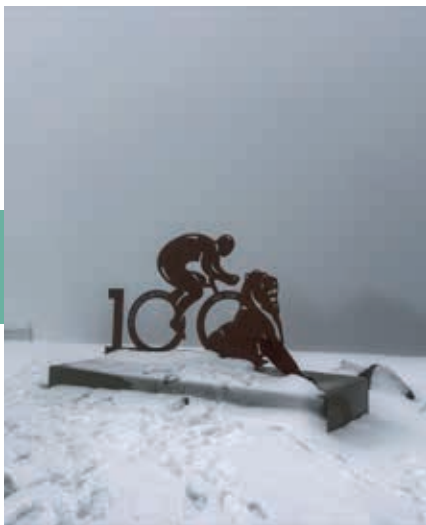
De Ballon d'Alsace ligt op de grens van het Territoire de Belfort en de Haut-Rhin.

tentoongesteld. Het huidige aanbod is breed; voorwerpen uit de Gallo-Romeinse tijd, een mooie religieuze afdeling, een muntenverzameling en schilderijen van Georges de La Tour, Claude Gellée (bijgenaamd Le Lorrain, zie kader p. 107) en zelfs een Rembrandt: de Mater Dolorosa . De afgelopen jaren is van moderne kunst een speerpunt gemaakt en zijn popart, minimal art, nieuw realisme en landart sterk vertegenwoordigd. De oudste delen van Épinal bevinden zich rond de Place des Vosges, aan de overzijde van de Moezel.