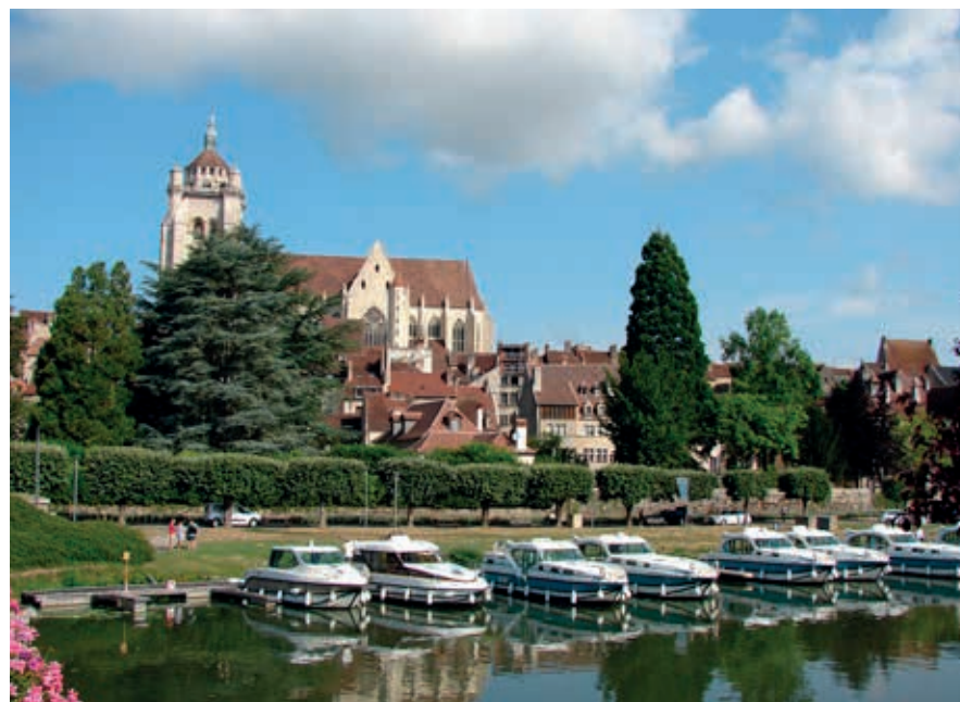
De jachthaven van Dole met op de achtergrond de Collégiale Notre-Dame.

Pasteur was niet de uitvinder van vaccinaties, maar hij ontwikkelde vaccins tegen dierenziekten, waaronder hondsdolheid. In de zomer van 1885 werd de 9-jarige Elzasser Joseph Meister bij Pasteur gebracht omdat hij door een hondsdolle hond gebeten was. De jongen moest snel behandeld worden, anders zou hij sterven. Pasteur had nog geen definitief vaccin, maar entte de jongen toch in; eerst met door hondsdolheid besmet konijnenbeenmerg dat al twee weken te drogen lag en uiteindelijk met besmet merg van één dag oud. De jongen bouwde weerstand op tegen het virus en genas. Even later werd dezelfde methode met succes toegepast op een jongen uit de Jura, Jean-Baptiste Jupille. Pasteur vestigde hiermee zijn reputatie definitief en in 1888 werd in Parijs het Instituut Pasteur opgericht.