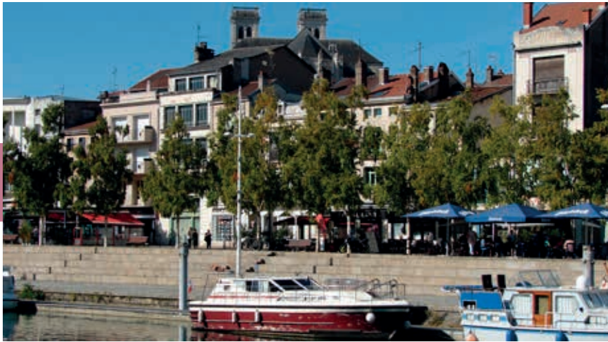
De Quai de Londres aan de Maas in Verdun. De torentjes van de kathedraal in de bovenstad steken nog net boven de bebouwing uit.

Na de Dertigjarige Oorlog kregen Lotharingen en Nancy onder hertog Leopold hun onafhankelijkheid terug. Leopolds zoon Frans trouwde met Maria Theresia van Oostenrijk en werd keizer van het Heilige Roomse Rijk; van Lotharingen zag hij af. Lodewijk XV riep in 1737 zijn schoonvader Stanisław Leszczyński uit tot hertog van Lotharingen. Bij het overlijden van Leszczyński in 1766 werd Lotharingen aan het Franse koninkrijk toegevoegd.