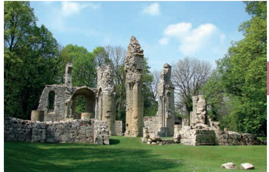
Achter het Amerikaanse monument staan nog de resten van de kerk van Montfaucon.

Het Fort de Vaux is een kleine versie van het fort van Douaumont, maar met een dramatisch verschil: hier hebben daadwerkelijk gevechten plaatsgevonden tussen Fransen en Duitsers. De Fransen moesten zich na een maandenlange strijd, waarbij ook gas werd ingezet, uiteindelijk overgeven door gebrek aan voedsel en drinkwater. In november 1916 heroverden de Fransen het fort. De galmende gangen en ruimtes met stapelbedden zijn toegankelijk. De Argonne is het gebied ten noordwesten van Verdun. Het is bosrijk met steile hellingen. Hier begon de aanval al in de herfst van 1914. Het gebied