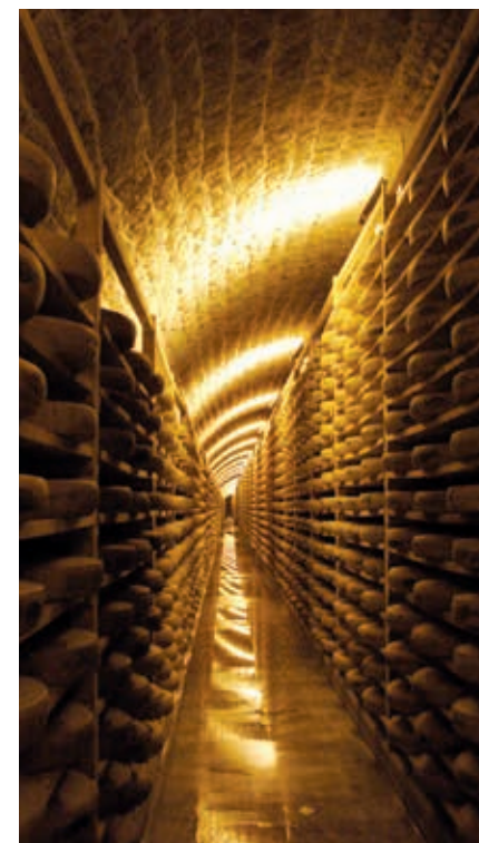
Het Fort des Rousses wordt onder andere gebruikt om comté te laten rijpen.

In en rond Les Rousses draait alles om sport. 's Winters wordt er geskied (1120–1680 m) – het skigebied loopt door tot in Zwitserland – en geschaatst op het Lac des Rousses (90 ha). De hele zomer is de kunstijsbaan van Prémamanon geopend. 's Zomers wordt er druk gemountainbiket op de 180 km aan routes en gewandeld, al dan niet onder begeleiding. Bovendien zijn er ook nog twee 18-holesgolfbanen en het meer is perfect om te zwemmen, te zeilen en te vissen.