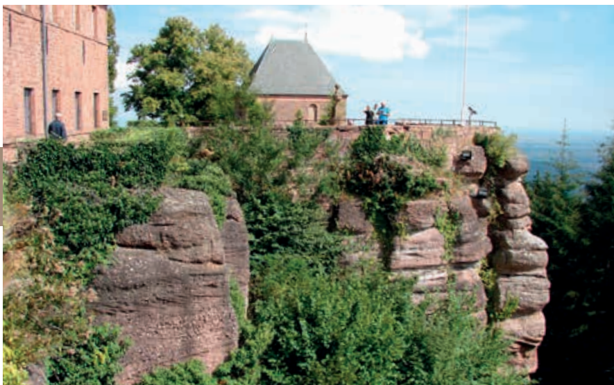
Het hooggelegen bedevaartsoord Mont Sainte-Odile.