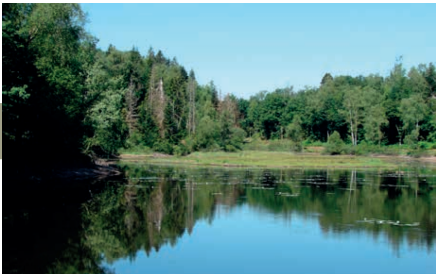
Een van de 1000 meren aan de voet van de Vogezen.

Piano slaagde erin een gebouw te maken dat vanuit de kapel niet zichtbaar is. Ook de parkeerplaats en het nieuwe entreegebouw zijn in het groen geïntegreerd. De buitenkant van de kapel is inmiddels grotendeels gerestaureerd. De werkzaamheden aan de binnenkant worden op z'n vroegst in 2025 afgerond. Bezoek blijft mogelijk.