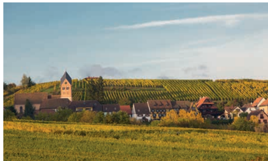
Avondlicht over Nothalten, dat zijn met wijnranken beklede heuvels deelt met het naburige Itterswiller.

Een veel bezochte, vrij grote en levendige plaats in deze streek is Obernai. Niet alleen zijn er toeristenwinkels met ooievaars, ansichtkaarten en aardewerk, maar het is er ook leuk om ‘gewoon’ te winkelen en te lunchen.