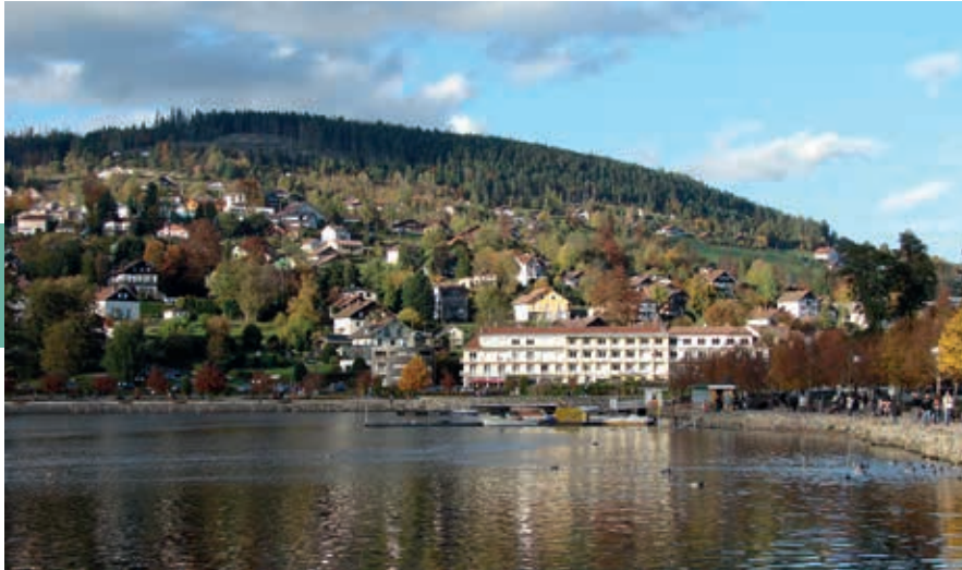
Gérardmer in oktober.