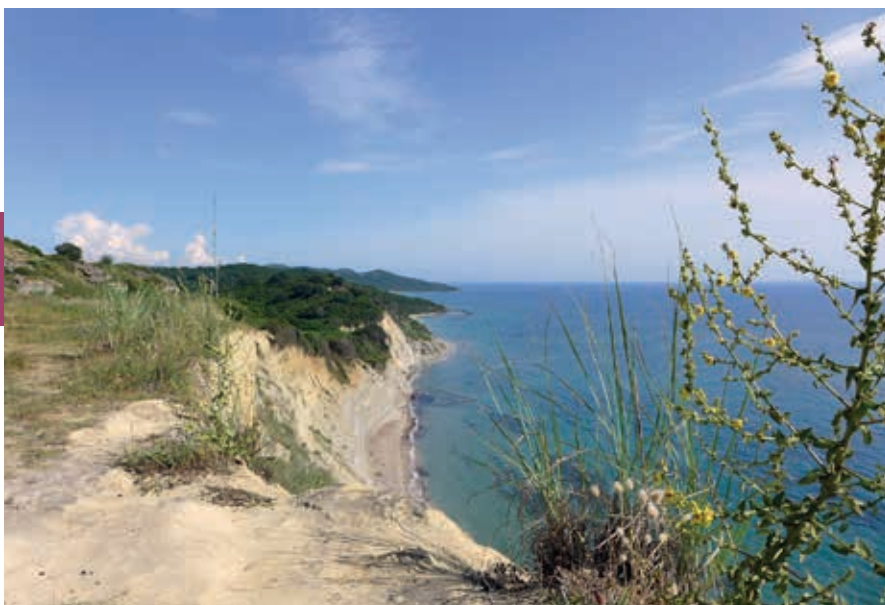
Klif bij de Kaap van Rodon, waar oeverwaluwen hun nesten maken.