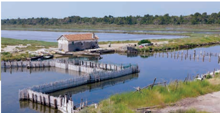
Visvangconstructie in de verbindingsstroom tussen meer en zee.