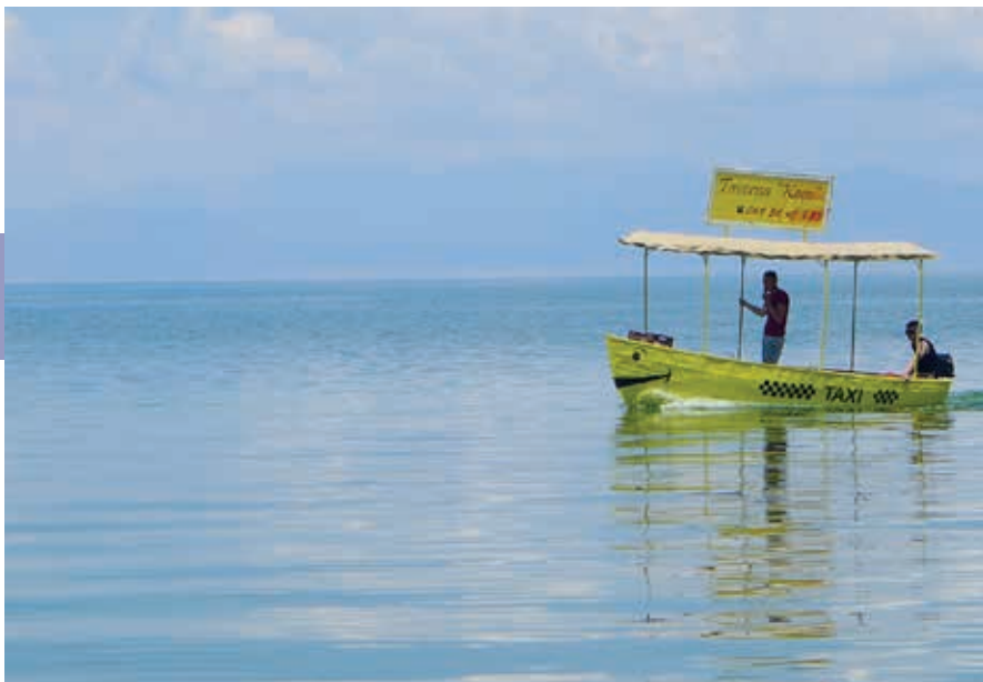
Watertaxi bij Tushemisht op het spiegelgladde Meer van Ohrid.

het meer wilt eten, de ohridforel, is het handig dit 's morgens te laten weten. Nog iets ten westen van Tushemisht ligt het weelderige en ook wat kitscherige park Drilon , waar ondergrondse bronnen opwellen en je bootjes kunt huren. Restaurant Vila Art, in dit park, was het vroegere zomerhuis van de familie Hoxha. De omgeving werd ook gebruikt als locatie voor de film Zonja nga Qyteti (De dame uit de stad, 1976), een comedy van Kinostudio, de propagandafabriek van de communisten. De film vertelt het verhaal van een niet al te elegante vrouw met stadse fratsen, die zich na enig verzet overgeeft aan de charmes van het pure leven op het land. De film is integraal op YouTube te zien en je staat er versteld van hoe vrolijk en opgeruimd alles oogt, ook al waren de donkerste jaren van het regime in aantocht.