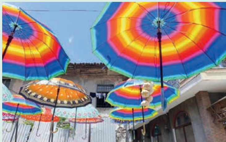
Versiering in de oude stad van Elbasan.