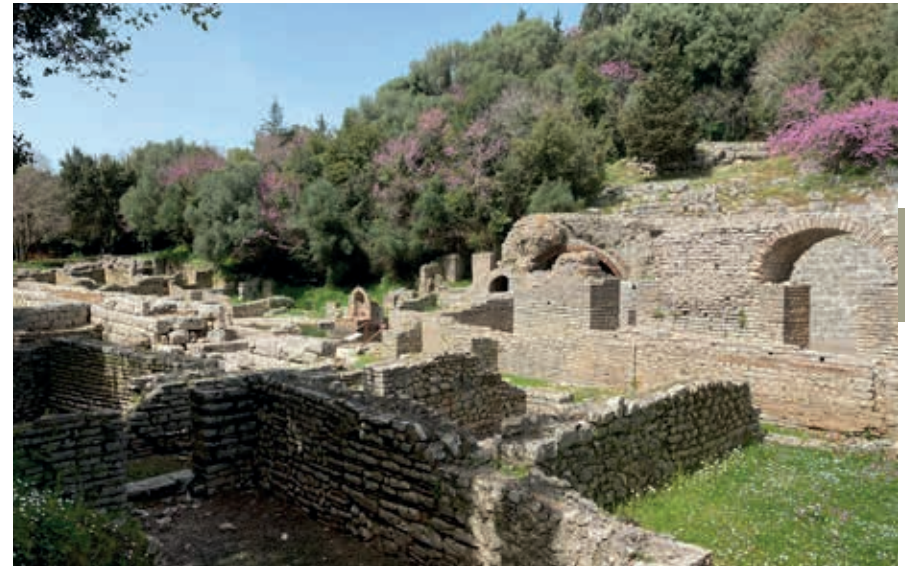
Deel van het oude centrum van Butrint waar aan Asklepios, de god van de geneeskunde, geofferd werd.

Vanaf de 7de eeuw werd de vesting Butrint vooral als verdedigingswerk gebruikt door achtereenvolgende heersers. In 1386 kochten de Venetianen het schiereiland samen met Korfoe. Zij bouwden onder meer de toren die de ingang van de site markeert. Aan de andere kant van het kanaal vanaf deze plek ligt het Venetiaanse Kasteel , een driehoekige structuur met kolossale, taps toelopende muren en twee torens met schietgaten. Je kunt met