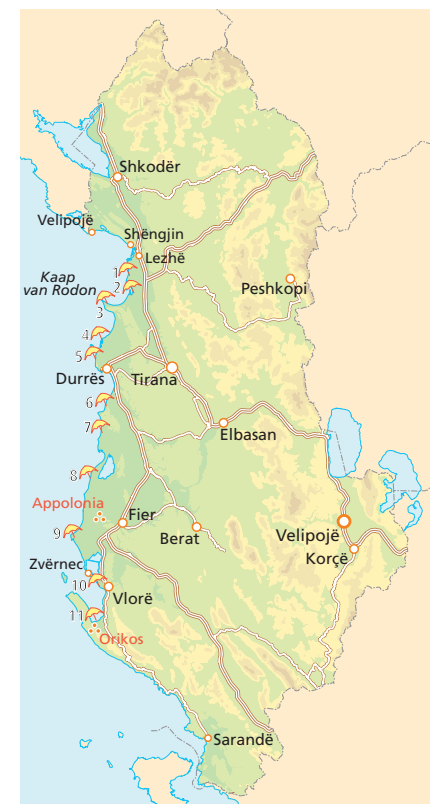
De stilste stranden boven de Riviera

9 Darzez , ten westen van Fier, een ruig en stil strand met een aantal voorzieningen. Ga vanaf de SH94 via Fushë 10 km over een wat ruige weg.