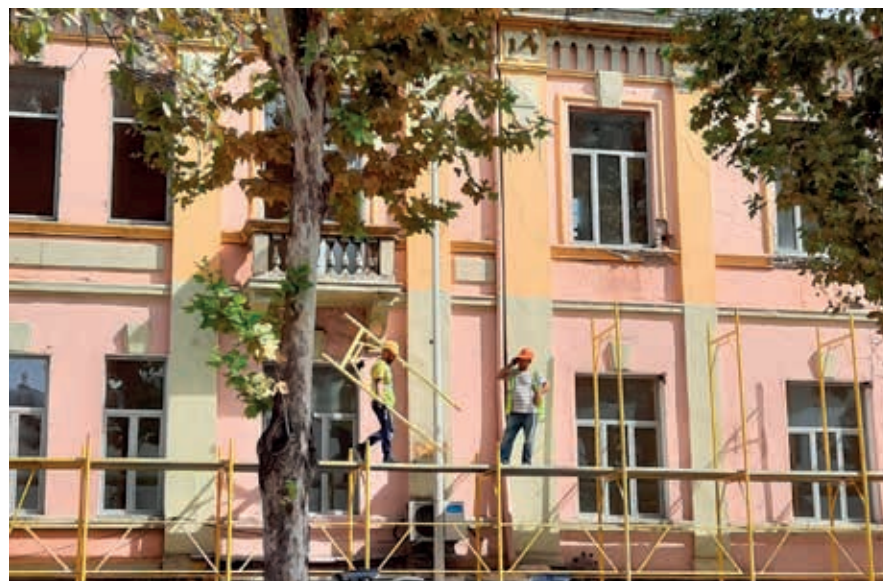
Restauratiewerkzaamheden in de Rruga George W. Bush.

Aan het andere eind van de promenade, waar cafés, bars, ijssalons en restaurants schouder aan schouder staan, vind je de Nationale Kunstgalerie . Het museum, dat werd geopend in 1956 en van 2021 tot waarschijnlijk ergens in 2024 gesloten is voor renovatie, toont in een moderne en opvallend