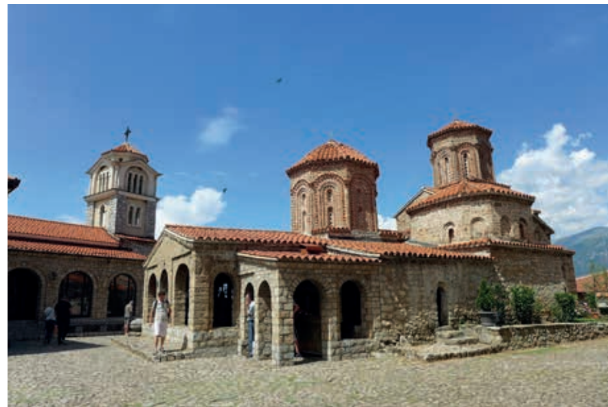
Het orthodoxe klooster van Sveti Naum, net over de grens met Noord-Macedonië aan het Meer van Ohrid.

Vorbij Tushemisht, enkele kilometers over de grens met Noord-Macedonië, kom je via een flinke parkeerplaats binnen de muren van het grote orthodoxe klooster van Sveti Naum . De heilig verklaarde naamgever, die in de 9de eeuw geboren werd, leefde bij het Meer van Ohrid, dat toen behoorde tot het Bulgaarse Rijk. Hij werkte aan het vertalen van de Bijbel in het oud-Slavisch en had met de ontwikkeling van het cyrillische schrift en het literatuuronderwijs een grote rol in het versterken van de Bulgaarse identiteit. In 905 stichtte hij het klooster, waar hij nu begraven ligt in het prachtige kerkje dat het hart van het complex vormt en dat van onder tot boven met donker