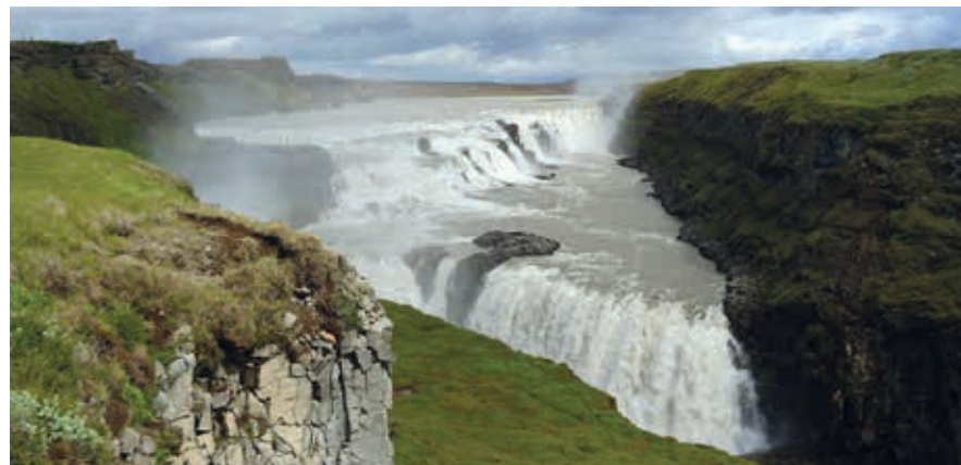
De gouden waterval Gullfoss.

krachtcentrale te bouwen, liep zij stad en land af om deze plannen tegen te houden. Zij dreigde zelfs zichzelf in de waterval te werpen als de waterval verkocht zou worden. Dat is uiteindelijk – weliswaar om andere redenen dan Sigríðurs dreigement – niet gebeurd. Sigríður ligt in het Haukadalur (bij Geysir) begraven; het informatiecentrum draagt haar naam. De waterval is inmiddels staats eigendom en tot beschermd natuurgebied verklaard. Vanaf de onderste parkeerplaats is het 5 minuten lopen naar de waterval.