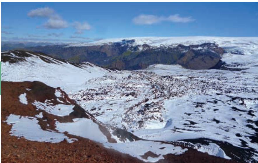
De beklimming van Fimmvörðuháls levert spectaculaire vergezichten op.

boze), naar de zonen van Þór. Het verse lavaveld is Góðahraun genoemd. Hoewel de gletsjers Eyjafjallajökull en de Mýrdalsjökull elkaar niet raken, ligt hier soms zo veel sneeuw dat het net lijkt of ze met elkaar verbonden zijn. Op de pas Fimmvörðuháls (1100 m) ligt de Útivist-hut Fimmvörðuskáli (1080 m; N63°37.32 W19°27.10). Hij ligt op het hoogste punt van de pas. Het traject door sneeuw, as en sintels is af en toe zwaar, maar ongelooflijk indrukwekkend.