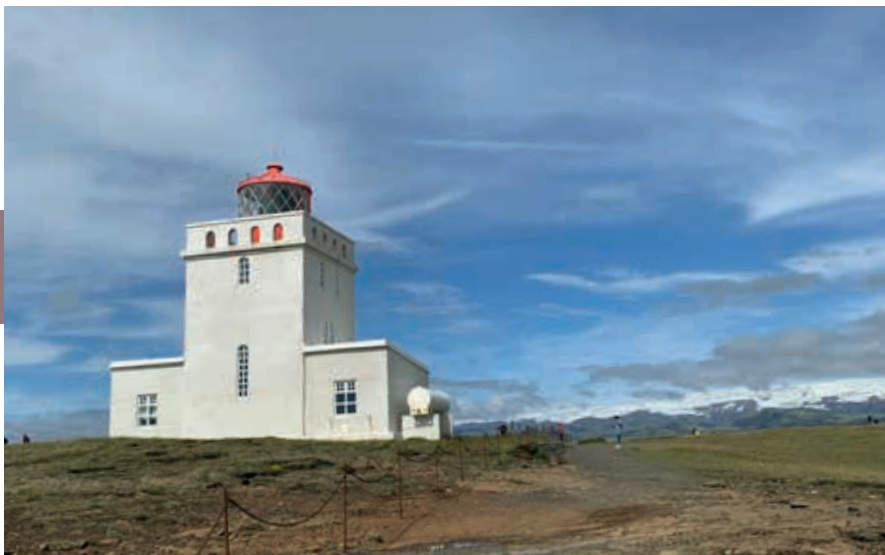
De vuurtoren bij Dyrhólaey – letterlijk vertaald: het eiland met het deurgat.