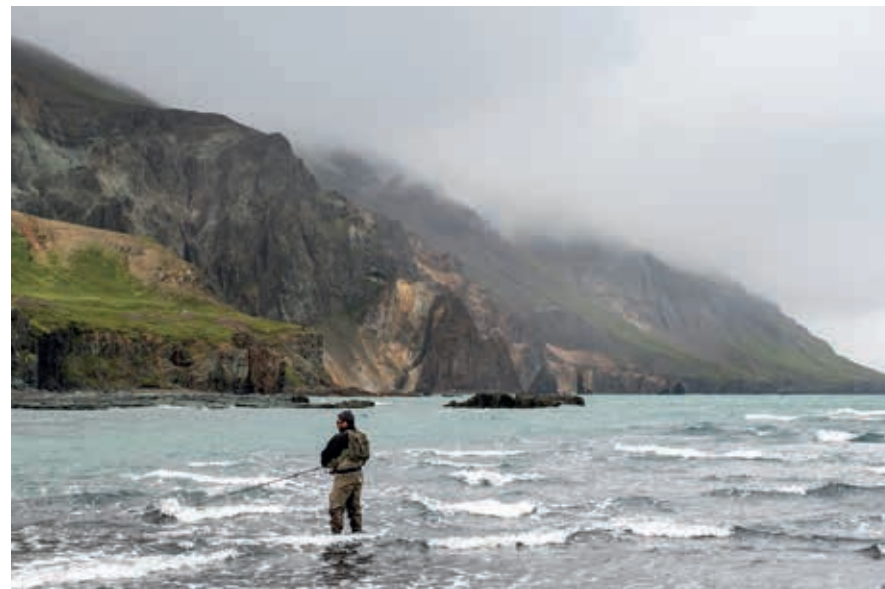
Sportvissen in Héraðsflói.

Lees nu verder op p. 222 om vanuit de Melrakkaslétta in Mývatn uit te komen.