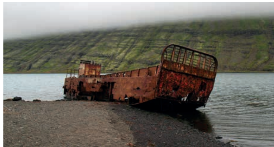
Verlaten scheepswrak in Mjóifjörður. Een rustplaats voor een oud Amerikaans landingsvaartuig, aan het eind van de wereld en aan het eind van een reis. Al 70 jaar is het overgeleverd aan de elementen.

Helgustaðir (weg 954) is de naam van een boerderij en een oude dubbelspaatgroeve. Dubbelspaat geeft een dubbele breking van het licht, waardoor je alles wat je onder een helder stukje dubbelspaat legt dubbel ziet. Van de 17de tot in de 20ste eeuw is de mijn in werking geweest. De grootste steen die hier gedolven is, weegt 230 kilo en is te bewonderen in het British Museum te Londen. Dubbelspaat werd gebruikt voor tal van instrumenten, zoals microscopen, tot de komst van kunststof. De bekende Nederlandse geleerde Christiaan Huygens (1629-1695) heeft de werking van het licht en derhalve het dubbelspaat uitvoerig bestudeerd. De groeve, die sinds 1975 beschermd natuurgebied is, is bereikbaar via een voetpaadje dat links van de weg bij een smalle parkeerstrook bij een informatiebord 400 m na het riviertje Helgustaðaá begint (15 min. heen en terug).