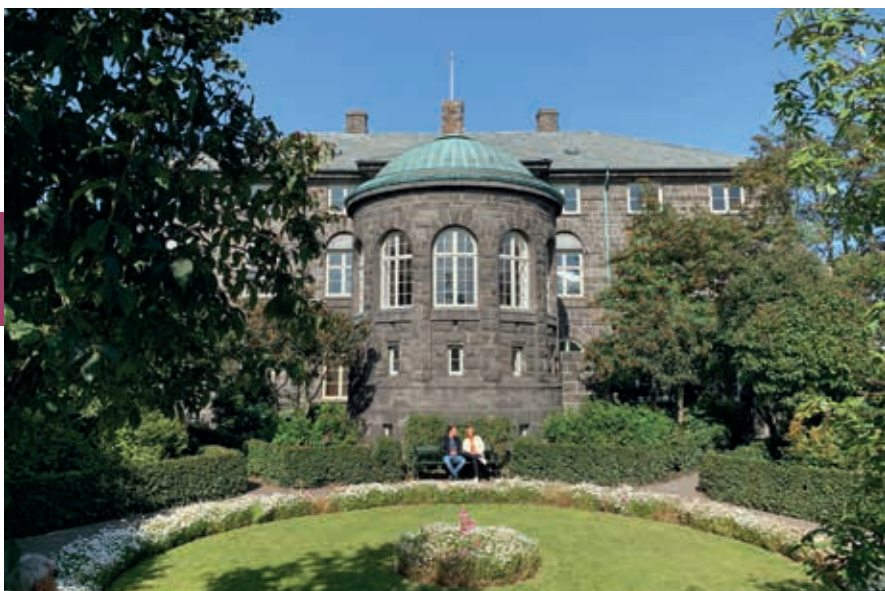
In de achtertuin van Alþingi. De helft van alle zetels in de regering wordt door vrouwen bezet, IJsland is daarmee vooruitstrevend rond de wereldwijde genderkloof.