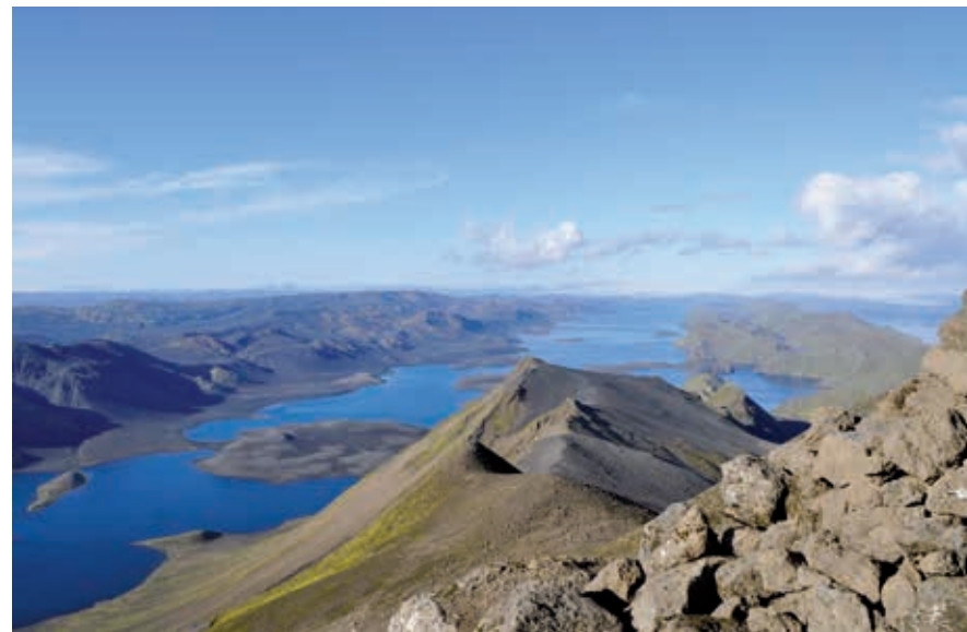
Uitzicht vanaf Sveinstindur op Langisjór.

Hier stopt de beschrijving van de wandeltocht van Landmannalaugar naar Skógar, we gaan terug naar de omgeving Landmannalaugar en de 4WD-routes in het binnenland.