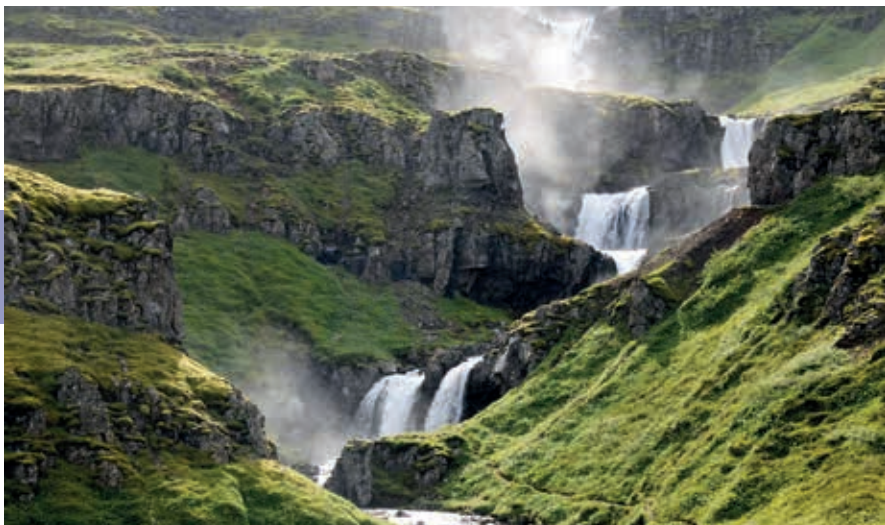
Waterval in Mjóifjörður.

Icelandic Wartime Museum ( Íslenska Stríðsarasafnið ). Vanuit Reyðarfjörður kun je een prachtige meerdaagse voettocht maken via Stuðlaheiði, het Tungudalur, Stafsheiðardalur, Þórudalur en het Áreyjardalur (tentje, eten en gps mee).