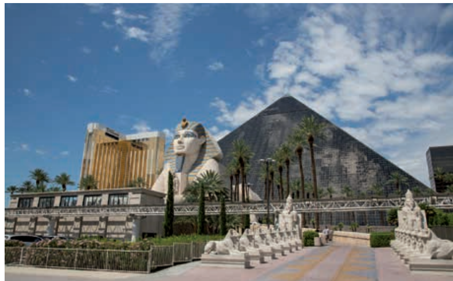
Niet ver van de woestijn misstaan de piramide en de sfinx van Luxor niet.

Het Mandalay Bay heeft ruim 3300 kamers. Een grote attractie achter het hotel vormt het Shark Reef Aquarium, waar je in een tunnel grote haaien, roggen en groene zeeschildpadden ziet. In kleinere aquaria leven koraalduivels en kleinere haaiensoorten. In zoetwaterbassins leven krokodillen en reptielen, in de Jungle leven zoetwatervissen als piranha's, een komodovaraan en een tijgerpython. Touchscreens geven achtergrondinformatie over de dieren. Aan het eind van de Strip staan The Cosmopolitan of Las Vegas en het duurste tot dusverre gebouwde complex van de stad: Resorts World Las Vegas . Dat heeft een enorm ledscherm aan een van de torens en is de eerste hotelhalte aan de door Elon Musks team ontworpen tunnel die het vliegveld met het congrescentrum zal verbinden. Reizigers worden er met Tesla's vervoerd.