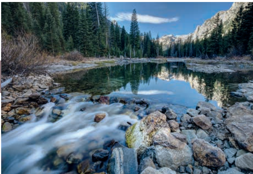
Highway 89 in Noordoost-Utah voert door een landschappelijk fraai en gevarieerd gebied.

Het vrij toegankelijke Museum of Paleontology is in 1976 opgericht om de grote toestroom van dinosauriërresten en andere fossielen een plek te geven. Het Monte L. Bean Life Science Museum, met opgezette en levende dieren (reptielen), heeft een educatieve doelstelling.