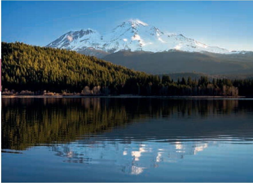
Mount Shasta (4322 m), met links Shastina, weerspiegeld in het Lake Siskiyou.