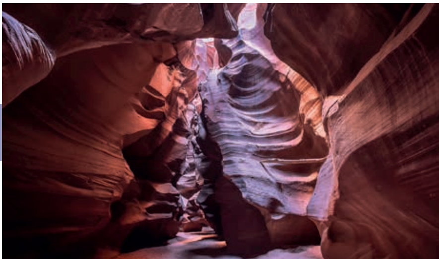
Upper Antelope Canyon.

worden genoten, tegen meerprijs kan dat vanaf een gezekeerd glijparcours (Zipline) of met helikoptertours. De Skywalk ligt in het Hualapai-grondgebied en is bereikbaar via een zijweg van Route 66 ter hoogte van Peach Springs . Op de Skywalk zelf mag niet gefotografeerd worden.