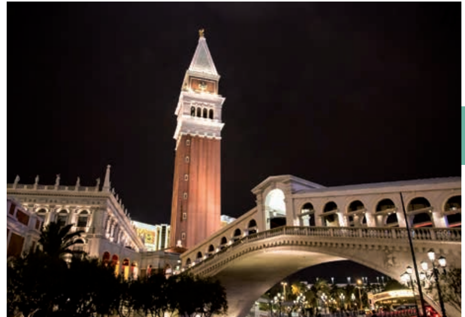
Las Vegas Venetian ademt de sfeer van Venetië.

De Romeinse keizertijd is rode raad in Caesars Palace , een eerbetoon aan het oude Rome met een Forum, waar Atlantis elk uur valt met donderend geraas van water en vuur, en een badhuis. Marmeren beelden en zuilen wedijveren met Armani en Versace om de aandacht. Het theater is hier natuurlijk een Colosseum, waar Céline Dion kind aan huis is. Tegen de verveling is er ook nog een groot zoutwataquarium en 3D-film/simulaties.