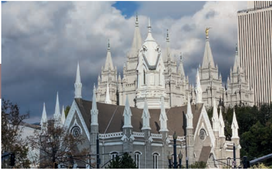
De Temple van Salt Lake City, met de engel Moroni op de oostelijke toren.