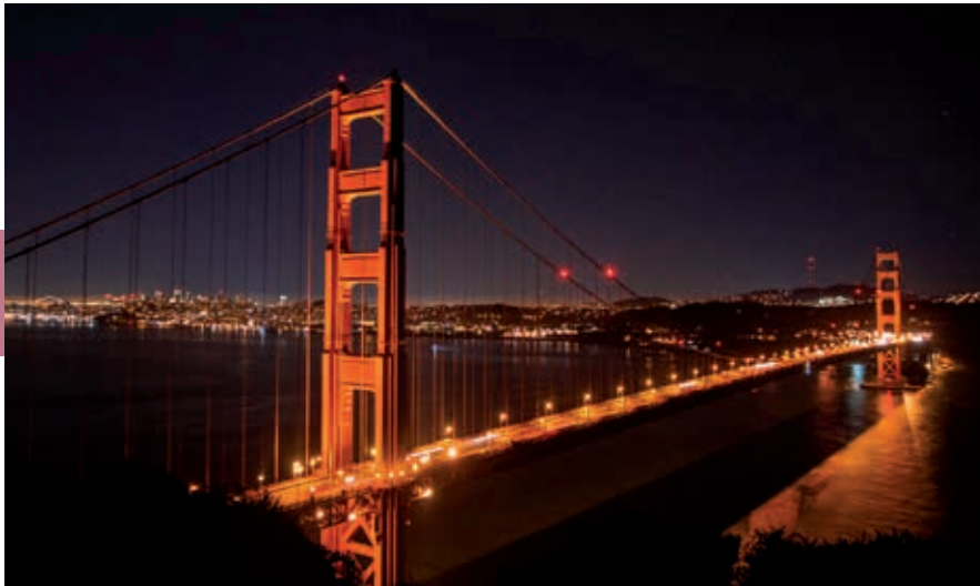
's Nachts wordt de Golden Gate Bridge prachtig verlicht.