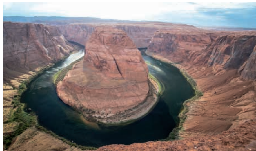
Een winderig maar spectaculair uitzichtpunt ten zuiden van Page: Horseshoe Bend.

Navajoland strekt zich ten zuidoosten van Page uit. Een bijzondere attractie vlak bij Page is de Antelope Canyon , een sterk gewelfde kloof die het resultaat is van eroderende versteende duinen. In de zomermaanden schijnt rond 11.30 uur de zon recht in de canyon, wat het tafereel een extra dimensie geeft. Antelope Canyon is alleen met door Navajo georganiseerde excursies te bezichtigen. De Lower Antelope Canyon is in beheer van broer en zus Ken en Dixie. Hier worden op zomerdagen wel 1000 bezoekers door de imposante slotkloof geleid. Dat gaat in groepen tot 15 personen, elk met een gids die heel behulpzaam is bij het fotograferen. Je daalt trappen af, loopt over de zanderige bodem en door de soms heel smalle kloof; echt lastig lopen is het nergens, maar de temperaturen – en de wachttijden – kunnen