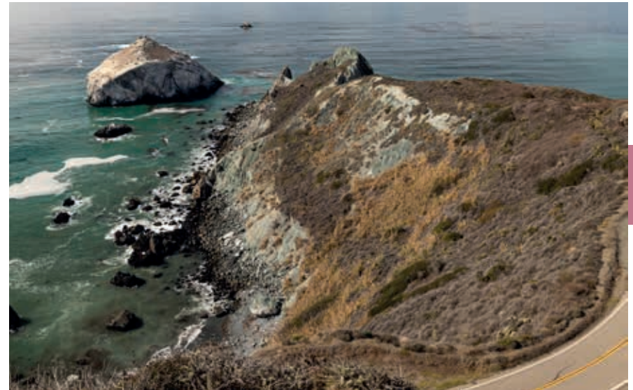
De kust van Pacific Grove.

Carmel-by-the-Sea laat Britse decors zien: een steile weg naar zee, huizen in tudorstijl en Georgiaanse panden. Maar hier rijd je met je auto tot pal