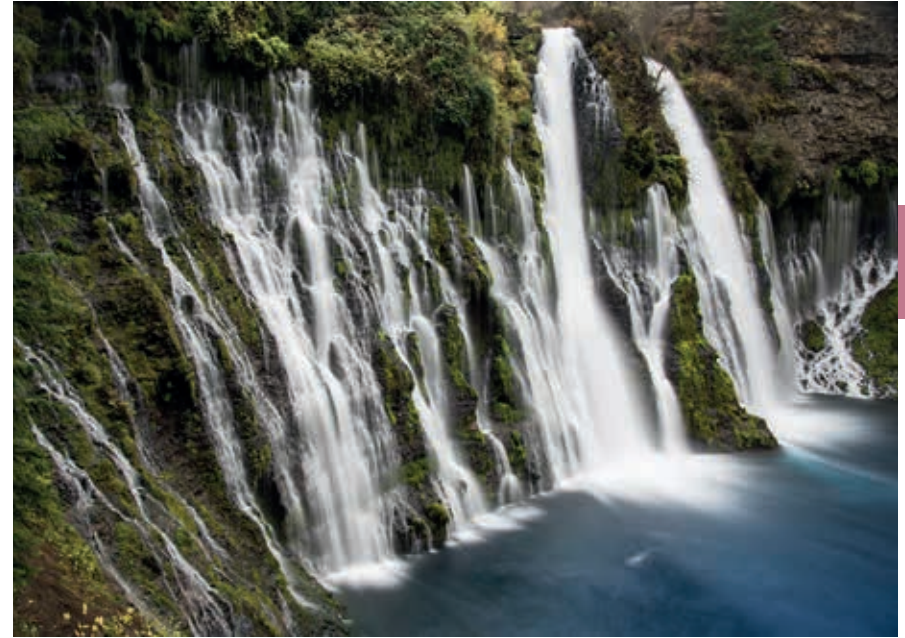
De Burney Falls zijn te zien in het McArthur-Burney Falls Memorial State Park.

Een uitgebreid wandelnetwerk, ook voor meerdaagse wandelingen en wilderniskamperen, ligt in de Trinity Alps , ten westen van Mount Shasta. Je hebt een permit nodig, verkrijgbaar bij de Ranger Stations van Weaverville, Redding en Shasta Lake (zelfregistratie). Hier hoeft nog niet maanden tevoren om permits geloot te worden, wat in veel populaire parkgebieden het geval is. Neem wel de voorzorgsmaatregelen die nodig zijn voor het lopen in berenland.