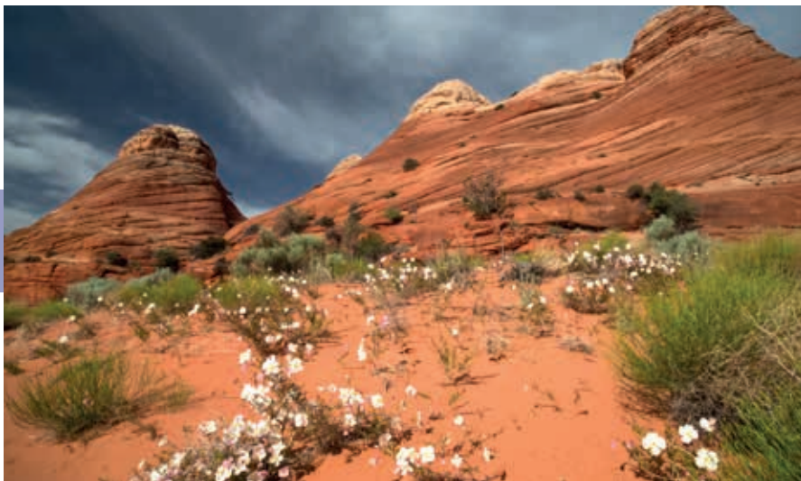
Woestijnbloemen voor fascinerende zandsteenformaties op het Colorado Plateau – het noordoosten van Arizona.