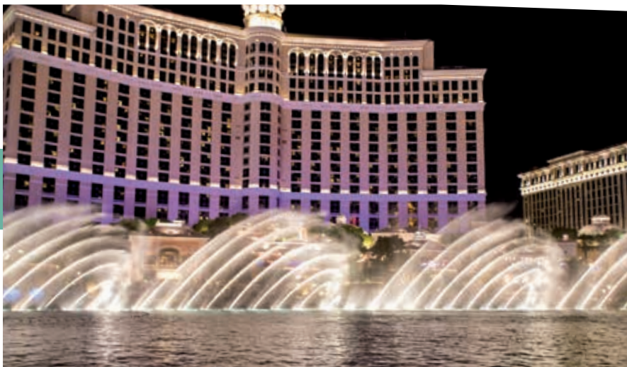
Fonteinshow voor het Bellagio; op het hoogtepunt rijst het water ruim 70 m op, maar nog altijd is het complex erachter veel hoger.

Ridders van de Ronde Tafel kom je tegen in Excalibur . Op muren, glas, maar ook tijdens toernooien, zie je koning Arthur in zijn legendarische kasteel Camelot, dat je via een ophaalbrug betreedt. In het middeleeuwse dorp lopen narren en goochelaars. Wie een dinnershow bijwoont, eet er met zijn handen.