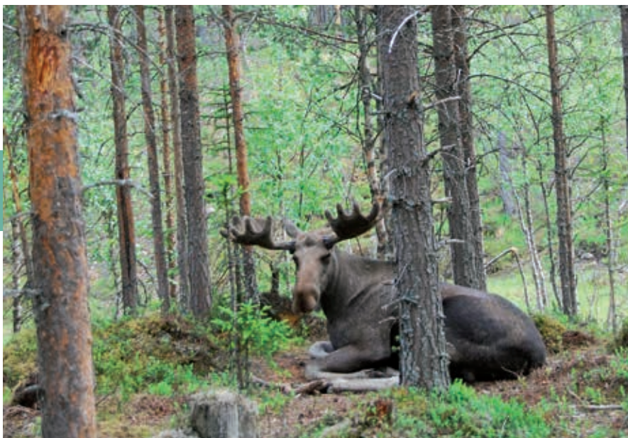
In de bossen van Telemark is de eland een vertrouwde verschijning; in de schemering vertoont hij zich vaak aan de bosrand.

hij baanbrekend werk. Norheim werd de grote grondlegger van de skisport. In Morgedal staat het Norwegian Ski Adventure Centre, waar veel te zien is van deze ontwikkelingen.