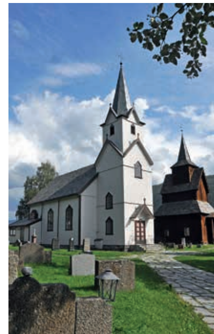
Nieuw en oud in Torpo, Valdres.