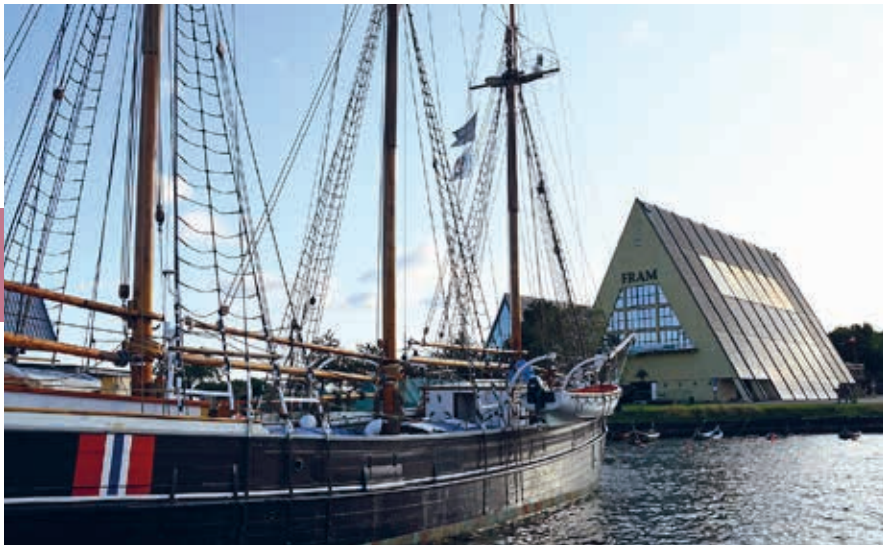
Schip aan de kade voor het Frammuseet op het museumeiland Bygdøy.

De verzameling Universitetets Kulturhistoriske Museer vertoont interessante exposities: van de steentijd tot de middeleeuwen; veel bijvoorbeeld over de tijd van de Vikingen en heiligen uit de middeleeuwen. Ook zijn er etnografische exposities van niet-westerse culturen uit onder andere Afrika, Oost-Azië en arctische gebieden.