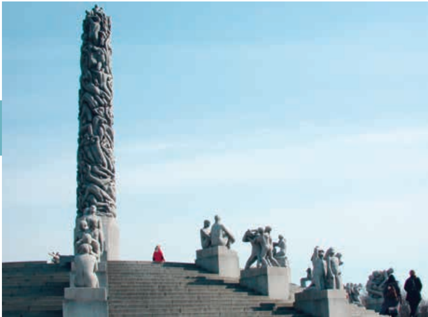
In het Vigelandpark in Oslo staat een grootse verzameling beelden en sculpturen van Gustav Vigeland.

mens op zeer natuurgetrouwe wijze vorm te geven, maar vooral ook een uitdrukking in elk van zijn menselijke schepselen te leggen. Ook de weergave van de relaties tussen mensen heeft deze kunstenaar op een bijzondere wijze vereeuwigd. Graniet en brons zijn de belangrijkste materialen die hij voor zijn uitgebreide verzameling gebruikte. Door zijn zeer aparte stijl en grote aantal werken heeft Gustav Vigeland zich ver verheven boven andere beeldhouwers. In het nabijgelegen museum zijn meer beelden te zien en vooral voorstudies in de vorm van tekeningen en gipsmodellen.