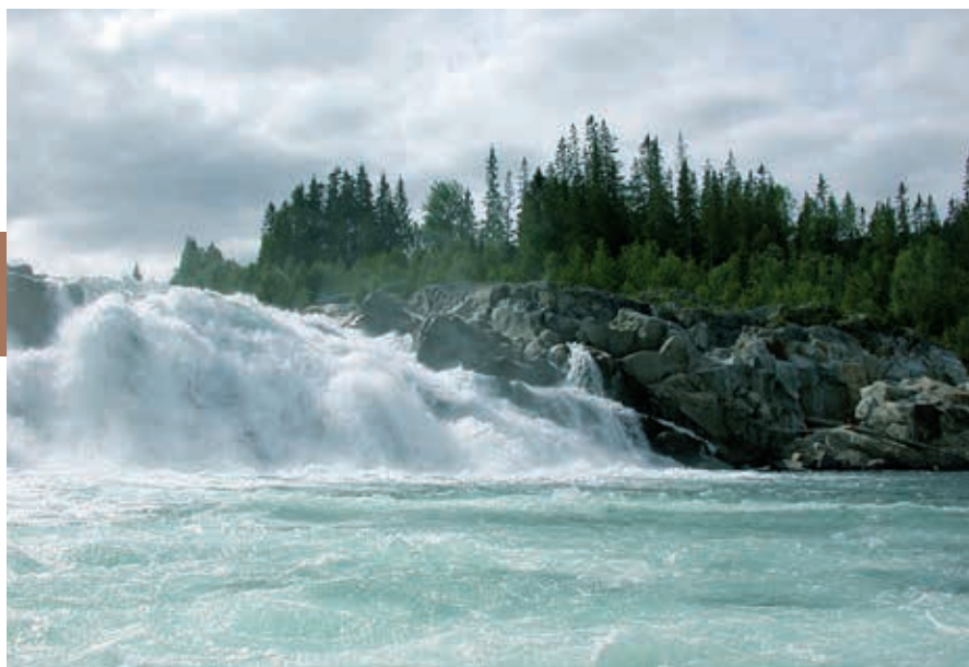
Bij Laksforsen springen de zalmen uit het opspattende water.