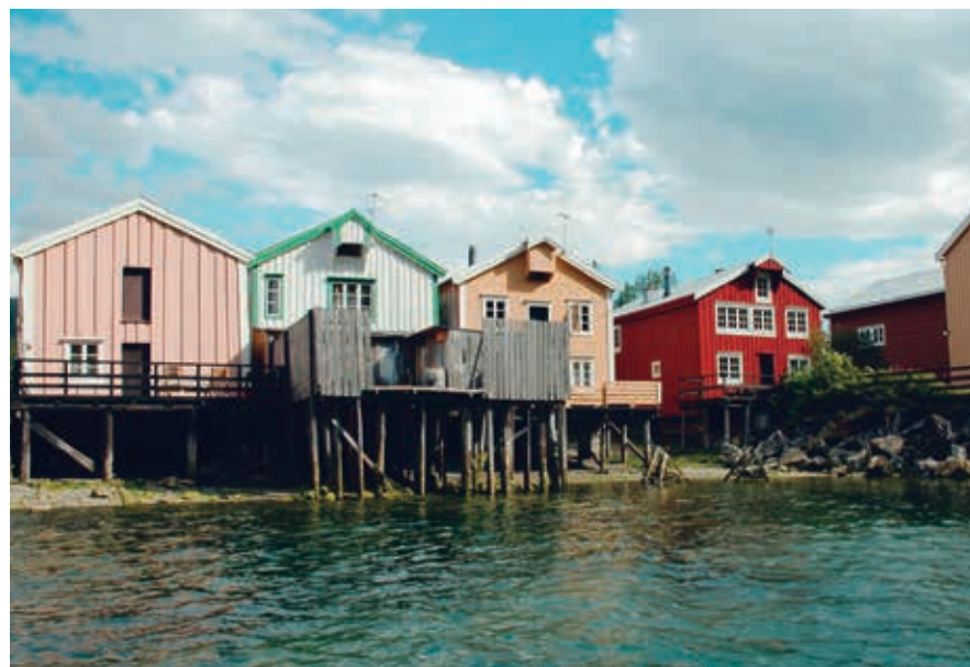
In het hartje van Mosjøen staan de huizen aan het water.

Verder naar het noorden ligt Mosjøen . Veel bezoekers denken hier al ver in het noorden te zijn, maar voor de inwoners van deze stad geldt dat ze midden in Noorwegen wonen. Met zijn 10.000 inwoners, vele winkels, oude straatjes en culturele attracties vormt deze stad een levendig centrum in de