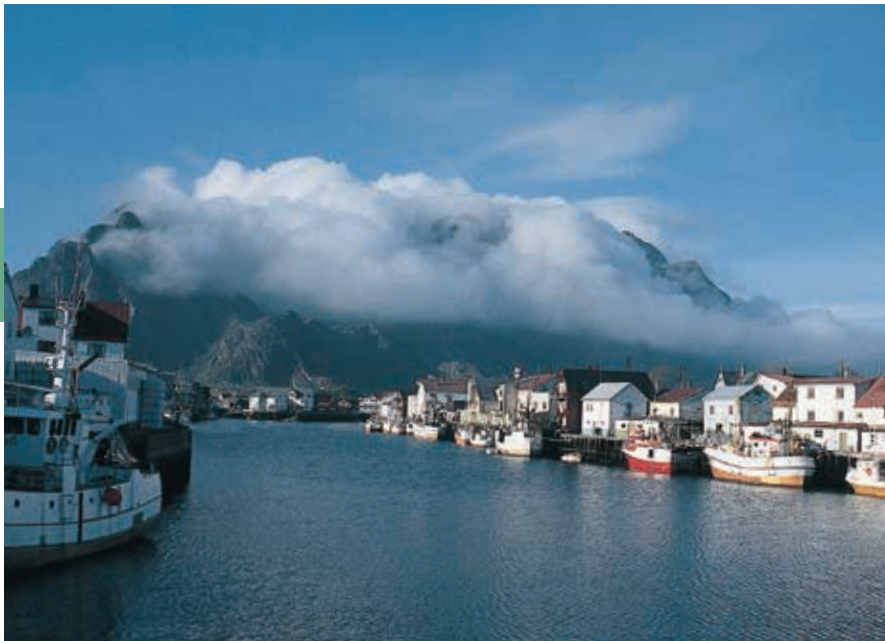
Svolvær op de Lofoten 's nachts om 24 uur.

neem bijvoorbeeld het midden in de nacht bij helder licht aankomen in een haven. Voor wie Noord-Noorwegen op een andere manier wil beleven is deze bootreis een goed alternatief om bijvoorbeeld naar Hammerfest te varen, maar ook kortere trajecten zijn mogelijk. De auto kan mee op de boot. De omgeving van Svolveer is bijzonder in trek bij Noorse en buitenlandse schilders en fotografen vanwege het licht en het landschap. De Noorse schilder Gunnar Berg (1863–1893), opgegroeid in deze omgeving, heeft hier veel geschilderd. In een galerie in Svolveer is een deel van zijn werk te zien.