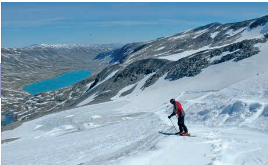
Lekker skiën in de zomer op de Strynefjell.

Vanaf Stryn is het mogelijk via rijksweg 15 de weg westwaarts te rijden naar Nordfjordeid. Hier is een centrum van fjordenpaarden. In Nordfjordeid kun je je ook laten onderdompelen in het leven van de Vikingen. Klim zelf de boot in en ervaar de echte dimensies in het Sagastadmuseum.