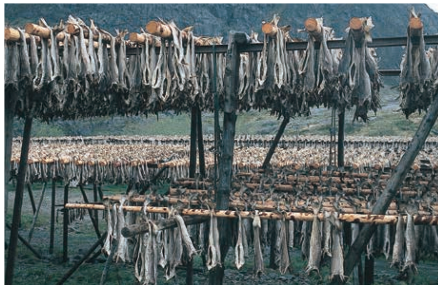
Stokvis is al eeuwen een belangrijk exportartikel voor de Lofoten.

Om op de Lofoten te komen is Bodø een goed startpunt. Hier gaat drie keer per dag een boot naar Moskenes. Na vier uur doemen de indrukwekkende rotsen op. Op diverse plaatsen steken de rotsen recht op uit de zee. Dat maakt de Lofoten tot een bijzonder gebied. In Å bijvoorbeeld: dit oude vissersplaatsje met slechts één letter is een van de beste uitgangspunten om de Lofoten te ervaren in heden en verleden. Vanaf Å is er een goed uitzicht op de oostkant van de bergen van de Lofoten. In het Norsk fiskeværsmuseum is veel te zien van de boeiende geschiedenis van het leven in deze streken. Het museum is een dorp op zich en er is alles terug te vinden van het rijke visserijverleden. De kabeljauw speelt daarin een dominerende rol. De Lofoten zijn ook bekend vanwege een speciale soort kabeljauw, de skrei , die in februari gevangen wordt. Gedroogde vis en de levertraan uit de vis waren