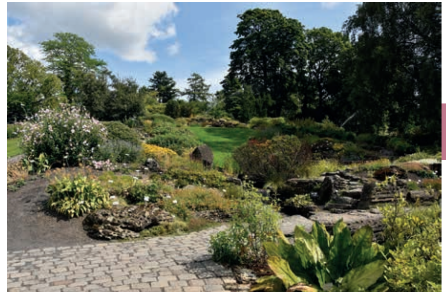
De botanische tuin: boeiend in alle seizoenen.

Akershus festning is lange tijd dé plek geweest die Oslo moest beschermen tegen invallen van buitenaf, vooral tegen de Zweden. Akershus festning is het belangrijkste overblijfsel van Oslo uit de middeleeuwen. Nabij ligt Akershus slott met een kapel waar de koningen Haakon VII en Kong Olav V liggen begraven. Verder is er ook het Norges Hjemmefrontmuseum , Forsvarsmuseum en een model van de oude stad Christiania zoals Oslo