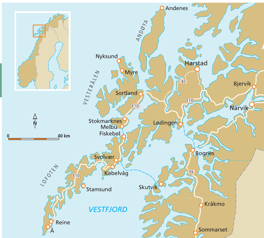
Lofoten en Vesterålen