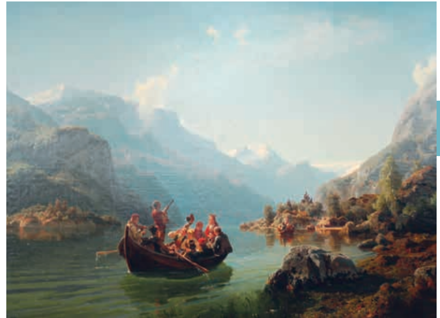
Brudeferden i Hardanger [Bruiloftsreis in Hardanger], een van de bekendste landschapsschilderingen van de hand van de grote kunstschilders Hans Gude en Adolph Tidemand.

Veel Noorse kunstschilders uitten zich vooral in landschapsschildering en portretschildering. Hoewel de kwaliteit van het schilderwerk hoog was, kende dit tot de Tweede Wereldoorlog geen internationale doorbraak. Wel hadden Noorse schilders belangstelling voor het buitenland. Een van hen was J.C. Dahl (1788–1857) uit Bergen. Zijn ouders hadden geen geld voor een kunstzinnige opleiding. Zelf wilde hij zich toeleggen op het schilderen van decoraties. In die tijd was dat een veel uitgeoefend beroep. Toen in zijn om-