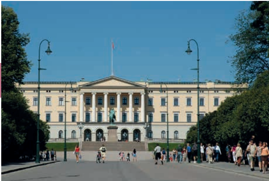
Gastvrij Noorwegen op z'n best: de tuin van het paleis loop je zo binnen.