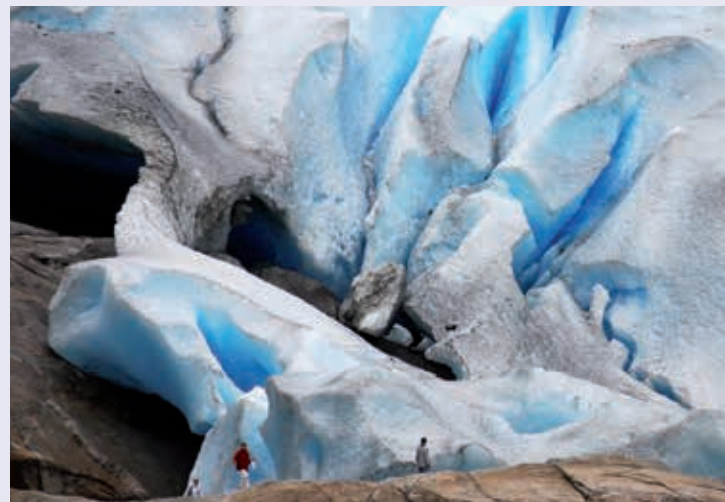
Respecteer de gevaren van bewegende gletsjers; dat doen deze mensen niet!

Op het uiterst westelijke punt van Noorwegen, in de provincie Sogn og Fjordane, liggen de plaatsen Florø en Bremanger. De gemeentegrenzen van deze plaatsen strekken zich uit van de gletsjers tot in de zee. In dit grillige gebied zijn de verschillen in landschappen groot: woeste rivieren, hoge bergtoppen en diverse grote watervlakten. Op de meest westelijke plek bij Florø liggen diverse eilanden voor de kust, die per veerboot te bereiken zijn. Florø ligt op een lange smalle landtong, aan alle kanten omgeven door water. De omgeving herinnert aan een rijk visserijverleden, maar nog steeds speelt deze plaats een belangrijke rol in de verwerking van vis.