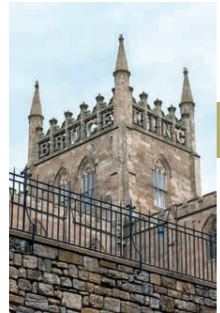
In Dunfermline Abbey zijn ze er trots op dat koning Robert the Bruce er begraven ligt.

Via Robert de Bruces dochter Marjorie kwam de Schotse troon in 1371 terecht bij het adellijke huis FitzAlan dat de erfelijke titel van High Steward of