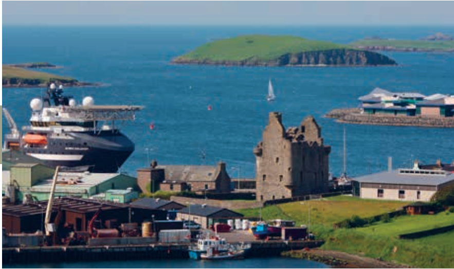
Het vissershaventje Scalloway was tot 1708 de hoofdplaats van Shetland.

Vanuit Walls en West Burrafirth varen ferry's naar de eilanden Foula en Papa Stour . Beide hebben schitterende klifkusten en prachtige natuur. Voorzieningen voor bezoekers zijn minimaal.