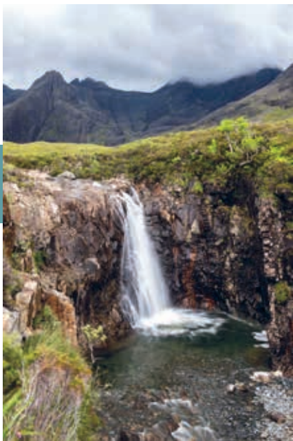
Een van de watervallen van de Fairy Pools, met op de achtergrond de Black Cuillin.

Ten westen van de Black Cuillin in de vallei van de rivier Brittle liggen de Fairy Pools , een sprookjesachtige natuurlijke ‘trap’ van watervallen en poeltjes. Vanaf de parkeerplaats langs de weg naar het gehucht Glenbrittle loopt een wandelpad ernaartoe. Vanaf de parkeerplaats zijn ook wandelroutes uitgezet in het enorme bosgebied tussen Glen Brittle en het westelijk gelegen Loch Eynort. Vanaf de Fairy Pools is het via de B8009 maar een klein stukje naar het westen voor de Talisker Distillery (malts.com).