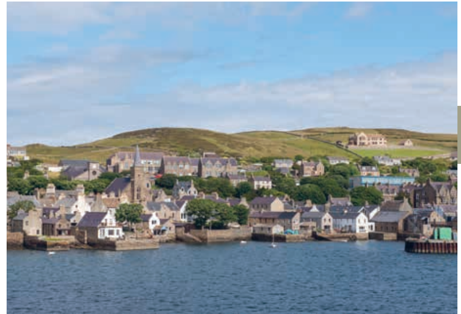
Stromness aan de beschutte Hamnavoe-baai.

De ontdekking van Noordzee-olie bracht de eilanden in de jaren 1970 veel werkgelegenheid. Verder is landbouw een belangrijke bedrijfstak, meer dan visserij: Orcadianen (zoals de eilandbewoners worden genoemd) staan bekend als boeren met boten terwijl Shetlanders worden getypeerd als vissers met een boerderijtje. Belangrijke bronnen van inkomsten zijn verder het toerisme en de juwelenindustrie. Mainland heeft de twee noordelijkste whiskydistilleer-