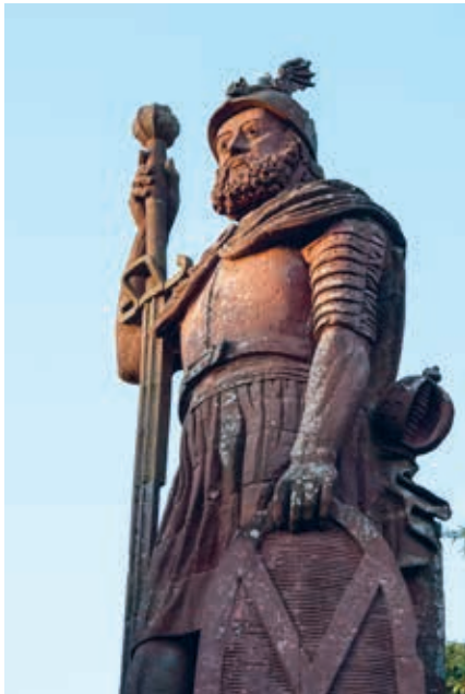
Het William Wallace Statue in de buurt van Dryburgh Abbey.

De trotse Schotten sloten vervolgens een bondgenootschap met Edwards aartsvijand Frankrijk: de Auld Alliance. Een woedende Edward richtte eerst een bloedbad aan in het dan nog Schotse Berwick en nam vervolgens koning John Balliol gevangen. Om te voorkomen dat de Schotten ooit nog een nieuwe koning konden kronen, pikte hij meteen ook de kroonjuwelen en de Stone of Scone (zie kader p. 91) in. In 1296 liet hij alle Schotse edelen trouw aan hem zweren door ze de zogenaamde Ragman Roll te laten ondertekenen. Een jaar later kwamen de Schotten alweer in verzet onder leiding van bisschop Wishart en de edellieden James Stewart en Robert the Bruce. Hun leidersmantel werd aanvankelijk weggekaapt door William Wallace, een edelman van tweede