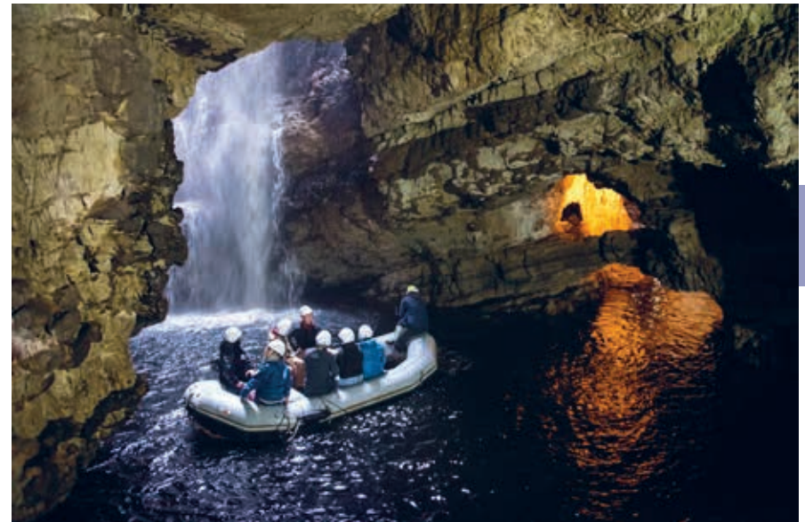
Smoo Cave kun je verkennen onder begeleiding van lokale gidsen.

► SMOO CAVE TOURS, Durness, IV27 4PN, smoocavetours.com