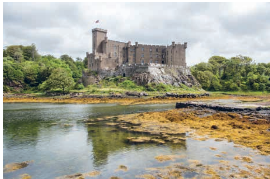
Dunvegan Castle is al 8 eeuwen de zetel van de clan Macleod.

Aan het begin van Loch Dunvegan ligt in het plaatsje Dunvegan het kleine Giant MacAskill Museum over Angus MacAskill, de grootste Schot ooit. Verder naar het noorden ligt Dunvegan Castle , de zetel van de MacLeod-clan. Het wordt al 8 eeuwen door dezelfde familie bewoond en is door de eeuwen heen verbouwd en uitgebreid in verschillende bouwstijlen. Binnen vind je prachtige stijkkamers met familieportretten van de hand van Ramsay, Raeburn en Johann Zoffany. De grootste schat van de MacLeods is de magische ‘fairy flag’ in de Drawing Room. Volgens de legende is ze een cadeau van een elf. Uit onderzoek blijkt dat het stuk zijde waarschijnlijk in de 4de eeuw geweven is en afkomstig is uit Syrië of Rodos. Andere ge-