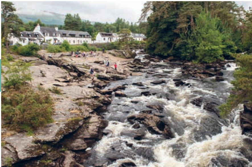
De Dochart-watervallen in het centrum van Killin.