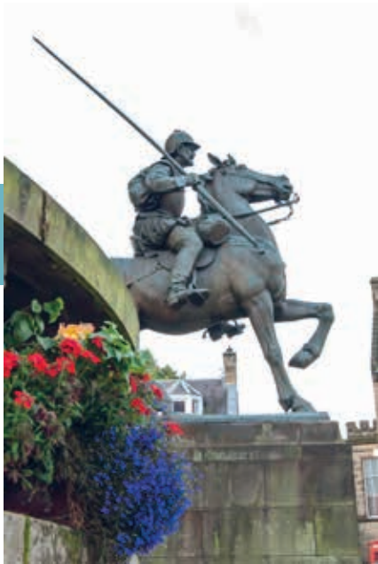
Het Reiver Monument in Galashiels.