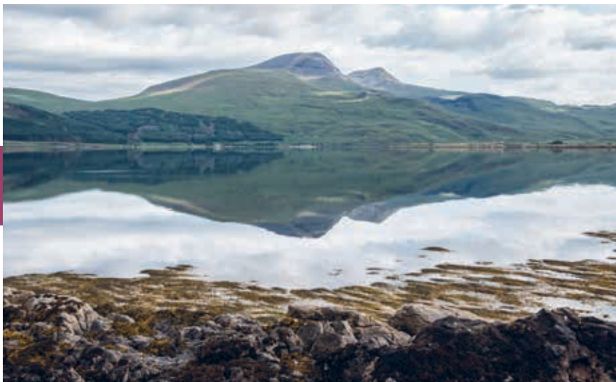
Ben More op Mull.

De Schotse whiskyindustrie groeit nog steeds en biedt aan meer dan 11.000 Schotten werk (42.000 in het hele Verenigd Koninkrijk). Het vormt met een exportopbrengst van zo'n 4,5 miljard Britse pond bijna een kwart van de totale exportopbrengsten van de Britse voedselindustrie. Whiskytoerisme en toerisme in het algemeen zijn ook een flinke inkomstenbron, zo'n 5% van het Schotse bnp.