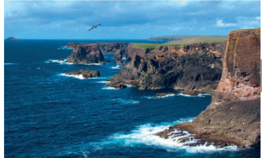
De grillige kustlijn van Esha Ness.

Vanuit Symbister kun je met een veerboot naar de Out Skerries . De twee eilanden die met een brug zijn verbonden, zijn vooral populair bij duikers