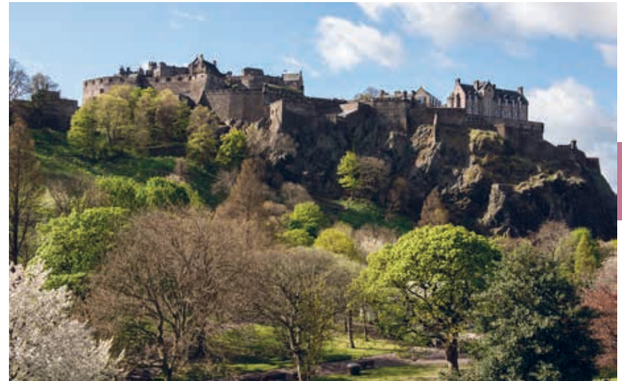
Edinburgh Castle, met op de voorgrond Princes Street Gardens.

Je bezoek aan het kasteel begint bij het poorthuis (uit 1888). Via de 16de-eeuwse Portcullis Gate , met vervaarlijk valhek, kom je bij de Argyle Battery . Vanaf hier vertrekken meerdere keren per dag introductierondeleidingen. Het 18de-eeuwse geschutsplatform van architect William Adam