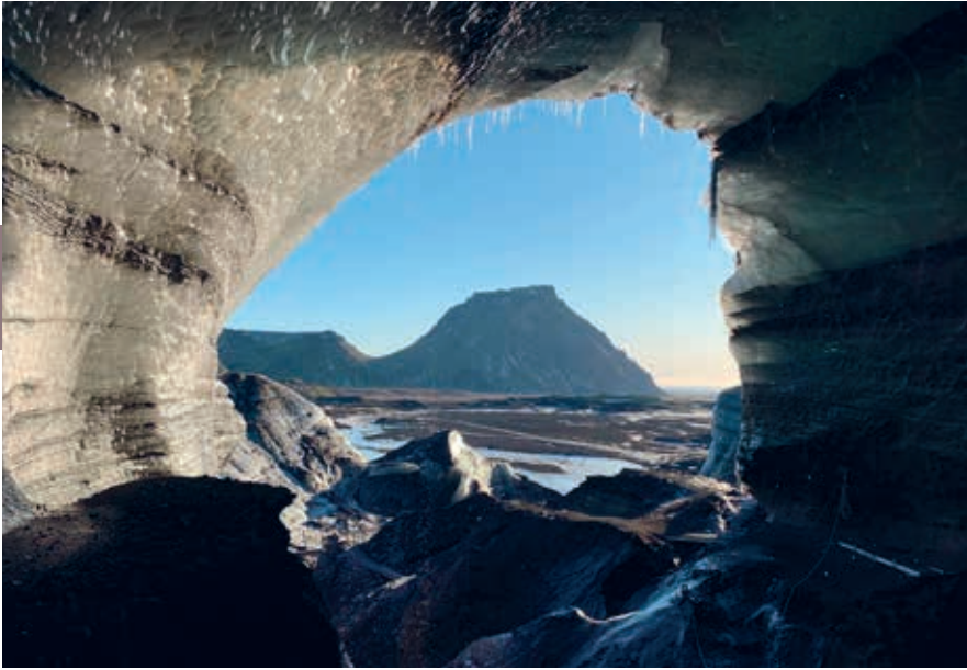
Ijsgrot op Katlajökull.

barsting van deze vulkaan. In de gletsjer bevinden zich diverse ijsgroten en ijstunnels. Onder begeleiding van een gids kun je een kijkje nemen in de binnenste lagen van de ijskap.