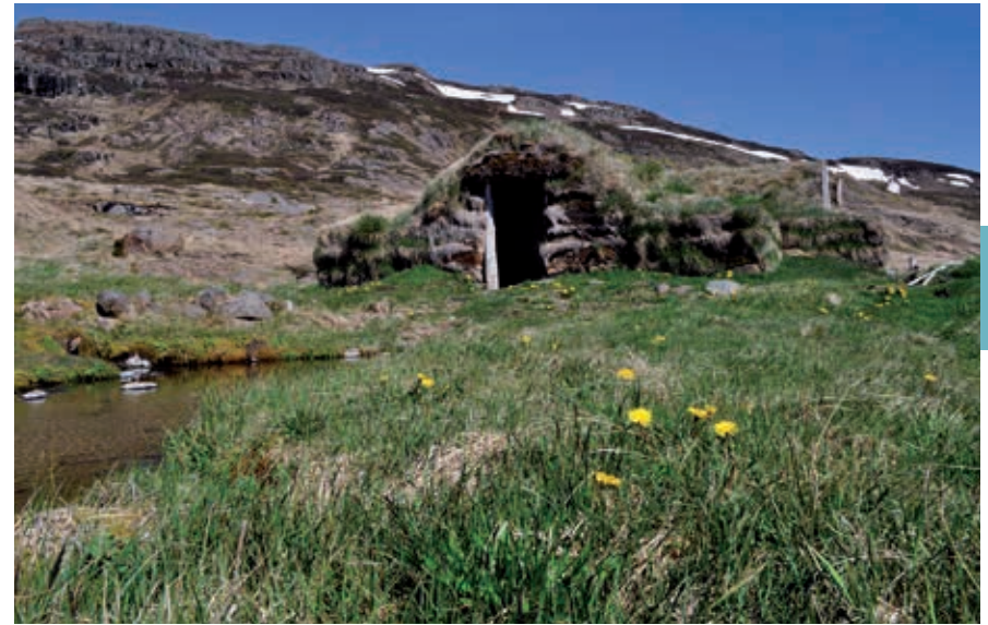
Turfhut in Bjarnarfjörður.

In het Þjórsárdalur zijn verschillende van deze vroegmiddeleeuwse boerderijen opgegraven. Ze werden in 1104 door een uitbarsting van de Hekla totaal verwoest. De bekendste is Stöng. In Keldur bevindt zich een goed geconserveerde middeleeuwse boerderij, waarvan de skáli waarschijnlijk uit de tweede helft van de 12de eeuw stamt. De andere vertrekken zijn er in de 19de eeuw bijgebouwd. Hier heeft men als antwoord op het