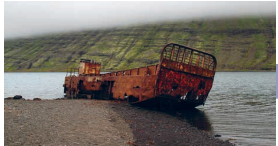
Verlaten scheepswrak in Mjóifjörður. Een rustplaats voor een oud Amerikaans landingsvaartuig, aan het eind van de wereld en aan het eind van een reis. Al 70 jaar is het overgeleverd aan de elementen.

Helgustaðir (weg 954) is de naam van een boerderij en een oude dubbelspaatgroeve. Dubbelspaat geeft een dubbele breking van het licht, waardoor je alles wat je onder een helder stukje dubbelspaat legt dubbel ziet. Van de 17de tot in de 20ste eeuw is de mijn in werking geweest. De grootste steen die hier gedolven is, weegt 230 kilo en is te bewonderen in het British Museum te Londen. Dubbelspaat werd gebruikt voor tal van instrumenten, zoals microscopen, tot de komst van kunststof. De bekende Nederlandse geleerde Christiaan Huygens (1629-1695) heeft de werking van het licht en derhalve het dubbelspaat uitvoerig bestudeerd. De groeve, die sinds 1975 beschermd natuurgebied is, is bereikbaar via een voetpaadje dat links van de weg bij een smalle parkeerstrook bij een informatiebord 400 m na het riviertje Helgustaðaá begint (15 min. heen en terug).