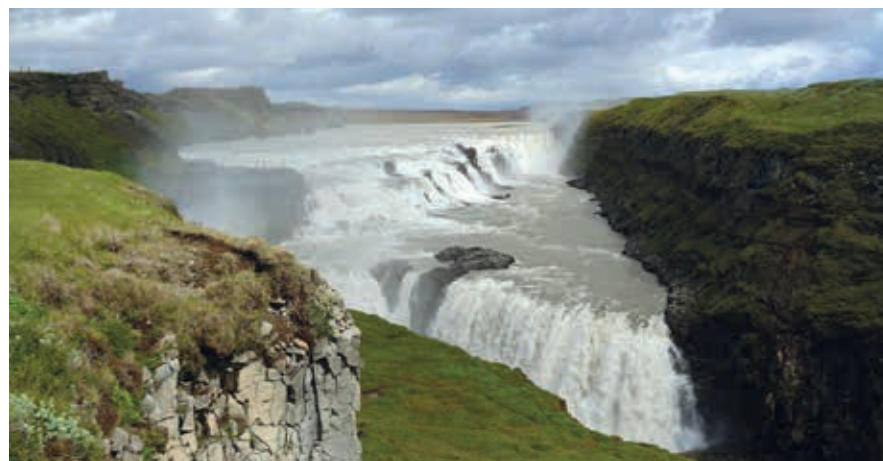
De gouden waterval Gullfoss.

houden. Zij dreigde zelfs zichzelf in de waterval te werpen als de waterval verkocht zou worden. Dat is uiteindelijk – weliswaar om andere redenen dan Sigríðurs dreigement – niet gebeurd. Sigríður ligt in het Haukadalur (bij Geysir) begraven; het informatiecentrum draagt haar naam. De waterval is inmiddels staats eigendom en tot beschermd natuurgebied verklaard. Vanaf de onderste parkeerplaats is het 5 minuten lopen naar de waterval.