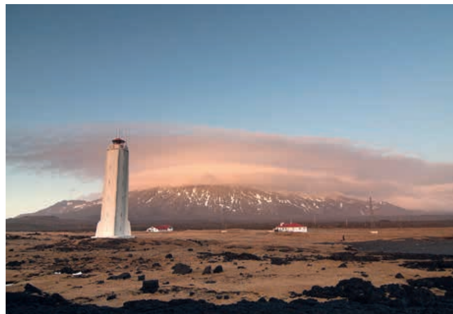
Magisch licht over Snæfellsjökull.

Er zijn ook verschillende rondvaarten mogelijk langs de vele eilandjes, sommige met mooie basaltformaties en aalscholverkolonies. Onderweg werpt de bemanning een net naar de bodem en vist zo weekdieren op, die vervolgens door de liefhebbers levend kunnen worden opgepeuzeld. Aan boord kun je onder andere witte wijn kopen voor bij de jacobsschelpen.