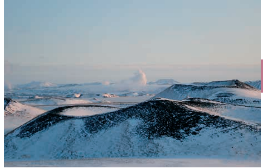
Pseudokraters bij Skútustaðir (hier in oktober).

Fijne materialen zoals sintels en as kunnen, zelfs op kilometers afstand van de vulkaan, dikke lagen vormen. Onder invloed van grondwater en temperatuur kunnen deze losse gesteenten verharden tot tuf of tufsteen. Tufsteenformaties komen op IJsland op veel plaatsen voor. Doordat ze sterk onderhevig zijn aan erosie, zijn ze vaak grillig gevormd. Naast in eerste in-