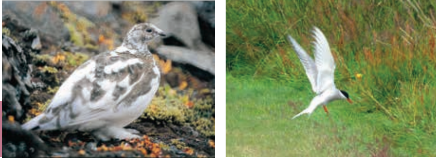
Links: Alpensneeuwhoen in Landmannalaugar. Rechts: De noordse stern. De IJslandse naam van dit vogeltje is kría , genoemd naar het geluid van deze nerveuze vogel. De kría vliegt in zijn leventje de afstand van driemaal naar de maan en terug.

de begroeiing. Ook wespen, bijen en vlinders en dergelijke komen voor op IJsland.