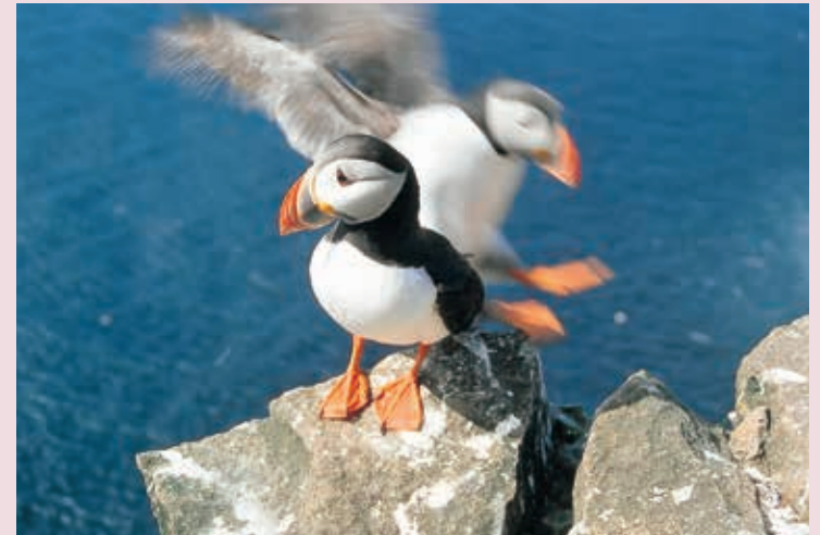
Papegaaiduikers vind je vaak op en rond rotsen.