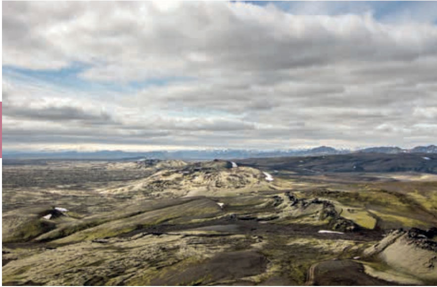
Vanaf de vulkaan Laki heb je een mooi uitzicht op de kraterrij Lakagígar.

hiervoor is tefra . Vooral wanneer het donker is, zorgt het voor spectaculair vuurwerk.